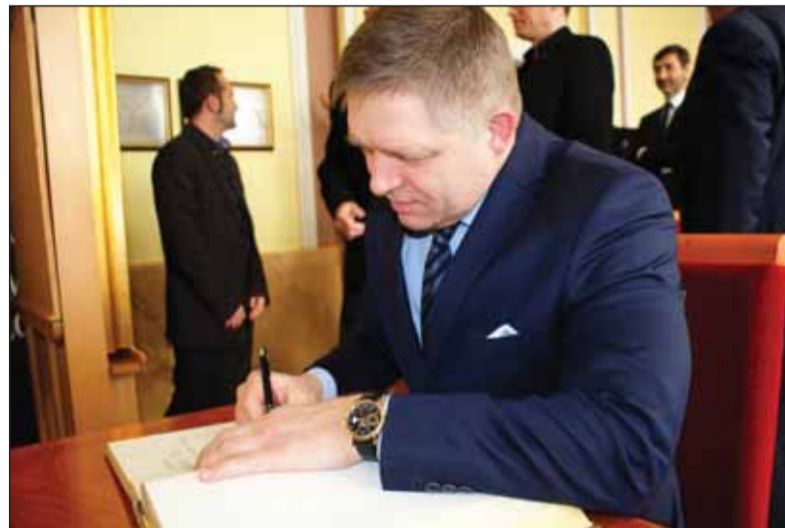
Ako bývalý predseda vlády SR navštívil R. FICO Maticu slovenskú v roku 2017. Na fotografii sa zapisuje do matičnej kroniky.

Aj keď v slovenskej aj v českej spoločnosti zaznievali hlasy, že júnové parlamentné voľby v roku