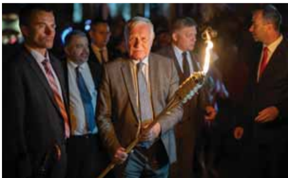
Vatru zvrchovanosti v Starej Bystrici zapálil aj strojca rozdelenia Česko-Slovenska bývalý český prezident Václav Klaus.