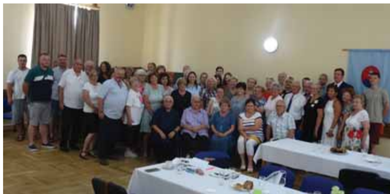
Delegáti a hostia krajského snemu MS Košického kraja