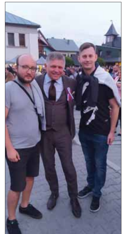
Robert FICO sa zúčastnil na oslavách Deklarácie o zvrchovanosti SR v Starej Bystrici. Pohyboval sa aj medzi slovenskou mládežou.

Hlasovanie bolo verejné a poslanci, ktorí hlasovali proti prijatiu, to formulovali tak, že hlasujú nie proti ústave ako takej, ale „proti tomuto zneniu ústavy“. Aj keď Ústava SR vznikla za krátky čas a došlo k viacerým novelizáciám, treba povedať, že ide o mimoriadne kvalitný dokument. Vtedajšie hlasovanie proti ústave týmito poslancami som vnímal skôr ako taký trucpudník, že v exponovanom čase nie sú oni hýbateľmi dejinných zmien.