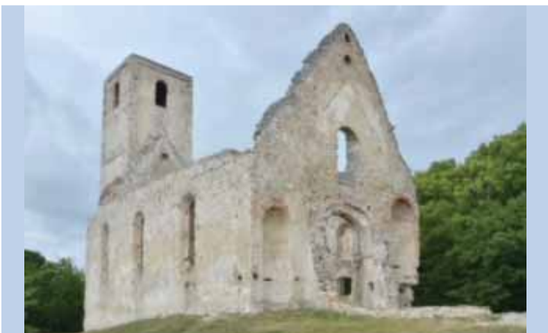
Národnú kultúrnu pamiatku – Kostol a kláštor sv. Kataríny Alexandrijskej pri Dechticiach – budú počas leta opravovať a skúmať dobrovoľníci.

Dušou postupnej obnovy pamiatky je predseda občianskeho