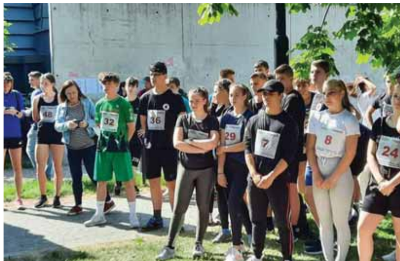
V súčasnom období to mladí atléti nemajú na Slovensku vôbec jednoduché.

Nielen však páni riaditelia, ale aj mnohí učitelia telesnej výchovy nemajú v tejto záležitosti čisté svedomie. Organizátori Plachého míľa si svojho času