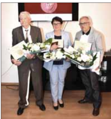
Ceny Ondreja Štefanka si prevzali zaslúžilí Slováci z Rumunska, Srbska a Maďarska.

organizovaniu a diverzifikácii kultúrneho života a spolkovej činnosti v slovenskom zahraničnom svete. Na slávnostný ceremoniál za účasti významných hostí zo Slovenska, Srbska, z Maďarska i Rumunska nadviazala dvojdná konferencia so zameraním na Osobnosti dolnozemskej Slovákov v literatúre a umení. Vyše tridsať referujúcich sa zameralo na parciálne výskumy života a diela osobností literatúry, výtvarného umenia, sochárstva i filmu. Za Maticu slovenskú sa prezenčne na konferencii zúčast-