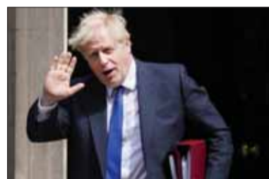
Pozdrav na rozlúčku

Za odvolaním Johnsona treba však vidieť hlbšie geopolitické hľadisko. To chce menšie vysvetlenie. Západ svoju prosperitu a blahobyt postavil v dvoch pilieroch. Prvý bol technologický náskok, ktorým sa začala priemyselná revolúcia, čo sekundárne umožnilo vytvoriť systém koloniálneho panstva. Druhým pilierom bolo následné vykrádanie a vykorisťovanie zvyšku planéty. Dynamika rastu Západu na čele s USA sa však vyčerpáva už od