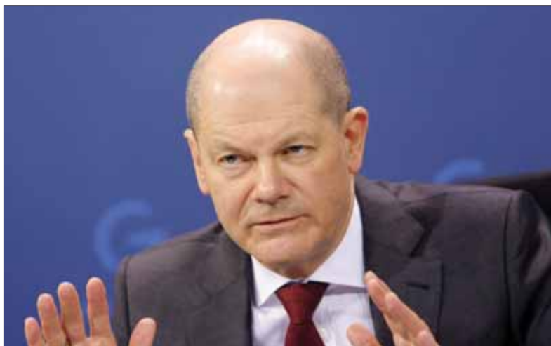
Nemecký kancelár Olaf SCHOLZ volá po väčšej vojenskej prítomnosti aj na Slovensku.

Pokiaľ ide o Ukrajinu, Nemecko ju bude podporovať dovtedy, kým to bude potrebovať, a to ekonomicky, humanitárnu pomocou, finančne, dodávkami zbraní, ale v miere