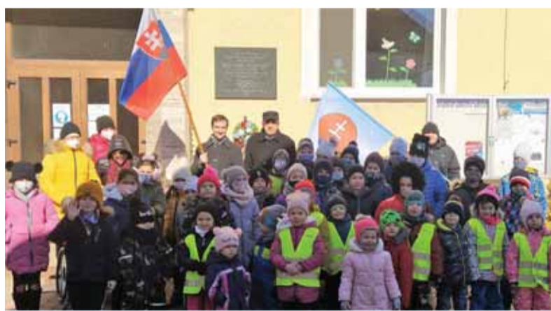
Spoločná fotografia pred materskou školou

sokolskej v Košiciach. Pravdepodobne aj vďaka tomu sa začala venovať výlučne športovej gymnastike. Na prvých pretekoch v Prahe v roku 1932 dosiahla tretie miesto (náradie, prostocvik, ľahká atletika). Po škole pracovala v Košiciach ako korešpondentka najprv v stavebnej firme, v rokoch 1934 – 1937 vo Východoslovenských elektrárnach. Naďalej sa venovala športu a popri práci poctivo trénovala. Odmenou jej bola účasť na olympijských hrách v roku 1936 v Berlíne ako členka druž-