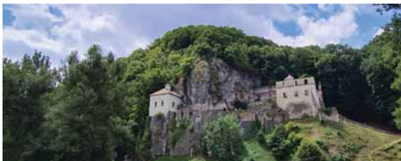
Malebný areál pútnickej Skalke sa stal miestom stretávania umelcov.

Miňali sa storočia, menila sa i tvár starobylej Skalke. Duch však zostával a pomáhal obnovovať dobro evanjelia i dobro slovenskej kultúry. Kultúry národa, ktorý sa nechával formovať i cez benediktínsku misiu, no zároveň už od začiatkov prispieval ku kultúrnemu bohatstvu Európy. Tak je to i v dnešnom čase zjednocujúcej sa Európy, čase opätovného usporadúvania budúcej podoby jej ducha. Ducha, ktorý bude ovplyvňovať formovanie národných kultúr. Rovnako ako národné kultúry budú formovať pokladnicu európskej kultúry.