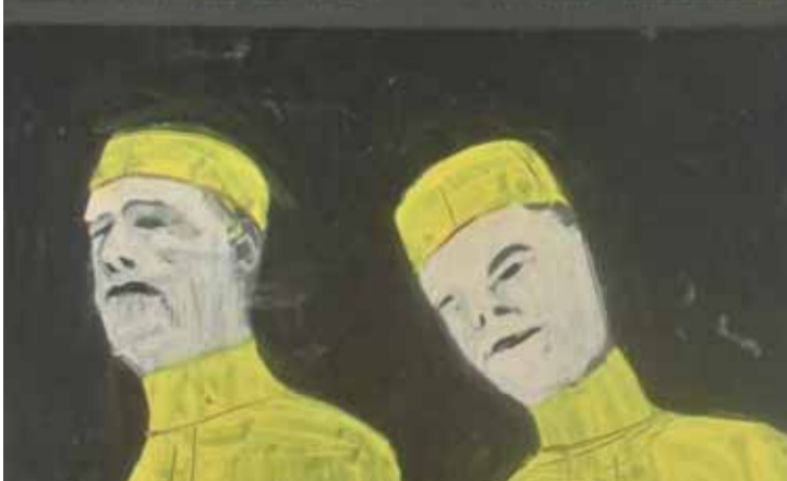
Orfeus a Euridika (scénografia, 1991; v zbierkach Slovenskej národnej galérie)

špičkovými profesionálnymi telesami v Čechách, Maďarsku a Taliansku. Rekapitulácia Votavovej scénografickej tvorby zahŕňa vyše 40 činoherných inscenácií, 27 oper a hudobných diel, desať baletov a takmer desať scénografií pre divadlo GUnaGU v Bratislave. Nebola mu cudzia scénografia pre veľké opery, ako aj scény pre malé divadielka či štúdiové formy. Pripomenieme tiež, že ako architekt kooperoval na viacerých televíznych a filmových projektoch. Za svoju scénografickú činnosť získal mnoho prestížnych ocenení – tak doma, ako i v zahraničí.