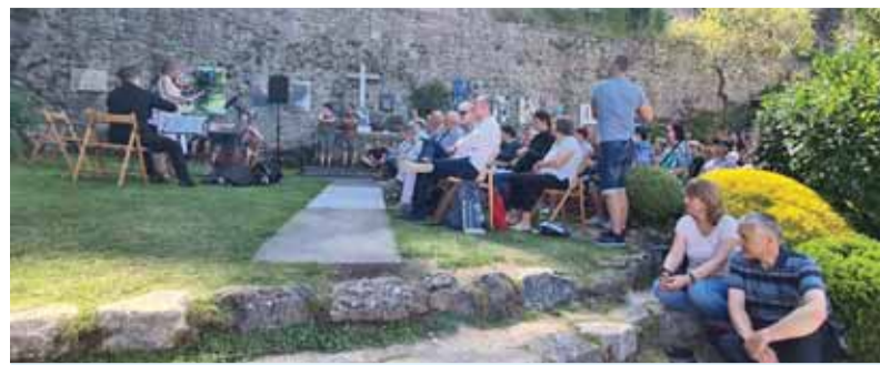
Účastníci jubilejného ročníka výtvarného a literárneho sympózia Ora et Ars

Od začiatku až podnes pri ňom aktívne ako koordinátor sekcie výtvar-