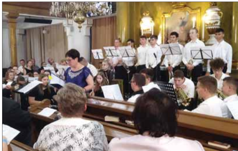
Slávnostné odovzdávanie cien Slovákov žijúcim v Maďarsku sprevádzal kvalitný kultúrny program.

Výstavu prác sarvašských slovenských tkáčov z dielne Ústavu kultúry Slovákov v Maďarsku