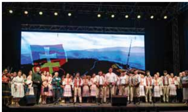
Na pódium v Starej Bystrici sa triedal jeden folklórny súbor za druhým. Vyvrcholením bolo vystúpenie tanečníkov z FS Partizán.

Súčasťou bohatého kultúrneho programu boli aj diskusie v rámci troch samostatných panelov. Vo vestibule miestnej základnej školy v prvom bloku „Čo dnes spája slovenskú a maďarskú politiku?“ mali pôvodne spoločne diskutovať poslanci Národnej rady SR Ľuboš Blaha (Smer – SD) a György Gyimesi (OLaNO). Po tlaku liberálnych médií, a pravdepodobne aj zo strany vedenia najsilnejšej koalície strany, poslanec Gyimesi na poslednú chvíľu odriekol svoju účasť. Je veľká škoda, že podľahol tlaku zhora. Mohli sme byť svedkami zaujímavej diskusie nielen o slovensko-maďarských vzťahoch, ale aj o vzájomnom chápaní postavenia národnostných menšín v Maďarsku a na Slovensku. Takisto sme sa mohli dozvedieť, ako pán poslanec Gyimesi vníma domácu a zahraničnú politiku maďarského premiéra Viktora