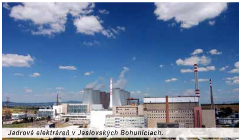
Jadrová elektrárňa v Jaslovských Bohuniciach.

Slovensko žiada zvýšenie podpory pri úhrade nákladov spojených s predčasným odstavením dvoch blokov jadrovej elektrárne V 1 v Jaslovských Bohuniciach. Robí tak oprávnene, keďže Litva a Bulharsku EÚ zo zdrojov Európskej banky pre obnovu