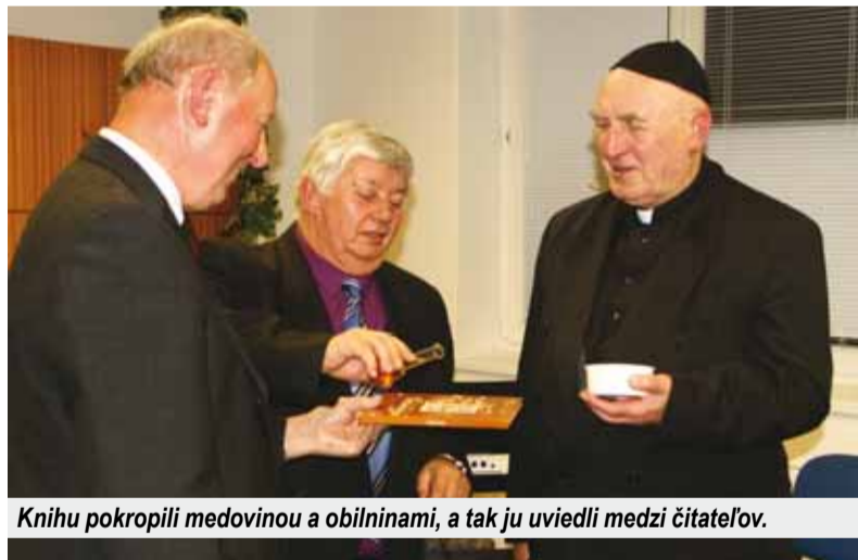
Knihu pokropili medovinou a obilninami, a tak ju uviedli medzi čitateľov.