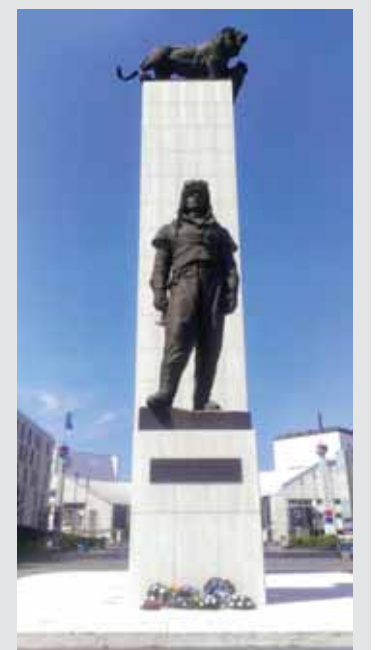
Aj koncepciu tohto súsošia ako pamätníka Milanovi Rastislavovi Štefánikovi v Bratislave na Pribinovej ulici sprevádzajú rozporuplné názory.