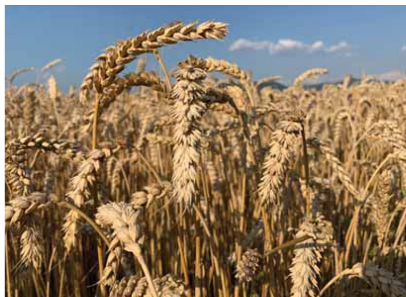
Ukrajinské obilie likviduje slovenských pestovateľov kvalitnej a hlavne zdravej slovenskej pšenice. Naš trh zaplavilo obilie plné nebezpečných pesticídov. A štát nekoná dostatočne razantne.

Poľsko okamžite pozastavuje dovoz ukrajinského obilia. Tento krok, dohodnutý spoločne s Ukrajinou, nasledoval po vlnách sociálnych nepokojov a rezignácii poľského ministra poľnohospodárstva. Súvisí s ochranou domácich producentov. Po začatí vojny bola Ukrajina nútená