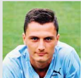
Legendárny futbalista Peter DUBOVSKÝ zomrel po tragickej udalosti v Thajsku.