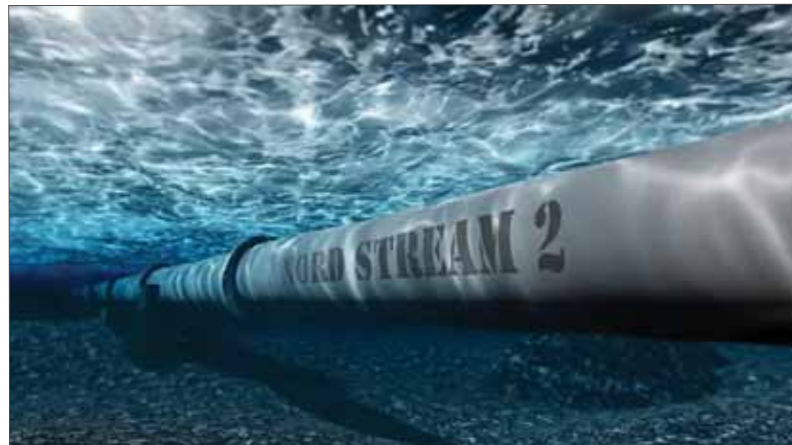
Dve vetvy plynovodu Nord Stream vedú po dne Baltického mora. Obe zničil masívny výbuch po záškodníckej akcii.

Rezolúcia mala mať šancu na schválenie. Potrebovala najmenej deväť hlasov za a nijaké veto od niektorého z piatich stálych členov Bezpečnostnej rady. Všetky krajiny, ktoré sa zdržali, zhodne argumentovali, že už prebieha vnútroštátne vyšetrovanie orgánmi Dánska, Švédska a Nemecka. Navrhovateľ rezolúcie prostredníctvom svojho veľvyslancu