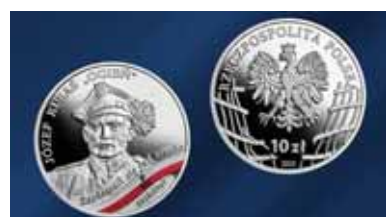
Minca Poľskej národnej banky oslavujúca vraha