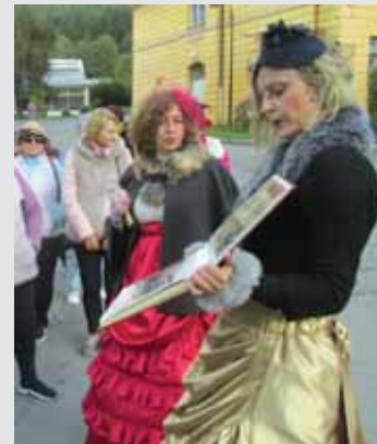
Dvojica sprievodkyň v dobových šatách približuje záujemcom históriu Bardejovských Kúpeľov.