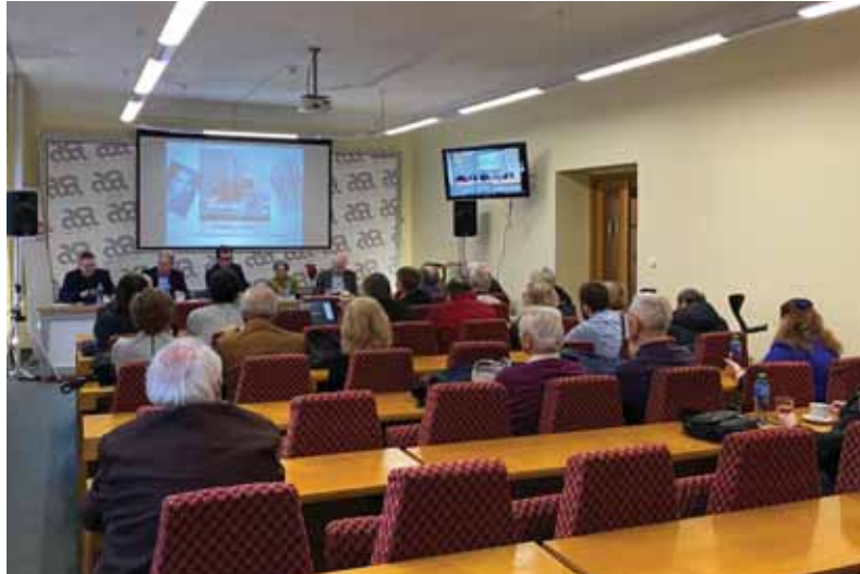
Zaujímavú besedu o Danielovi Okálii organizovala Matica slovenská.