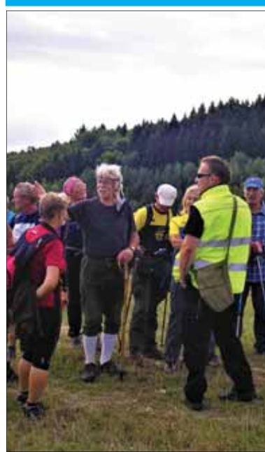
Zrejme už nikto neobnoví niekdajšiu tradíciu Sto jarných kilometrov. Pohodová turistika nie je naháňanie dištancii a vzdialeností, ba nie je ani prekonávaním seba samého, iba ak našej vlastnej pohodlnosti...

Pravda, poznám takých, ktorí chodia do prírody zásadne sami. Má to svoje výhody i nevýhody. Výhodou je, že ak idem sám a ticho, som intímnejšie spätý s prírodou, ľahšie mi odhalí mnohé tajomstvá. Teraz mnohých odrádza i strach z medveďov. Správy v médiách o tragických stretnutiach obavy znásobujú. Napriek tomu, že som sa sám túlal po takých „medveďích horách“, ako je povedzme Veľký bok v Nízkych Tatrách, Poľana alebo tiché kúty Slovenského rudohoria, ba dovolil som si tam prespať „pod širákom“, mackovia sa mi úspešne vyhýbali, hoci stopy ma upozorňovali, že nie sú odo mňa ďaleko. Ako turistický „greenhorn“ som bol z toho smutný, teraz ako „starý vlk“ som tomu celkom rád. Najmä pre nás skôr narodených je výhodnejšia turistika v partii. Nijaká „masovka“, ale tak v trojici, štvorici. Je to dôležité i z hľadiska bezpečnosti, ale najmä máme možnosť prehodiť slovo-dve, upozorniť sa navzájom na niečo pozoruhodné a na záver zhodnotiť túru pri pive či čaji s rumom. Takýto „doping“ považujem za úplne normálny, samozrejme, v primeranom množstve. Takže, priatelia, turisti, „oficiálni“ i sviatoční, želám vám všetkým veľa zážitkov na jarných turistických chodníkoch. Spoznávajte naše milé Slovensko.