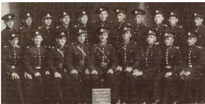
Generácia prvých dobrovoľných hasičov z Trenčína-Opatovej

Už v júni 1920 sa dostal na audienciu u ministra pre správu Slovenska, kde žiadal podporu pre organizačné úsilie hasičstva na Slovensku. Bez-