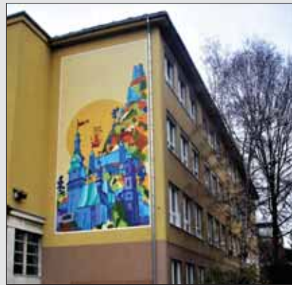
Za štyri dni vznikla na fasáde ZŠ na Jilemnického ulici vo Zvolene takáto „mural maľba“ s dominantami mesta