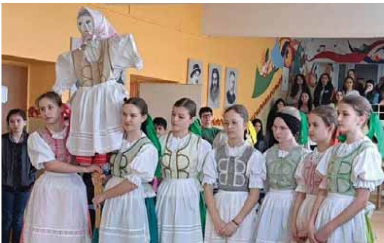
Členky folklórnej skupiny Nežabudka vo Spišskom Štvrtku pri vynášaní Moreny