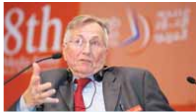
Známe investigatívne novinárske eso Seymour HERSH

Masívne výbuchy na dne mora v blízkosti dánskej a švédskej ekonomickej zóny sa udiali 26. septembra minulého roka. Explózie poškodili obe vetvy Nord Streamu 1 a jednu vetvu plynovodu Nord Stream 2. Útok na plynovody prepravujúce zemný plyn po dne Baltického mora z Ruska do Nemecka sa stal najväčším aktom priemyselného terorizmu v histórii.