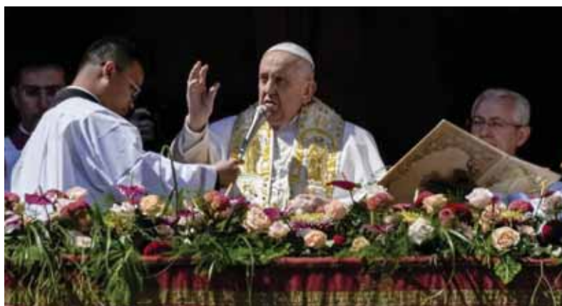
Pápež František počas veľkonočnej vigílie už po niekoľký raz vyzval na mier vo svete a na hľadanie nádeje pre ľudstvo.

Na vlnajúcu písomnú žiadosť štyridsiatich piatich poslancov Európskeho parlamentu, adresovanú pred-