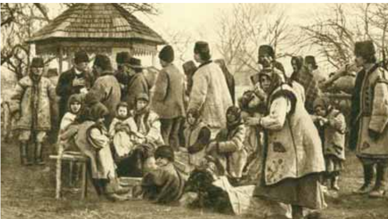
Beskydníci chránili bezbranných spoluobčanov neraz s nasadením vlastného života, preto ich prostý dedinský ľud podporoval.

viediecke hnutie poľských a rusínskych roľníkov, bolo povstanie Alexandra Kostku-Napierskeho.“