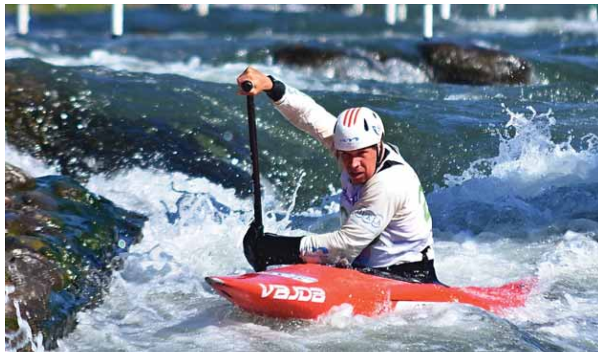
Dvojnásobný olympijský víťaz v maximálnom nasadení na trati vodného slalomu