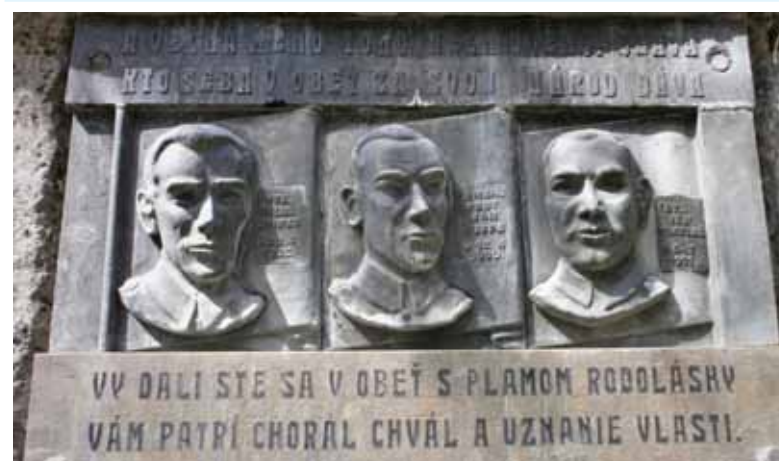
Pamätná tabuľa SNP padlým členom DHZ v Demänovskej doline

prostredným výsledkom rokovania bolo ministerské nariadenie županom, v ktorom minister poukázal na nutnosť organizovania hasičskej služby na Slovensku a zrevidovania hasičských zborov. Minister požiadala župné úrady, aby podporili Nemáka v jeho organizačnej práci a aby upozornili existujúce zbory na jeho organizačné zámery.