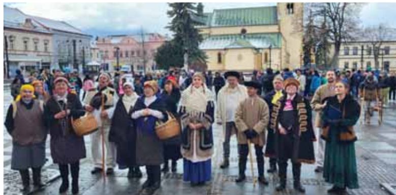
Na Námestí Žiadostí slovenského národa v Liptovskom Mikuláši matičiari pripravili spomienku na túto významnú udalosť pred 175 rokov.

Toto mikulášske námestie sa stalo svedkom udalostí, ktoré predznamovali revolučný rok 1848 a ktoré poznáme pod názvom JAR NÁRODOV. Vyžadovalo si to nesmiernu osobnú statočnosť predstúpiť pred verejnosťou s požiadavkami národa, ktorý sa začal len prebúdzat' a ktorý vrchnosť neuznávala. Slovenskí vlastníci vyslali z Liptova jasný signál, že tu pod Tatrami žije národ, ktorý sa hlási o svoje práva a hľadá si miesto v Európe. Vtedy hrozilo pre vyhlasovateľa, ako aj pre zostavovateľov Liptovských žiadostí prenasledovanie, perzekvovanie za ich názory. Boli to však odvážni národovci, pre ktorých slovo národ, národné práva, národná sloboda neboli len prázdnyimi pojmi, pre ktoré sa dokázali obetovať