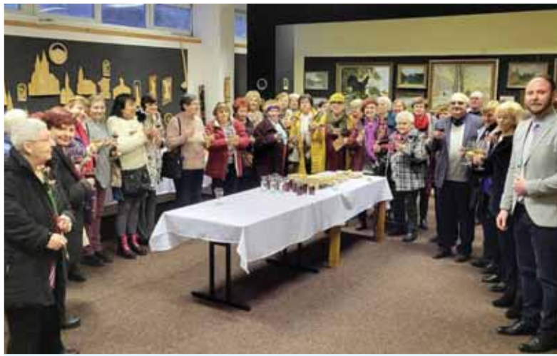
Atmosféra matičného stretnutia počas sviatku žien v Liptovskom Mikuláši