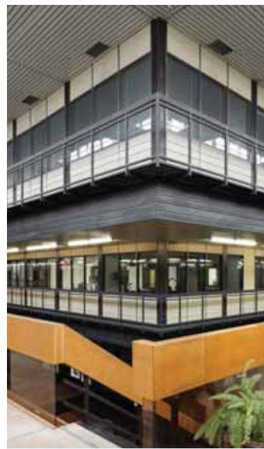
Interiér architektonicky hodnotnej budovy obrátenej pyramídy Slovenského rozhlasu v Bratislave.

ril vedením sedemdesiatčlennej Hlavnej redakcie literárno-dramatického vysielania rozhlasu v Bratislave?