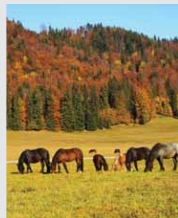
Noriky na paši vo voľnej prírode na Muránskej planine