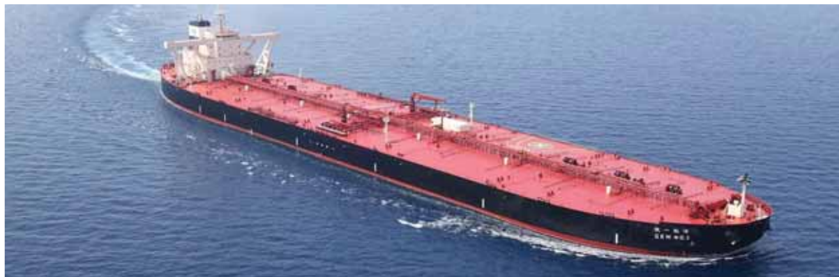
Tankery na prepravu ropy nahradzujú Ruskej federácii obchod s Európou cez známe ropovody. Rusi boli na sankcie voči vývozu fosilných palív dostatočne pripravení.

Európska únia už chystá jedenásty balík sankcií. Cieľom doterajších reštrikcií bolo spôsobiť Ruskej federácii vážne hospodárske straty pre vojnu na Ukrajine. Nereálnosť týchto cieľov jasne preukazuje prax ako v prípade vývozu ruskej ropy po mori.