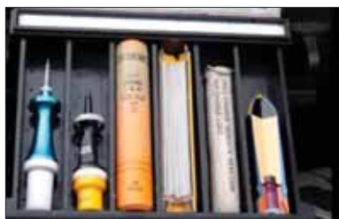
Munícia s ochudobneným uránom, ktorá sa používa v tankoch Západu v rusko-ukrajinskom konflikte.

Začiatkom mája dunela obrovská explózia v Pavlograde. Pôsobením atmosférických javov ju sprevádzala nezvyčajná žiara, ktorá pripomínala nukleárny útok. Podľa odborníkov takto exploduje raketové tuhé palivo. V meste je pobočka závodu Južmaš, ktorý produkuje rakety už od sovietskych čias. Došlo k zničeniu vlakových súprav s vojenskou technikou a k zásahu priestorov tamojšej chemickej továrne, kde sa vyrábali výbušniny.