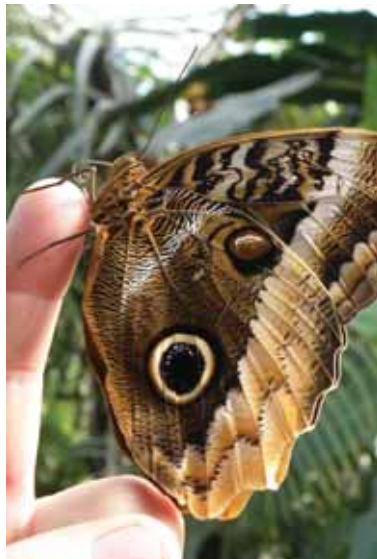
Z výstavy motýľov v Botanickej záhrade UPJŠ v Košiciach

výstavy je skutočnosť, že po minuloročnej prezentácii sa jeden z druhov motýľov pochádzajúcich z trópov Strednej a Južnej Ameriky v skleníku Viktória dokonca usídlil. Populácia prežila