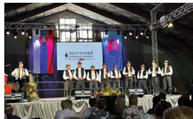
Partnerom osláv 160. výročia Matice boli aj Slovenské národné noviny.