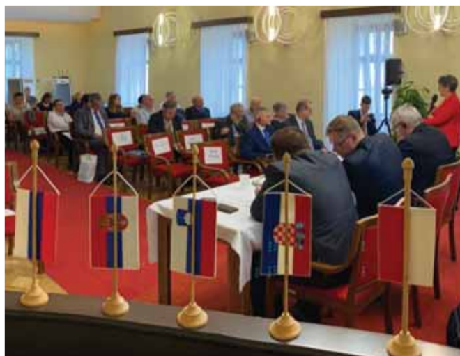
Matičné oslavy sa začali rokováním piateho Kongresu matic a inštitúcií slovanských národov. Zúčastnili sa na ňom zástupcovia takmer všetkých slovanských európskych národov.