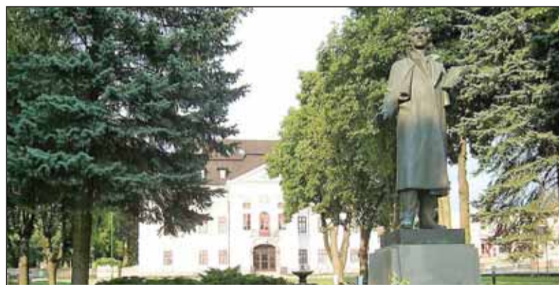
V rodných Mošovciach pripomína význam Jána KOLLÁRA pre národný život a uvedenie Slovákov jeho portrétny pamätník v nadživotnej veľkosti.

Z Nemecka odišiel do metropoly Maďarska, kde pôsobil ako evanjelický farár. Kollár v Budapešti konfirmoval Petőfiho aj Košuta (od roku 2011 je tu aj pamätná tabuľa). Počas revolúcie pôsobí vo Viedni ako dôverník vlády pre otázky Slovenska, pričom podáva návrh na samosprávu Slovenska a na slovenské školy s českým vyučovacím jazykom, čo sa stalo kontroverzným momentom v dejinách národného obrodzenia. Po revolúcii sa stal mimoriadnym profesorom slovanskej archeológie na univerzite vo Viedni. Len čo získal profesorský titul vo Viedni, vyznamenala ho k šesťdesiatym narodeninám českým dokto-