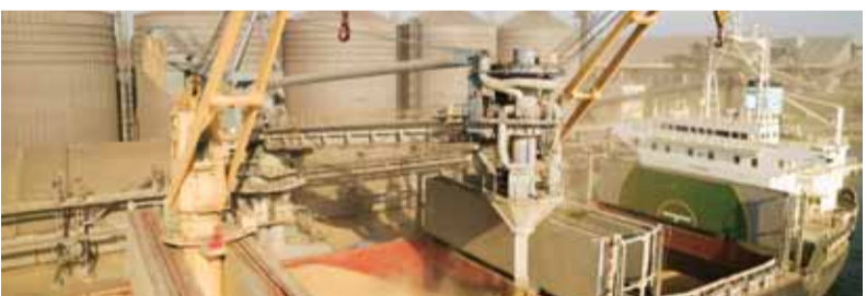
Nákladné lode, ktoré prevážali ukrajinské obilie cez Čierne more, viezli noraz aj iný náklad ako pšenicu...

OSN odhaduje, že dohoda o obilninách znížila ceny potravín od marca 2022 o vyše dvadsaťtri percent.