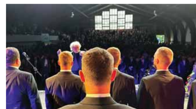
Slovenskú i matičnú hymnu spievalo vyše tisíc návštevníkov v športovej hale.