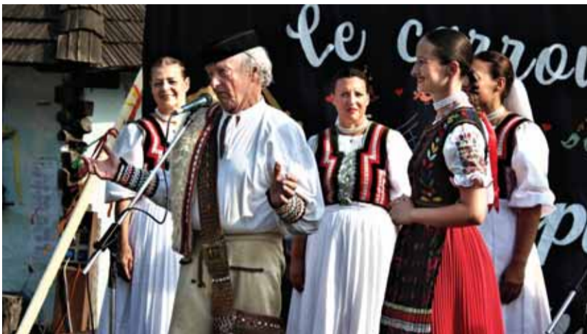
V humenskom skanzene sa v polovici júla uskutočnila súťažná prehliadka hudobného folklóru dospelých.

Porotcovia konštatovali vysokú úroveň prejavu speváckych skupín a tiež kvalitný výber piesňového materiálu. Spomienkový diplom so zlatým pásmom si z Humenného do Paríža odniesli aj speváčky krajského súboru Nadeje Paríž. Spevácke skupiny Bosoročky a Hačure z Humenného a Cimbor z Belej nad Cirochou budú 14. – 18. augusta tohto roku reprezentovať humenský región na medzinárodnom festivale Radosť na brehu mora na Slnecnom Brehu v Bulharsku. Želáme im veľa umeleckých úspechov.