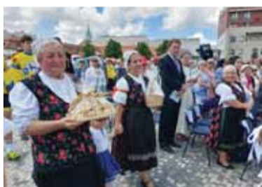
Atmosféra slávnosti Nitra, milá Nitra