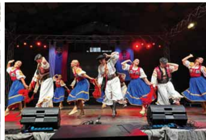
Ďalším večerného galaprogramu bolo vystúpenie Slovenského ľudového umeleckého kolektívu pod názvom SĽUK Matice, Matica SĽUK-u – bolo to výnimočné vystúpenie.