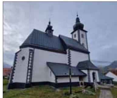
Kostol sv. Jána Krstiteľa v Liptovskom Jáne pred obnovou a po nej

na Cenu Fénix – Nadácie SPP – za najvydarenejšiu adaptáciu NKP v jej šiestnástom ročníku. V predošlom ročníku získal Cenu Fénix kostol rovnakého mena na cintoríne v Modre, úzko spojený s menom Ľudovíta Štúra. Akosi som preto neveril, že by sa voľba zopakovala. Viac som medzi tridsiatimi šiestimi navrhnutými a dvadsiatimi vybranými do finále favorizoval za najkrajšiu pamiatku roka dlhodob zachraňovaný a adaptovaný Kostol sv. Žofie v Zborove, na ktorom sa devastačne podpísali obidve svetové vojny. Ten získal čestné uznanie. Rozhodlo šestnásťtisíc hlasov spomedzi šestdesiatdvoch tisíc hlasujúcich, že najvydarenejšou i najpôsobivejšou rekonštrukciou prešiel opäť Kostol sv. Jána Krstiteľa – tentoraz však v Liptovskom Jáne. Na hrade Červený kameň odborná porota udelila cenu aj Meštianskemu domu č. 12 na námestí SNP v Banskej Bystrici, Mestskej veži v Brezne a za vynikajúci počín aj združeniu Čierne diery za záchranu NKP Železiareň v Betliari.