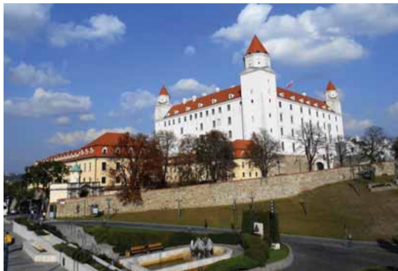
Zápasy o Slovensko neustávajú ani po tridsiatich rokoch samostatnosti. Na hradnom kopci v Bratislave sa odohráva politika, ktorá pravých vlastencov naplnia rozpakmi a rozčarovaním.

delábrosch po celej Mudroňovej ulici v Bratislave“. Spomínam si aj na to, ako sme hľadali ľudí na kandidátku, pretože sa báli za SNS kandidovať. Obdobie, keď bol premiérom Vladimír Mečiar, vnímam tak, že sa usiloval urobiť pre Slovensko všetko, ako najlepšie vedel. Bol to premiér, ktorý naozaj kontroloval všetkých svojich ministrov, či robia svoju prácu tak, ako majú. Bol tiež premiérom, ktorý Slovensko začal stavať od toho povestného základu. Porovnajme si, čo