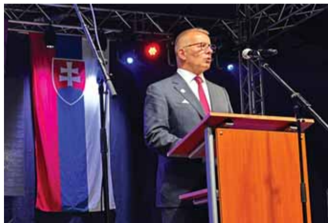
Večerný sobotný galaprogram sa začal prejavom predsedu parlamentu Borisa KOLLÁRA. Ostatní dvaja ústavní činitelia prezidentka Zuzana Čaputová a premiér Ludovít Ódor oslavy odignorovali a neposlali na ne ani svojich zástupcov.