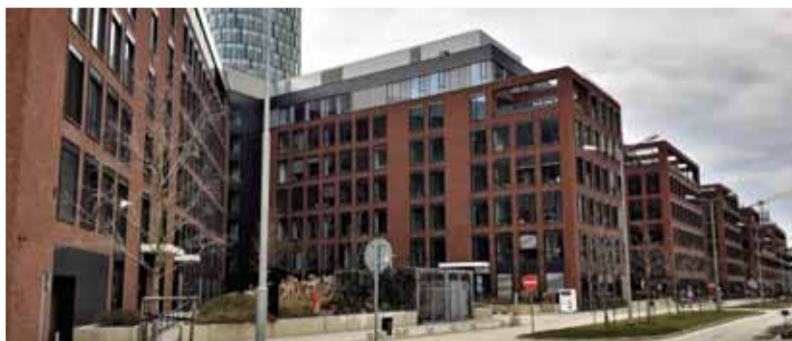
Nový bytový komplex v širšom centre Bratislavy.

V predchádzajúcich rokoch sme konštatovali medziročný päťinový nárast cien nových bytov. V tomto roku ich ceny medziročne klesajú do piatich percent, a to aj napriek tomu, že ceny stavebných a mzdových nákladov sa výrazne zvyšujú. Z predajných zmlúv developeri už vynechávajú inflačnú doložku. Namiesto nej ponúkajú rôzne benefity – kuchynskú linku, miesto na parkovanie zdarma, ale aj bonifikáciu hypotekárneho úveru na obdobie do troch rokov za úrok do 1,5 percenta. K zásadnej zmene dochádza