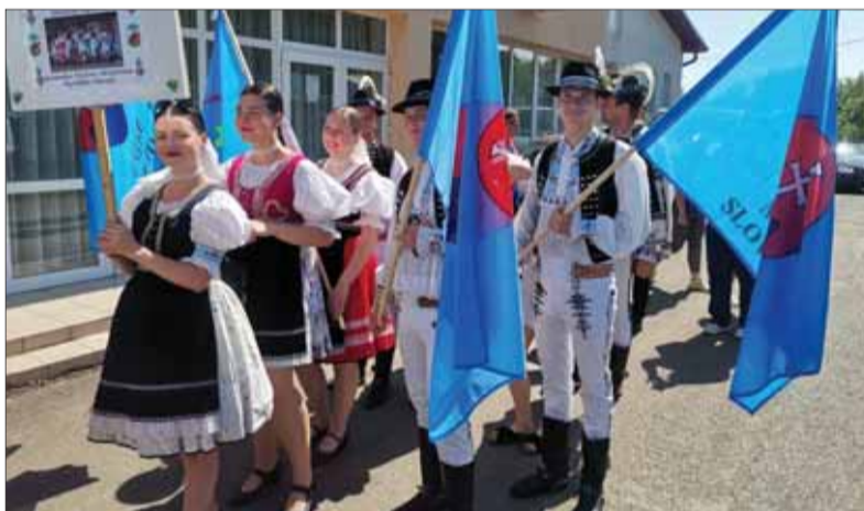
Na mládežníckom folklórnom festivale v rumunskom Čerpotoku, kde žije početná slovenská menšina, sa zúčastnil aj súbor Orgonina z Vranova nad Topľou.