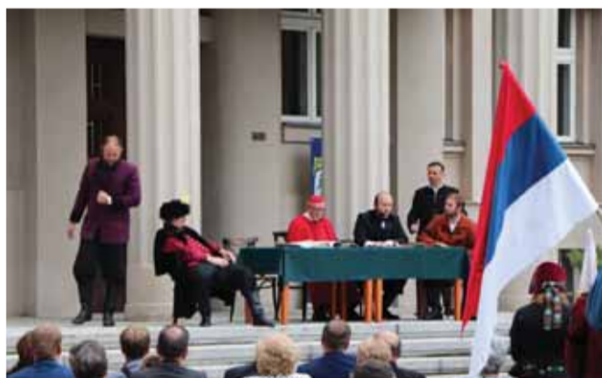
Piatkový program osláv začal divadelnou scénkou matičných ochotníkov, ktorí takto pripomenuli zakladajúce Valné zhromaždenie Matice z roku 1863.