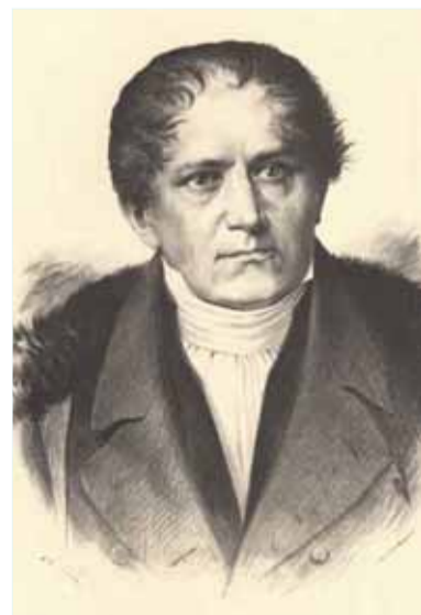
Ján KOLLÁR patrí k najvýznamnejším predstaviteľom slovenského kultúrneho a spoločenského života z prelomu 18. a 19. storočia.

Vízia zjednotených a spolupracujúcich slovanských národov – to bol sen, ktorý si želal veľikán Ján KOLLÁR. Koncom júla to bolo dvestotridsať rokov od narodenia spisovateľa, politika, filozofa, básnika, jazykovedca, kňaza, zberateľa ľudovej slovesnosti, autora Slávy dcery a ideológa druhej vlny národného obrodzenia. Maticári z Mošoviec sa minulý rok zúčastnili na spomienkovej udalosti pri príležitosti sosedemdesiateho výročia Kollárovho úmrtia a navštívili aj miesto Kollárovho odpočinku. Obec Mošovce spojila oslavy 790. výročia prvej písomnej zmienky s 230. výročím narodenia Jána Kollára (29. až 30. júla 2023). Matica slovenská pripojila svoju záštitu nad týmto podujatím.