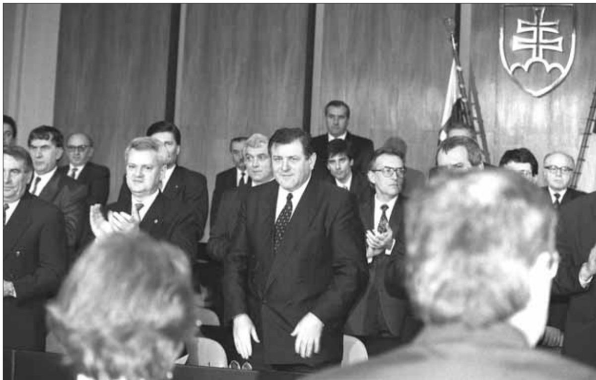
Oslavy vzniku Slovenskej republiky 1. januára 1993 za účasti vtedajších čelných predstaviteľov novovznikajúceho štátu Slovákov

Pramene dobová denná tlač: Pravda, Smena, Národná Obroda, Lidové noviny, Mladá fronta dnes.