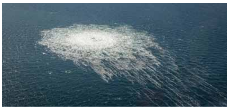
Unikajúci plyn z poškodeného plynovodu Nord Stream na dne Baltského mora

Začiatkom októbra Ukrajina vykonala diverznú akciu na Krymský most. Moskva po následnom vyšetrení dospela k záveru, že výbuch z 8. októbra bol teroristickým činom, zameraným na zničenie ruskej civilnej kritickéj infraštruktúry. Ruský prezident Vladimir Putin to okomentoval slovami: „Je tiež jasné, že organizátori a páchatelia útoku boli ukrajinské špeciálne služby. Kyjevský režim dlhodobo používa teroristické metódy.