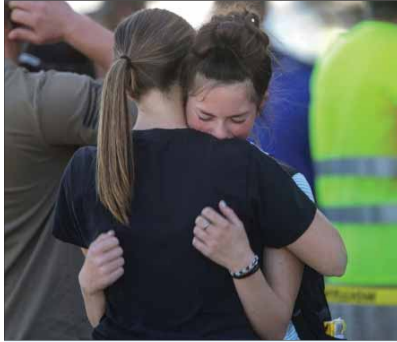
Nízke sebavedomie patrí najmä k obdobiu puberty. Nie každý mladý človek má problém s nízkym sebavedomím, ale dá sa povedať, že každý v tomto období rieši vlastnú hodnotu.

Nízke sebavedomie sa týka ľudí všetkých vekových kategórií. U malých detí hovoríme v súvislosti s podobným správaním o hanbení sa – niektoré deti sú hanblivejšie, iné