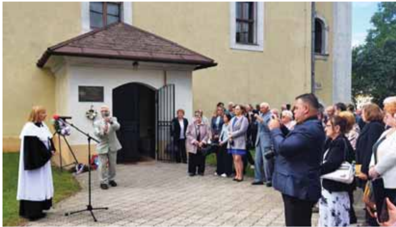
Prihovor zborovej farárky k účastníkom podujatia pred evanjelickým kostolom v Revúcej

Pod záštitou prezidentky Slovenskej republiky Mesto Revúca, Múzeum Prvého slovenského gymnázia, Gymnázium Martina Kukučína a Mestské kultúrne stredisko v Revúcej zorganizovali bohatý slávnostný program, v ktorom nechýbali aj zástupcovia Matice slovenskej.