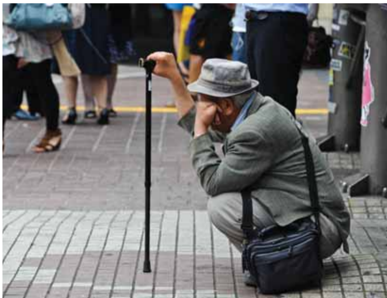
Slovenskí dôchodcovia si ani po zmene dôchodkového systému nebudú môcť dovoliť užívať jeseň svojho života ako v západných krajinách.

Nárok na odchod do dôchodku pre budúcich penzistov narodených od roka 1967 bude závisieť od strednej dĺžky života a od počtu vychovaných detí. Predpokladá sa, že sa bude zvyšovať o dva mesiace ročne, ženám sa za každé vychované dieťa bude znižovať o šesť mesiacov, maximálne však o osemnásť mesiacov. O odchode do penzie sa dozvie príslušný ročník šesť rokov vopred. Pokiaľ ide o nárok na predčasný dôchodok, tak budúci predčasný dôchodca musí mať odpracovaných štyridsať rokov