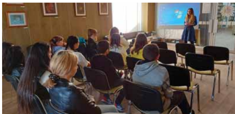
Ak sa dejinné fakty predostrú mládeži príťažlivou a zaujímavou formou, potom je o záujem a pozornosť postarané.

V tomto roku si pripomíname viaceré dvojsté výročia osobností štúrovskej generácie. Z iniciatívy Matice slovenskej sa už uskutočnili vedecké, populárno-náučné a osvetové podujatia a pre širšiu verejnosť je naporúdzaj aj výstavný projekt Odkaz štúrovskej generácie, ktorého hlavným cieľom je priblížiť a spropagovať životné osudy, činnosť a odkaz štúrovskej gene-