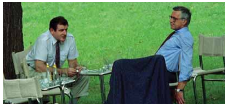
Hodinové diskusie slovenského a českého premiéra V. Mečiara a V. Klause napokon viedli k ústavnému rozdeleniu Česko-Slovenska. Či sa to niekomu páči, alebo nie, sú považovaní za otcov vtedy vzniknutých republík.

republiky by len delegovali časť kompetencií, na ktorých by sa vzájomne dohodli, na federálnu úroveň. Pre viacerých právnych puristov z českej strany to bolo neprijateľné. Najbližšie k reálnej dohode boli obe delegácie pri takzvanom Havlovom kompromise na stretnutí 3. novembra 1991 na Hrádečku. Havel navrhoval, aby zmluvu