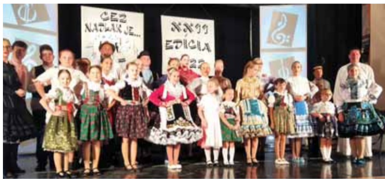
Záverečná „klaňáčka“ na nadlacom festivale krajanských ľudových piesní