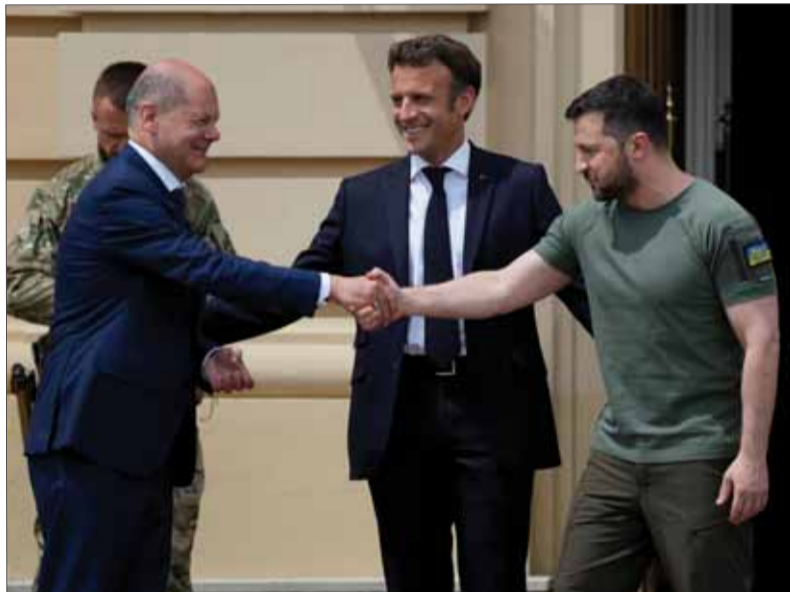
Nemecký kancelár Olaf SCHOLZ a ukrajinský prezident Vladimir ZELENKYJ dohodli mnohé formy podpory Ukrajiny zo strany Nemecka.

Jedným z nástrojov, ako sa zorientovať, je pohľad na pomery v štáte najväčšej európskej ekonomiky – nemeckej ekonomiky európskeho priemyslu. Pohľad na stránky kapitálovo vplyvných Frankfurter Allgemeine Zeitung (5. 10.) môže len zdanlivo prekvapiť, keďže sa venujú zisteniam o psychologickom stave nemeckého obyvateľstva. Ako sa Nemci vyrovnávajú nielen s terajšou krízou, ale najmä s novým javom – hromadením kríz. To, čomu čelíme, je polykríza – z jednej krízy prechádzame do druhej. Začalo sa to finančnou krízou pred desiatimi rokmi, pokračovalo rokmi covidovej krízy a epidémie, z ktorej sme doteraz nevyšli, a očakáva sa jej ďalšia vlna. Do toho prevratne vstúpila vojna, sankcie, energetická kríza, bezohľadné nasadenie hladu a energií ako zbrane. To všetko spôsobilo nevídaný rast celosvetový rast cien. To tu desaťročia nebolo.