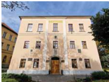
Evanjelické lýceum hostilo veľa budúcich osobností, dnes hostí vzácne knihy.

Stredoveký Kežmarok vznikol z troch osád s vlastnými kostolmi – na ľavom brehu rieky Poprad stál Kostol sv. Michala, patriaci osade strázcov hraníc, druhú obývali slovanskí rybári, ktorí ju rozšírili až po kežmarský Kostol sv. Kríža. Na dnešnom mieste hradu ležala tretia osada a Kostol sv. Alžbety. Kežmarok získal v roku 1269 mestské výsady a od roka 1368 ho chránili hradby. Názov je odvodený z nemeckého slova syr, z neho Käsmark, teda trhovišisko so syrom. V 15. storočí sa pozícia mesta posilnila oslobodením obyvateľov od platení cla a tridsiatku na celom území Uhorska a možnosťou usporadúvať dva výročné trhy, právom skladu i meča. Od roka 1463 používaním erbu a pečate. Vývoj brzdlil spory s Levočou i hradnými páni, plienenie husitmi, ktoré viedlo k stavbe hradu. Práve Kežmarský hrad sa stal postrachom pre obyvateľov mesta. Napríklad spišský župan Zápoľský dal postaviť mohutné opevnenie so strielňami aj z mestskej strany. Vrcholom nepriateľstva bol neúspešný pokus mešťanostov