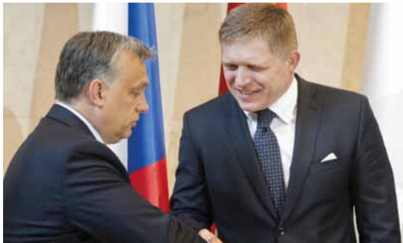
Podarí sa Viktorovi Orbánovi rozšíriť v strednej Európe zoznam štátov, ktoré verejne kritizujú Brusel? Zatiaľ sa zdá, že nie...

Ak čitateľ v tomto slovníku nachádza echo, odozvu tunajších médií a slovníka opozičných politikov, nemýli sa. Autorka rozšíreného nemeckého denníka dala svojím názorom, citujúcim doslova terajšiu slovenskú opozíciu, titulok: Bude to brutálne. Ale aspoň nech vláda udrží proeurópsku, prozápadnú politiku a v domácej nech sa už deje čokoľvek. Uvádzame to preto, aby bolo zrejmé, ako záleží zahraničiu na tom, ako sa bude dať občanom dodržiavať politiku. Najmä aby sa dodržiavala prozápadná politika. Je to naozaj brutálne!