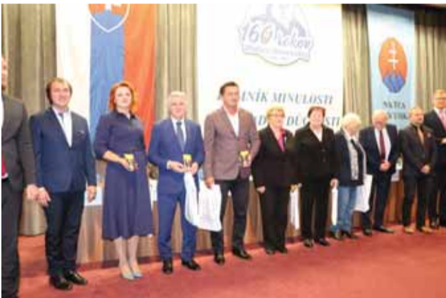
Zaslúžilým matičiarom odovzdala Matica slovenská cenu predsedu MS, ceny MS všetkých kategórií a aj mimoriadnu cenu. Táto cena sa udeľuje osobnostiam, ktoré majú mimoriadnu zásluhu na rozvoji matičného a národného hnutia.