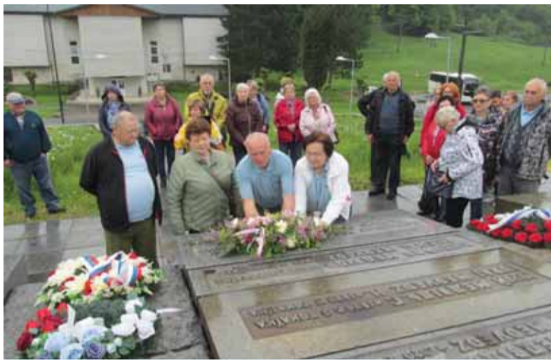
Pamätník tokajickej tragédie je v správe Vojského historického ústavu.

Túto tragédiu pripomína pamätník obetiam – súsošie Návrat do vypálenej obce od akademického sochára Fraňa Gibalu. Vyjadruje dramatický výjav, keď ženy a matky našli svojich zavraždených mŕtvych mužov a synov. Ďalšími pamätníkmi je miesto tragédie za obcou a múzeum. Tragické udalosti si pripomínajú turisti, ktorí do obce