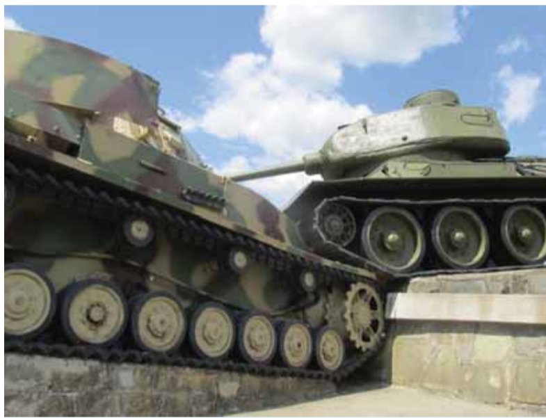
Pamätník so sovietskym tankom T-34, ktorý zdoláva nemecký tank, pozýva do Údolia smrti.