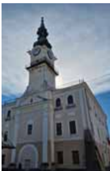
Radnica je neprehliadnuteľnou dominantou centra mesta.