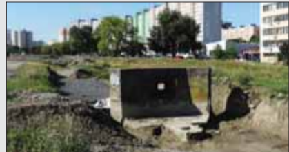
Protitanková delostrelecká stena je priamo na trase novej elektrickej trate v Petržalke. Pamiatkari rozhodujú, ako a kde ju zachovať... Lenže „elektrická“ nemecká iba preto.

poznačené zásahom, lebo na kovovom plášti strielne bola zreteľná stopa po zásahu granátom. Keby ten delostrelecký palpost, ktorý teraz stojí priamo v ceste budúcej elektrickej trate, vedel hovoriť, prezradil by možno, ako sa „trofejné“ pancierové okienko ešte z Molotovovej línie ocitlo zabudované v nemeckej obrane. Na podobnej striel'ni v neďalekých Kopčanoch sú