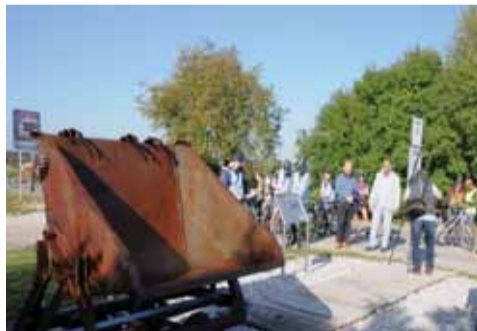
Pochôdzka bratislavských matičiarov po významných historických miestach v okolí hlavného mesta.

túto burcujúcu pieseň s cieľom prebúdať národné povedomie. V priestore tohto pohostinstva po informačnom príhovore dostali účastníci pochodu vlajočky Matice slovenskej a stužku trikolóry s belasou stužkou Matice i s pečiatkou Národného pochodu Slovenskom. Na posilnenie do ďalšej etapy pochodu ponúkli jeho organizátori účastníkom chlieb s masťou a cibulku, ako tu bolo kedysi zvykom, a mohli sa zapísať do kroniky MO MS. Putovanie študentov a účastníkov pochodu pokračovalo