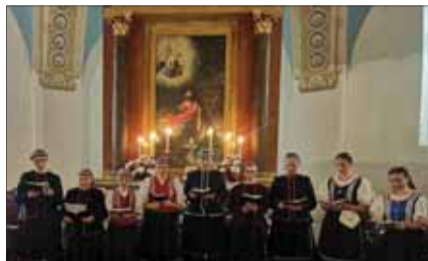
Podujatie v Klenovci malo umeleckú i vzdelávaciu úroveň.