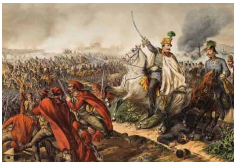
Dobová kresba Jelačičovho víťazstva pri Schwechate

Ráno 30. októbra sa rozhorela bitka masívnou kanonádou. Pravému krídlu útočiacich Maďarov sa podarilo obsadiť dedinu Mannswörth. Görgeiho brigáda v strede útočnej línie však čakala na posily a ľavé krídlo postupovalo pomaly. Rakúšania sa stihli sformovať, a keď ich skúsené voje zaútočili na chabo vyzbrojených maďarských dobrovoľníkov, tí sa dali na útek. Móga dal rozkaz na všeobecný ústup. Keď sa po páde z koňa vážne zranil, velenie prevzal Görgei. Porážke však už nemal šancu zabrániť. Do boja sa konečne zapojilo aj ľavé krídlo, ale už len mohlo kryť ústup, aby boli straty čo najmenšie. V bitke pri Schwechate padlo na maďarskej strane okolo päťsto mužov (odhady hovoria o dvesto až osemsto vojakoch), na rakúskej strane bolo údajne iba dvadsaťdva mŕtvych a asi tucet nezvestných. Na druhý deň sa vzdala aj revolučná Viedeň.