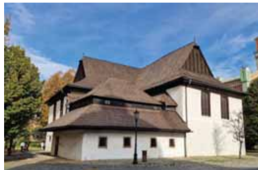
Najcennejšou pamiatkou Kežmarku je artikulárny kostol.

zmocniť sa hradu útokom. V roku 1655 cisár Ferdinand III. potvrdil Kežmarku privilégia a mesto sa opäť stalo slobodným kráľovským. A v roku 1720 kúpilo aj hrad. O hospodárskom raste svedčí fakt, že v meste pôsobilo vyše dvestošesťdesiat remeselníckych dielní! Od roka 1996 je mesto opäť sídlom okresu.