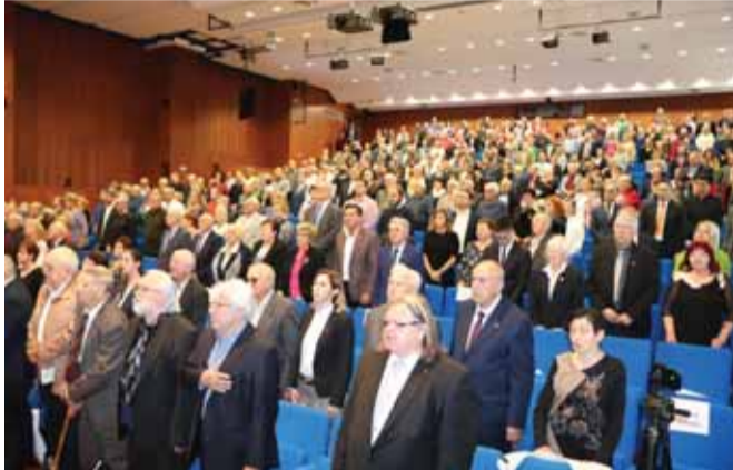
Po štyroch rokoch sa zišlo 383 matičných delegátov a 50 hostí z celého Slovenska na Sneme Matice slovenskej v priestoroch Auly Magny Jesseniovej lekárskej fakulty UK v Martine.