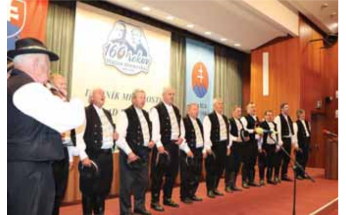
Mužská spevácka skupina Veselí chlapi z Veľkých Kozmálovíc v úvode snemu zaspievala slovenskú štátnu hymnu. V ich podaní sa snem aj zavŕšil matičnou hymnou Kto za pravdu horí.