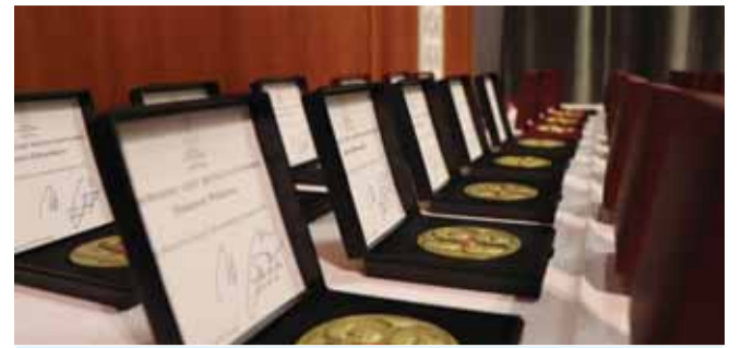
V rámci slávnostnej časti snemu udelila Matica slovenská niekoľko vysokých ocenení mnohým významným matičným osobnostiam za ich prínos v prospech Matice slovenskej.

Snem Matice slovenskej vytvoril priestor, aby sa delegáti z celého Slovenska v priateľskej matičnej atmosfére spoločne zišli a demokraticky, konštruktívne a najmä vecne zhodnotili činnosť Matice slovenskej a schválili úpravy a zmeny nielen v Programe Matice slovenskej, ale aj v stanovách Matice slovenskej na základe delegovania vymedzených právomocí uznesením Valného zhromaždenia MS. Matičné hnutie znova dokázalo, že je jednotné a pripravené brániť matičné záujmy a ideály. Obzrime sa teda spoločne za najzaujímavejšími chvíľami snemu formou fotogalérie, ktoré približujú priateľskú atmosféru snemovania.