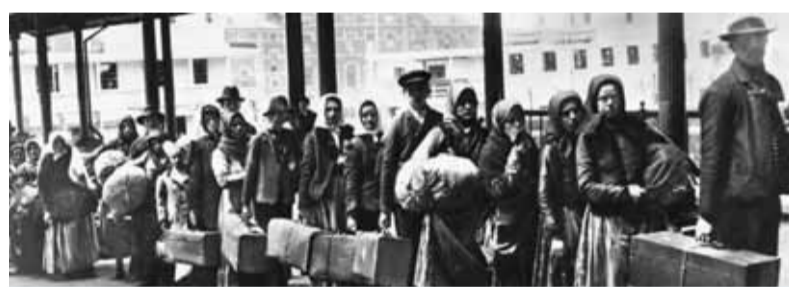
Prvé chvíle slovenských prisťahovalcov na americkej pôde. Prišli sice chudobní, ale plní odhodlania a sil začať nový lepší život.

Vráťme sa trochu späť, konkrétne do roka 1993 a tzv. plienkového obdobia samostatného Slovenska. Vtedy vznikli niektoré cestovné kance-