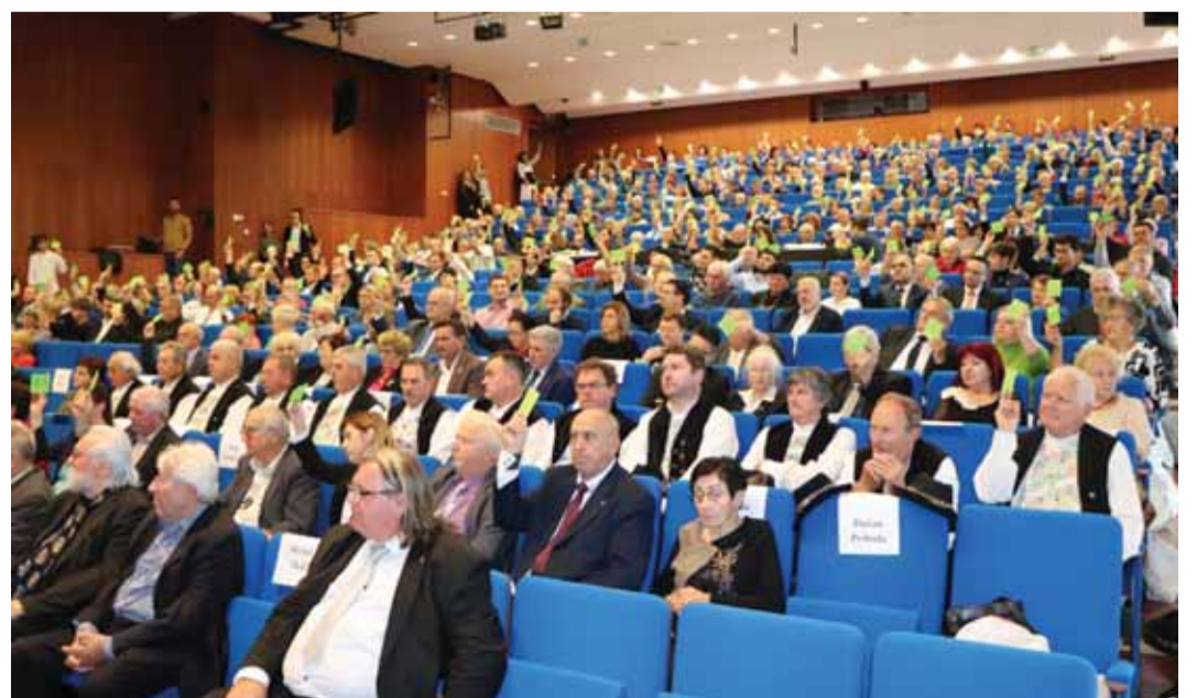
Hlavné matičné dokumenty, ako sú stanovky a program, boli po demokratickej a plodnej diskusii delegátov jednoznačne podporené a schválené.