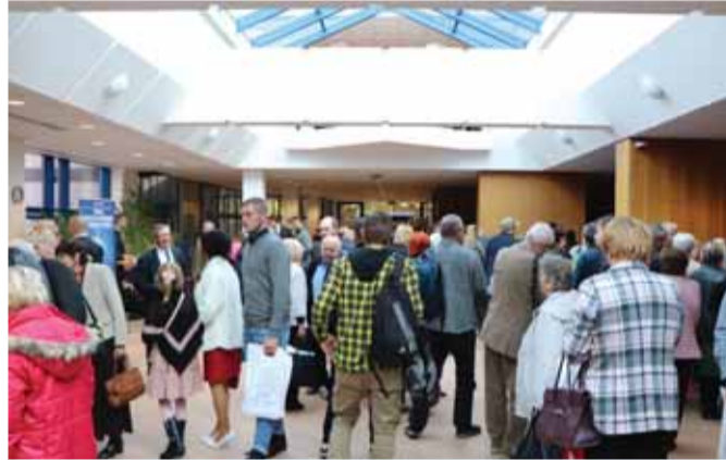
Dôvodom zvolania snemu bola novelizácia stanov MS a schválenie Programu MS na nasledujúce obdobie. Množstvo matičiarov z celého Slovenska sa zišlo v priateľskej a dobrej nálahe.