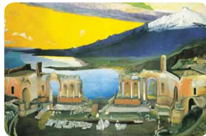
Z maliarovej tvorby (olej na plátne; v zbierkach Csontváryho múzea v Pécsi)

Tvorcov originálny výtvarný štýl zvyknú experti nazývať aj mystickým realizmom. Zobrazenie historických alebo biblických motívov a tém situoval Csontváry do atraktívneho prírodného či architektonického prostredia. Evidujeme tiež vyjadrenia niektorých znalcov, ktorí sabinovského rodáka označujú za priekopníka expresionizmu či post expresionizmu. Medzi najznámejšie maliarove opusy patria Jazdci na morskom pobreží , Stretnutie milencov , Osamelý céder , Rímsky most v Mostare , Vodopád v Jajce , Baalbek , Máriin prameň v Nazarete , Pút k libanonským cédom , Grécky amfiteáter v Taormine , Attilou kameň ... Výtvarníkov diela tvoria súčasť zbierkových fondov Národnej galérie v Budapešti, Csontváryho múzea v Pécsi, skromnejšie tiež Slovenskej národnej galérie v Bratislave a inde.