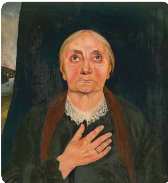
Modliaca sa starenka (olej na plátne, 1900; v zbierkach Slovenskej národnej galérie)

ných destináciách, v rámci ktorých hľadal námety a inšpiračné zdroje (Taliansko, Francúzsko, Španielsko, Dalmácia, Bosna, krajiny severnej Afriky a Blízkeho východu...). Okrajovo v jeho dielach rezonujú aj slovenské témy (Vysoké Tatry, Banská Štiavnica). Prvú individuálnu výstavu mal Csontváry v Paríži (1907), neskôr, ale bez väčšieho ohlasu, prezentoval svoje artefakty hlavne v západoeurópskych galériách (1908 – 1910). Doma, myslíme tým Rakúsko-Uhorsko, nenašiel ani len zlomok porozumenia pre osobitý expresionistický štýl a vizionárske myšlienky vegetariánstva, abstinencie či pacifizmu. Istotne dôležitú rolu zohral aj umelcov rapídne sa zhoršujúci zdravotný stav (trpel schizofróniou), čo malo za následok, že v poslednej etape života stvárňoval výhradne len svoje bolestné, mučivé vízie.