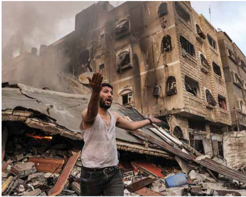
Útok izraelskej armády na pásmo Gazy je zničujúci. Zomierajú tisíce nevinných detí. Zahraniční pozorovatelia to považujú za zločiny. Nevedno, ako by reagoval svet, ak by takto postupovala ruská armáda na Ukrajine.

Aj keď bol útok Hamasu prekvapujúci, išlo o dlhšie pripravovanú akciu, ktorá má možno aj historické korene. Uvádza sa, že sa tak mohlo „pripomenúť“ päťdesiate výročie izraelsko-arabskej vojny, ktorá sa začala 6. októbra 1973. Egypťsko-sýrsky útok bol tiež prekvapujúci a oproti predchádzajúcim arabským akciám dobre naplánovaný. Útok priviedol po začiatočných neúspechoch Izrael na hranicu katastrofy. Po necelých troch týždňoch bojov však dosiahol vojenské víťazstvo. Neraz sa dodáva, že následky tejto vojny, najmä neskôr, Izrael medzinárodne oslabili. Okrem