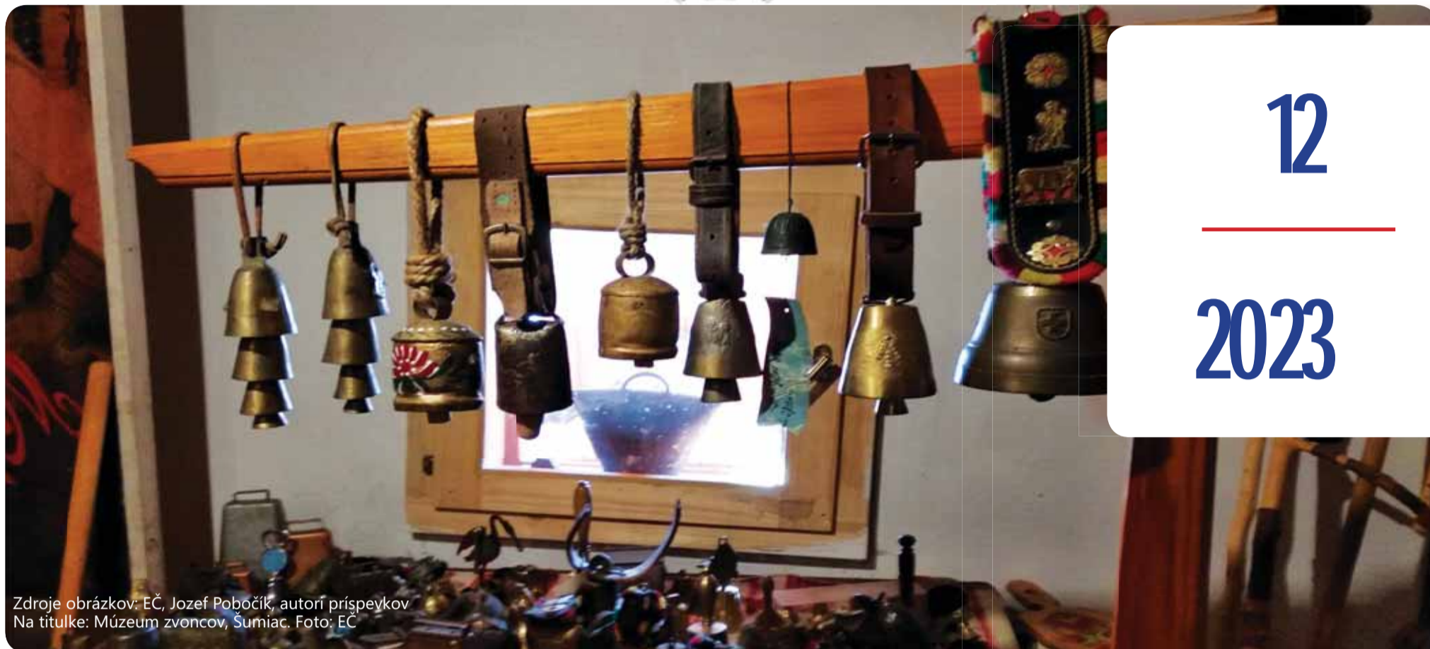
Na titulke: Múzeum zvoncov, Šumiac.