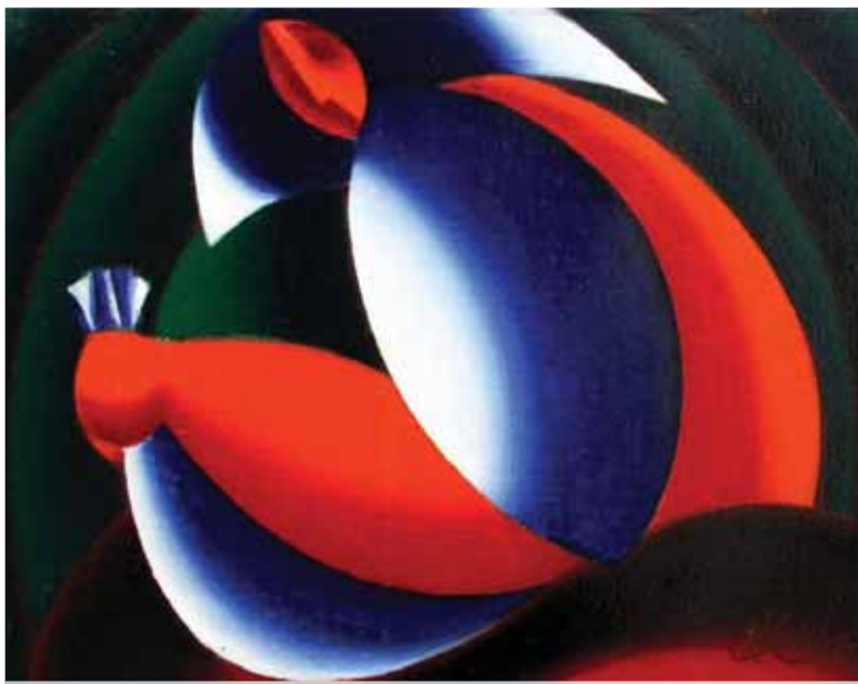
Prakticky všetkých členov legendárnej skupiny Galandovcov charakterizoval svojím originalitami. Azda najviac vybočoval z noriem a dogiem socialistického realizmu vo výtvarnej tvorbe Milan LALUHA.

Miloša Bazovského mal veľmi rád. Netajil, že mu jeho tvorba bola najbližšia zo všetkých kolegov i dávno zomretých predchodcov. Osobne sa dobre poznali, navštevovali sa a navzájom si radi prezerali práce. Mala som pocit, že ich spája aj obľuba teplej jasnej oranžovej, žltej a červenej farby. Dodávala ich obrazom jas a cítila som, že aj optimizmus a akési nadšenie, ktoré ma k nim tak silno priťahovalo.