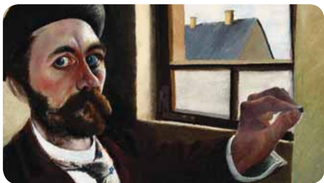
Autoportrét (olej na plátne, rok neznámy; v zbierkach Csontváryho múzea v Pécsi)

Na tento svet prišiel ako Michal Teodor Kostka pred 170 rokmi, 5. júla 1853, v Sabinove (Šarišská župa). Rečové prostredie, kde sa v detstve pohyboval, bolo zväčša slovenské. Otec ho preto ako chlapca viackrát poslal k vzdialeným príbuzným na Dolnú zem, aby si dôkladne osvojil maďarský jazyk. Vari oprávnene možno konštatovať, že aj umelecké meno Csontváry, ktoré používal od roku 1900, odkazuje na autorove slovenské, respektíve slovan-ské priezvisko (csont znamená v maďarčine kosť či kôstka, vár je hrad). Nemožno totiž úplne vylúčiť, že Kostkovi zo Sabinova boli potomkami rodu Kostkú z Postupic v Čechách, ktorí okolo roku 1468 vstúpili do služieb uhorského kráľa Mateja Korvína.