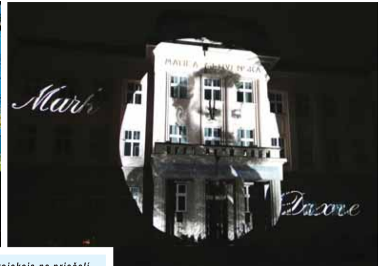
Originálna videoprojekcia na priečelí druhej budovy Matice slovenskej