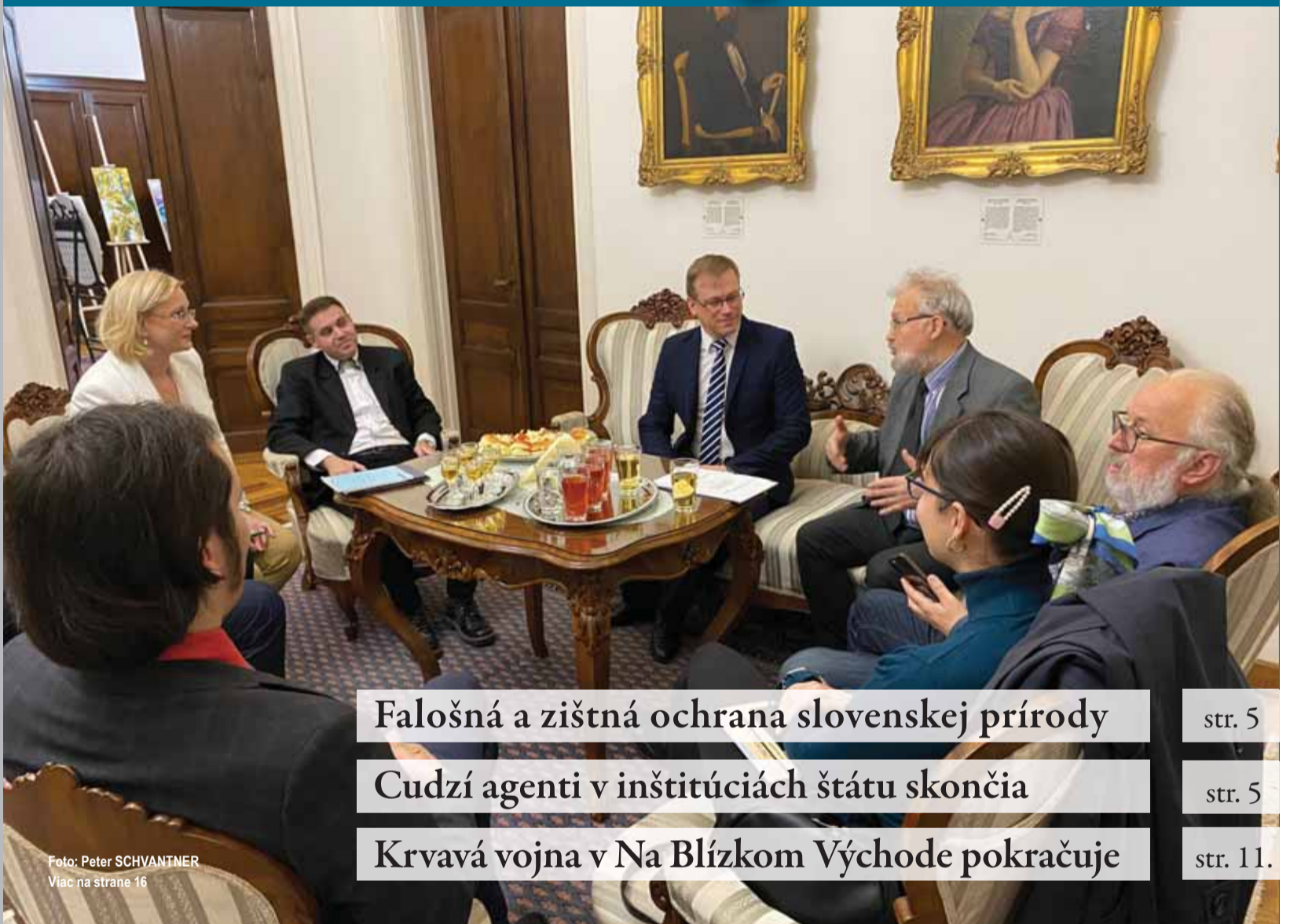
Viac na strane 16

Falošná a zisťná ochrana slovenskej prírody