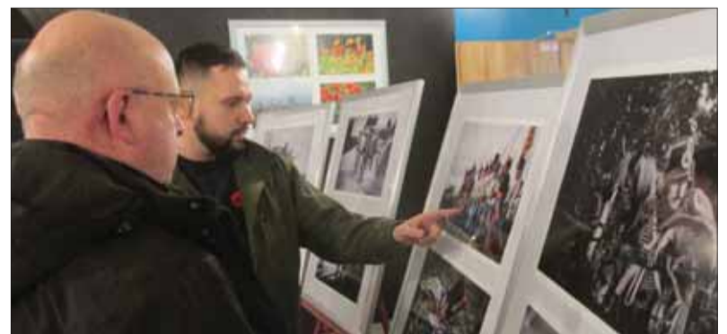
Výstavu o husároch si so záujmom pozreli aj členovia Klubu vojenskej histórie Hodošík so Stakčina.