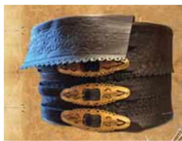
Replika legendárneho opasku Juraja Jánošíka

mových blokov takmer 1 650 účinkujúcich zo Slovenska, z Česka, Lotyšska, Maďarska, Poľska a Rumunska. Na piatich miestach obce sa konala záverečná prezentácia úspešného projektu „hrájúci“ autobusových zastávok