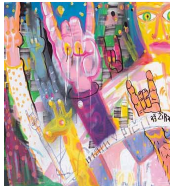
Žirafa (akryl na plátne, 2008 – 2009; v zbierkach Slovenskej národnej galérie)