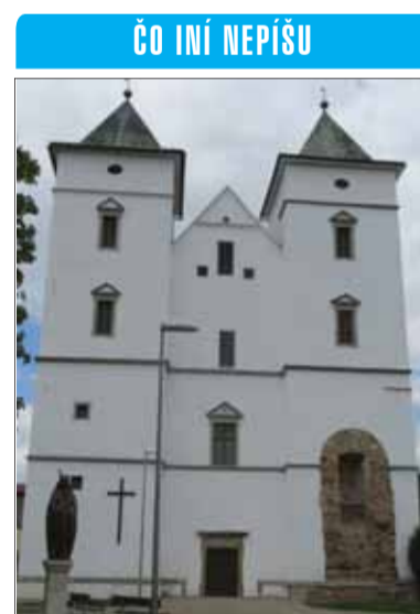
ČO INÍ NEPIŠU Dve svetové vojny zmenili Kostol sv. Žofie v Zborove na ruiny. V súčasnosti vstal doslova z popola ako bájny vták fénix.

Najväčšie rany osudu dostal kostol v 20. storočí. Najskôr v roku 1914 vyhorel a zostal bez strechy. Počas prudkých bojov prvej svetovej vojny v rokoch 1914 – 1915, ktoré boli v šiestich okresoch severovýchodného Slovenska jedinými na území našej budúcej republiky a zasiahli aj Zborov, boli rozstrieľané veže kostola, strecha a koruny múrov. Na konci vojny, v roku 1918, takto oslabená stavba podľahla prudkým dažďom, po ktorých