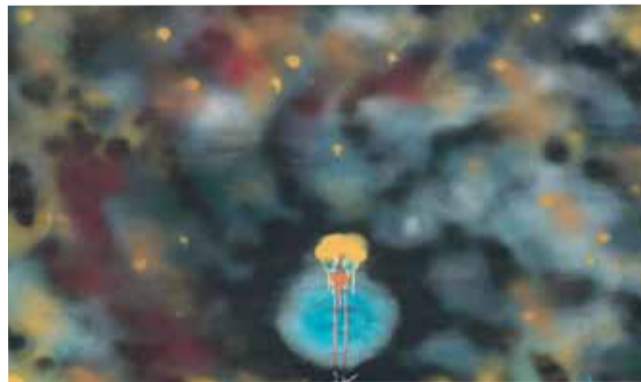
Malý princ (kresba, akrylový sprej, 2008; v zbierkach Slovenskej národnej galérie)