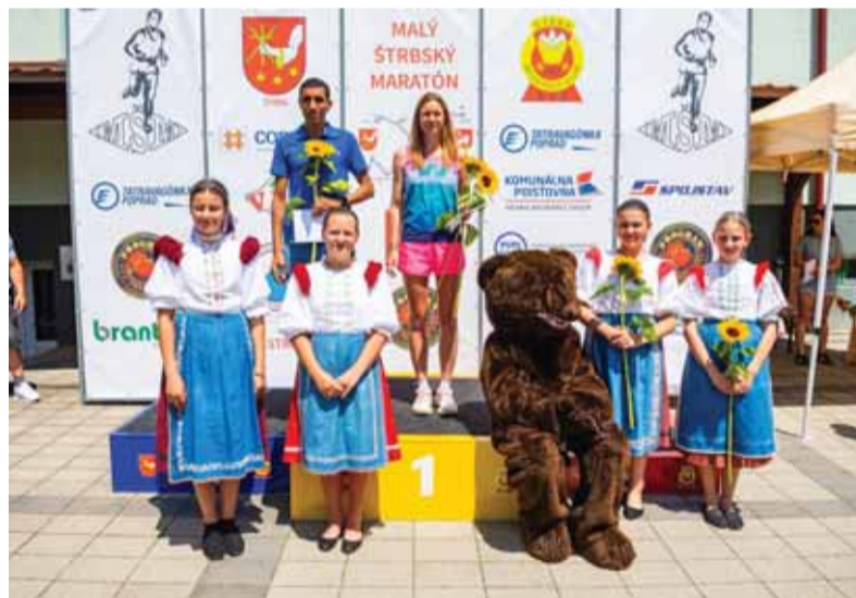
Víťazi tohtoročného maratónu v Štrbe

vidieť obetavú prácu funkcionárov a dobrovoľníkov od tínedžerského veku po sivovlasých seniorov. Ani tí najnáročnejší pretekári, ktorí víkend čo víkend zápolia na renovovaných bežeckých podujatiach na Slovensku i v cudzine, nemajú čo organizátorom vyčítať.