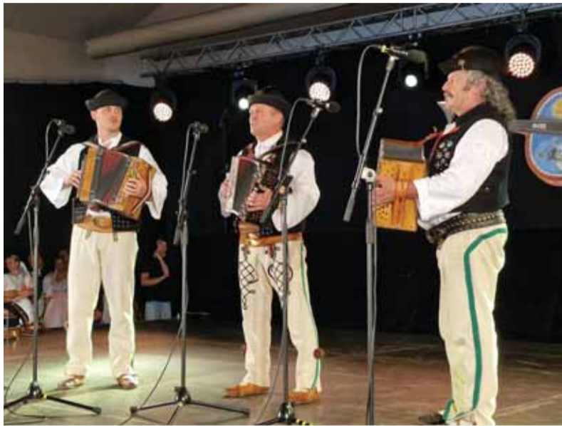
Jánošíkove dni každoročne ponúkajú bohaté zážitky, poznanie a radosť z folklórneho bohatstva.

Jedným z epicentier diania bolo RIC Terchovec, kde sa v pestrej plejáde programov vystriedala početná „množina“ účinkujúcich. S dominanciou folklóru v pestrých podobách, aké len folklór ponúka. Bolo toho opäť v Terchovej neúrekom, kniha by sa dala napísať... Dominantou bol amfiteáter Nad Bôrami a čerešničkou na torte Terchovská muzika. Ako by aj nie, veď pred desiatimi rokmi ju zapísali do UNESCO! Slovo má Peter Cabada, šéfdramaturg Jánošíkových dní: „Festival bol v znamení