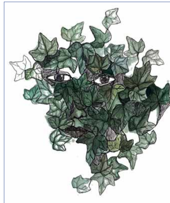
Ilustrácia k vlastnej tvorbe (A Kučkovská)

Ako je aj v mojich básňach citeľné, žijem uprostred dvoch svetov, neustále na vázkach, ktorý je pre mňa ten správny. Nakoniec ale možno tento medzipriestor je práve teraz to, čo si moja kreativita žiada, aby som sa v svojej tvorbe ešte viac spoznala.