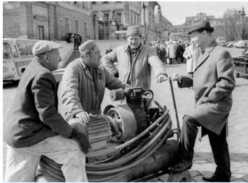
Oteplenie spoločenskej atmosféry, ktoré prichádzalo s tzv. Pražskou jarou, prišlo aj takéto predtým nevidané stretnutie a rozhovory.

presadzoval, že treba skončiť s tézou o triednom boji, teda aj boji proti triednym nepriateľom, treba postaviť rozvoj spoločnosti na novom všeludovom princípe. Teda išlo o nové spoločenské usporiadanie. Bol to na tie časy unikátny program aj v európskych súvislostiach. Išlo o nový model usporiadania spoločnosti, utváranie priestoru pre každ-