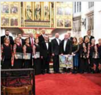
Lipovľanský súbor chorvátskych matičiárov Lira počas vystúpenia