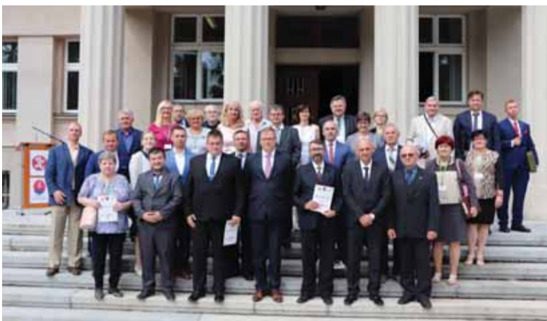
Na kongrese slovanských matíc sa zúčastnili zástupcovia takmer všetkých slovanských národov.