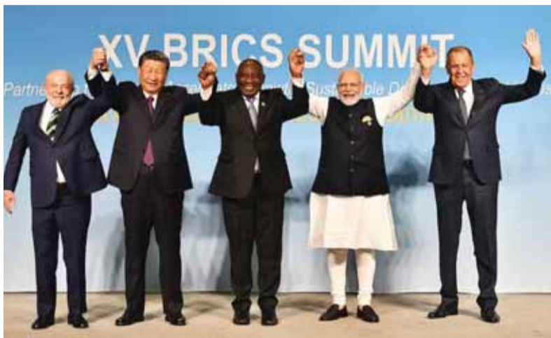
Zástupcovia mimo transatlantických silných ekonomík sveta vytvárajú novú platformu spolupráce BRICS.

O profil budúcej politiky, ako aj podiel štátov na jej dlhodobom formovaní sa hlásia i malé štáty. Pozoruhodný hlas prišiel z lotyšskej Rigy. Odstupujúci predseda vlády Krišjanis Karinš vyzval Európsku úniu, teda Brusel, aby umožnila členským štátom, ktoré v minulosti neboli koloniálnymi mocnosťami a nenesú bremeno historickej záťaže, aby nadväzovali užšie diplomatické a iné vzťahy so štátmi Afriky, Ázie a Južnej Ameriky.