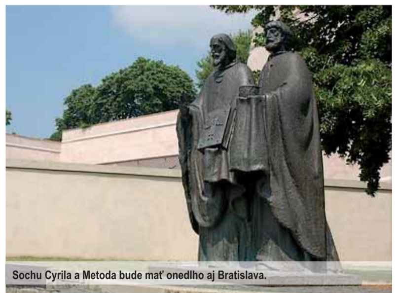
Sochu Cyrila a Metoda bude mať onedlho aj Bratislava.