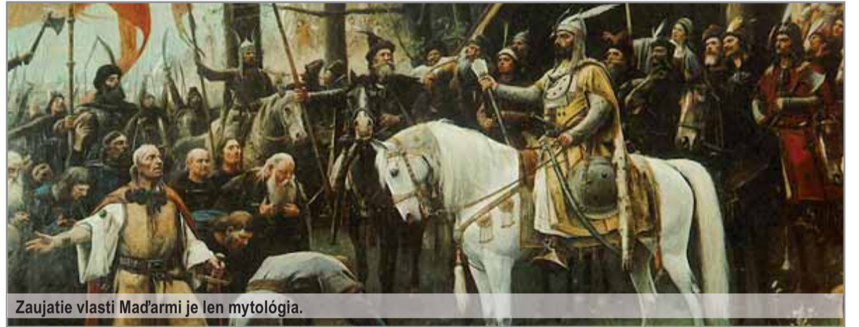
Zaujatie vlastní Maďarmi je len mytológia.

Kronsteiner si dovolil tvrdiť, že ide o slovenské slovo Ostravica (ostrý, špicatý kopec), ktoré sa len jazykovým vývinom transformovalo na Oesterreich. V návale vlasteneckého nadšenia ho však všetci ostatní rakúski vedci ukričali. A mne, použíjúc ľudovú etymológiu, to pripadá ako Ostarkey, ale nikomu to nepovedzte... Teda určite mnohých zaujíma, kde by Slováci mali hľadať svoje miléniom alebo ešte starší dátum prvej zmienky