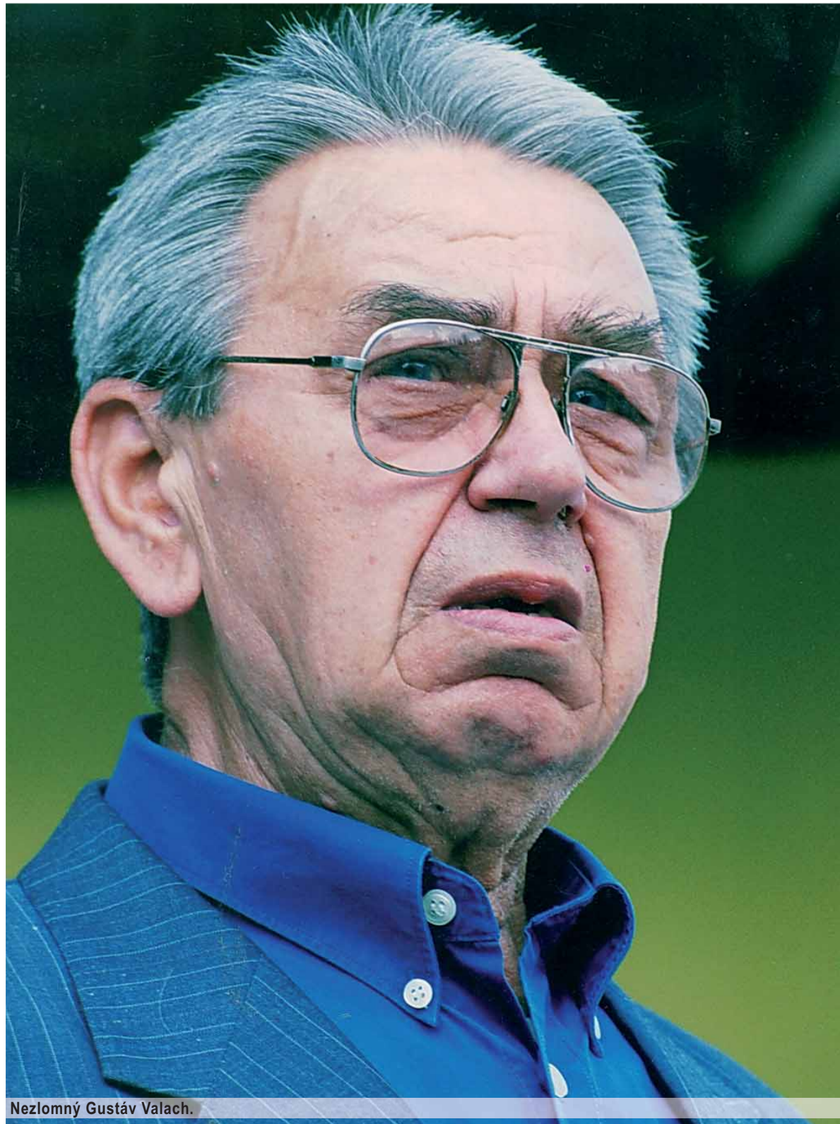
Nezlomný Gustáv Valach.

Osobitou a samostatnou kapitolou bol umelcov nepodkúpný a nezlomný charakter. Medzi výtvarníkmi, vedcami, lekármi, duchovnými bolo v čase minulého režimu veľa statočných, no medzi hercami sa taký našiel iba jeden jediný. Len Gustáv Valach si stál v slove a zostal pevný vo viere, aj keď sa mu rúcal svet, ktorý miloval. Keď jeho kolegovia teatrálnu bedákali, že musia ustúpiť nátlaku vedenia, poslúchnuť vrchnosť, hrať, čo im pridelia, lebo keby nehrali, neboli by hercami, Valach neustúpil. Hraniče, ktoré si stanovil, nikdy neprekročil.