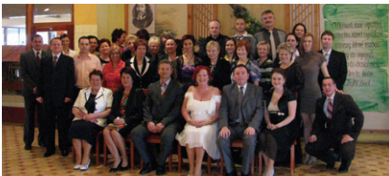
Učiteľský zbor základnej školy v Jasove.