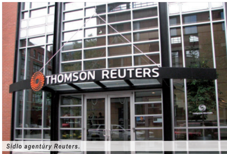
Sídlo agentúry Reuters.

Po udalostiach na Cypre zrazu zázračne rýchlo agentúra Reuters zverejnila výsledky vlastného prieskumu medzi „renomovanými analytikmi“ v jednotlivých krajinách Eurozóny o tom, ktoré ďalšie krajiny nakazí cyperský syndróm. Slovensko je – a tu sa javí ako odôvodnené tvrdiť – nie náhodou medzi nimi. Pretože sme jedna z mála krajín Únie, v ktorej je hospodársky rast plusový, aj keď nízky. Podľa všetkého, agentúrnymi kanálmi Reuters sa šíri informácia, že od medzinárodnej finančnej pomoci môžeme byť závislí spolu so Slovinskom či s Luxemburskom! Padneme aj my na samotné dno? Pýtajú sa už aj