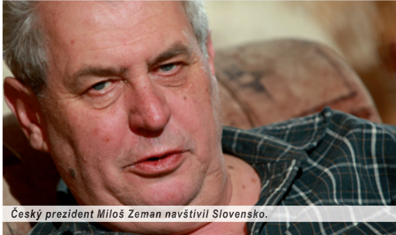
Český prezident Miloš Zeman navštívil Slovensko.

Ostatná oficiálna, priateľská či zdvorilostná návšteva českého prezidenta Miloša Zemana na Slovensku 4. – 5. apríla 2013, najmä jeho mediálne vystúpenie deň pred príchodom k nám neponechali – aspoň dúfam – celý slovenský národ dojímavou prívětivým. Milošovi Zemanovi niekedy až pridýchnuť priznávajú rôzne bonmoty. Široko medializovaný je výrok o tom, aké zaživacie problémy mu spôsobilo popradské pivo. Ešte citlivejší je postreh, ako ťažko prijímal pokojné rozdelenie bývalej ČSFR pred takmer dvadsiatimi rokmi.