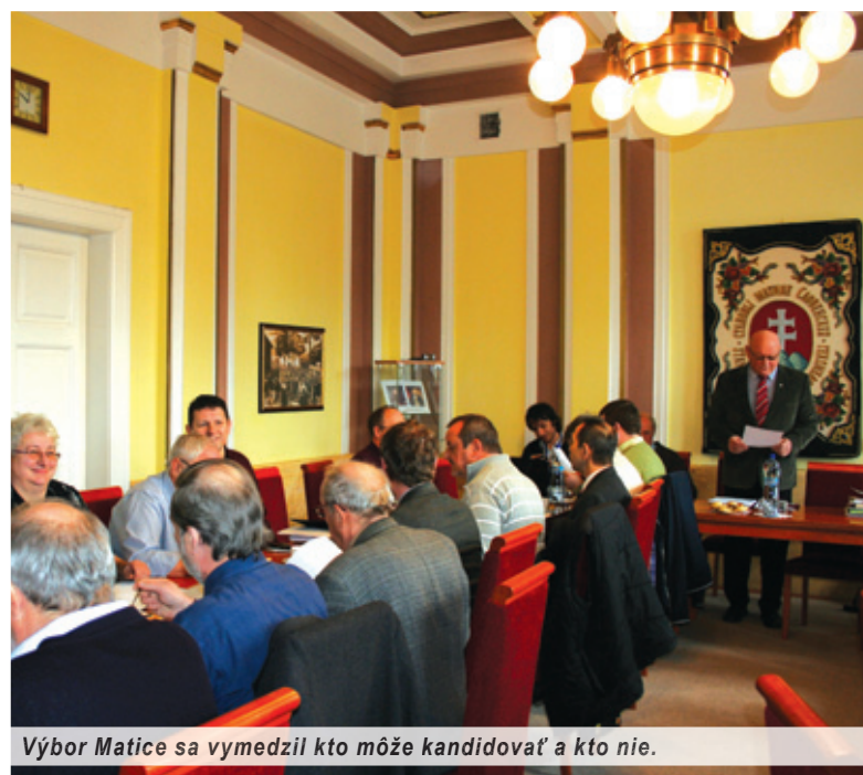
Výbor Matice sa vymedzil kto môže kandidovať a kto nie.