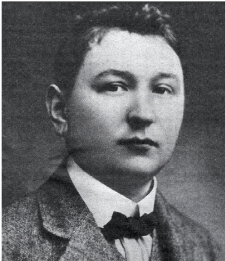
Ako študent sa zapísal v Kronike slávneho Turčianskeho kasína.