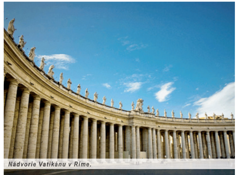
Nádvorie Vatikánu v Ríme.

Zriadenie Slovenského historického ústavu v Ríme so sídlom v Bratislave vchádza do dejín ako typický slovenský prejav. Nejde nám o kvalitu, ale o počet. Alebo o trafiku? Slovenský historický ústav v Ríme totiž od roku 2005 funguje na Trnavskej univerzite. Rydlovi neušlo, že po ÚPN je bratislavský ústav už druhá historická inštitúcia, ktorá sa dostáva pod vplyv KDH, a pýta sa, prečo sa o to tak kresťanskí demokrati usilujú?