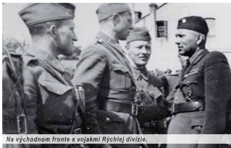
Na východnom fronte s vojakmi Rýchlej divízie.

Zvyšok života dožil bývalý minister a generál F. Čatloš v ústraní s biľagom kolaboranta. So spätnou platnosťou k 31. 12. 1945 bol prepustený z armády. Aby vôbec vyžil, musel brať každé manuálne či úradnícke zamestnanie, ktoré sa mu naskytlo. Ani v jednom z nich dlho nevydržal, keďže bývalého ministra „fašistického“ štátu sa báli dlhšie zamestnať. Penziu mu vymerali prakticky na úrovni existenčného minima a ešte aj v dôchodcovskom veku (1954 – 1968) bol pod dozorom ŠtB. Jeho jediným potešením bolo písanie vlastných, nesmierne obsiahlych pamätí. Umrel 16. októbra 1972 v Martine v predvečer svojich sedemdesiatich siedmich narodenín. V roku 1997 boli jeho ostatky – zásluhou rodiny, no za nezájmu štátnych a vojenských orgánov – uložené na Národný cintorín.