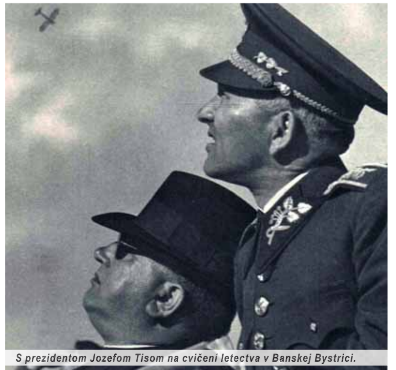
S prezidentom Jozefom Tisom na cvičení letectva v Banskej Bystrici.

ho ministra národnej obrany vo vláde J. Tisu. Toto kreslo bolo najhorúcejšie. Jeho prvým krokom malo byť vypracovanie plánu na obranu Slovenska pred Maďarskom a Poľskom, teda susedmi, ktorí sa netajili ambíciou na ďalšie jeho územné okyptenie. Prvý vojenský test absolvoval Čatloš