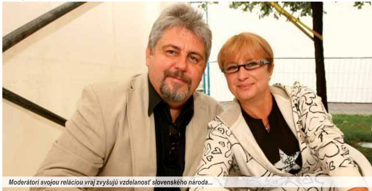
Moderátori svojom reláciou vraj zvyšujú vzdelanosť slovenského národa...

Nová metla dobre metie, hovorí staré slovenské príslovie. Azda tak si povedali aj diváci verejnoprávnej televízie, keď sa zmenilo vedenie RTVS. Je zaujímavým zvykom, že sa počká istý čas, ako nové vedenie splní to, čo pred nástupom ku kormidlu RTVS sľubovalo. Na druhej strane je povinnosťou publicistov upozorňovať na potknutia a v niektorých prípadoch aj na potemkinovské dedinky, ktoré sa nenápadne objavujú vo vysielaní. Slovenské národné noviny pravidelne prinášajú informácie o tom, ako sa dajú zdeformovať termíny „výchova k vlastenectvu“ či „vzdelávanie divákov“. Na konci podobných aktivít totiž občas nejde o osvetu, ale o čudné narábanie s verejnou peňaženkou.