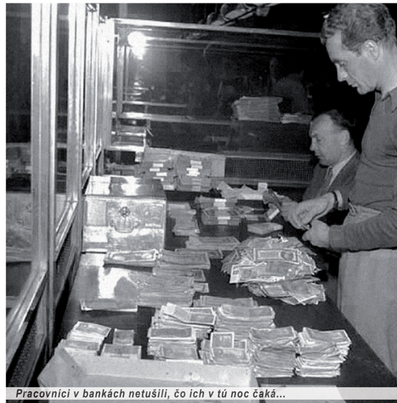
Pracovníci v bankách netušili, čo ich v tú noc čaká...

Prekonala ju až lúpež storočia o štyridsať rokov – kupónová privatizácia a pridelovanie vlakových lodí českého a slovenského priemyslu politickým kamarátom, ktorí v pravú chvíľu predali národné bohatstvo dravcom zo zahraničia. To však je už iná história.