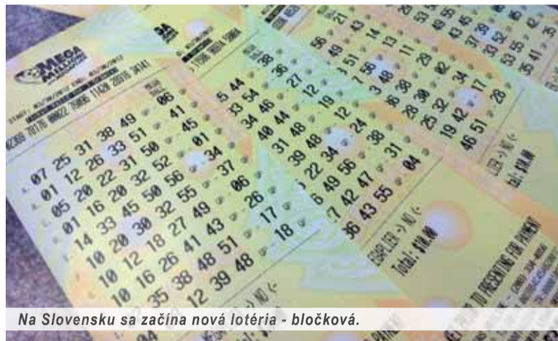
Na Slovensku sa začína nová lotéria - bločková.

Kedysi bola najobľúbenejším športom Slovákov športka. Zdá sa, že od septembra si zamilujeme „bločkovanie“. Doslova celonárodná lotéria, do ktorej si denne kupuje zreb každý z nás, je pred septembrovým spustením. Štát dúfa, že budeme chcieť vyhrať, a on tak získa dane zo sivej a z čiernej ekonomiky do svojej pokladnice. Na bločkovej lotérii nie je nič zlé. Už od čias starého Ríma je jasné, že občanovi treba dať dve veci – chlieb a hry.