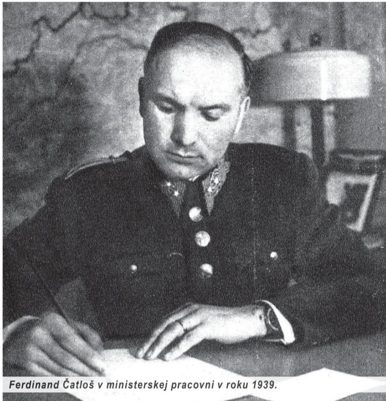
Ferdinand Čatloš v ministerskej pracovni v roku 1939.

Ferdinand Čatloš bol prvým mužom, ktorého do generálskej hodnosti vymenovala už štátna moc Slovenského štátu. Hoci posledný deň existencie ČSR bol len podplukovníkom, v apríli 1939 ho slovenská vláda povýšila do hodnosti divízieho generála. Patrí nielen medzi najznámejších generálov, ale aj medzi najznámejších a súčasne najmocnejších politikov prvej SR; v roku 1944 velil takmer stotisícovej, plne boj schopnej armáde a vypestoval si aj obrovský neformálny rešpekt. Bol jediný evanjelik a jediný neľudák vo vláde. V rokoch 1938 – 1944 prekonal komplikovaný osobný vývoj od radikálneho ľudáka až k odbojovej platforme, no ani v dramatickom období záveru vojny neopustil ideu slovenskej štátnosti.