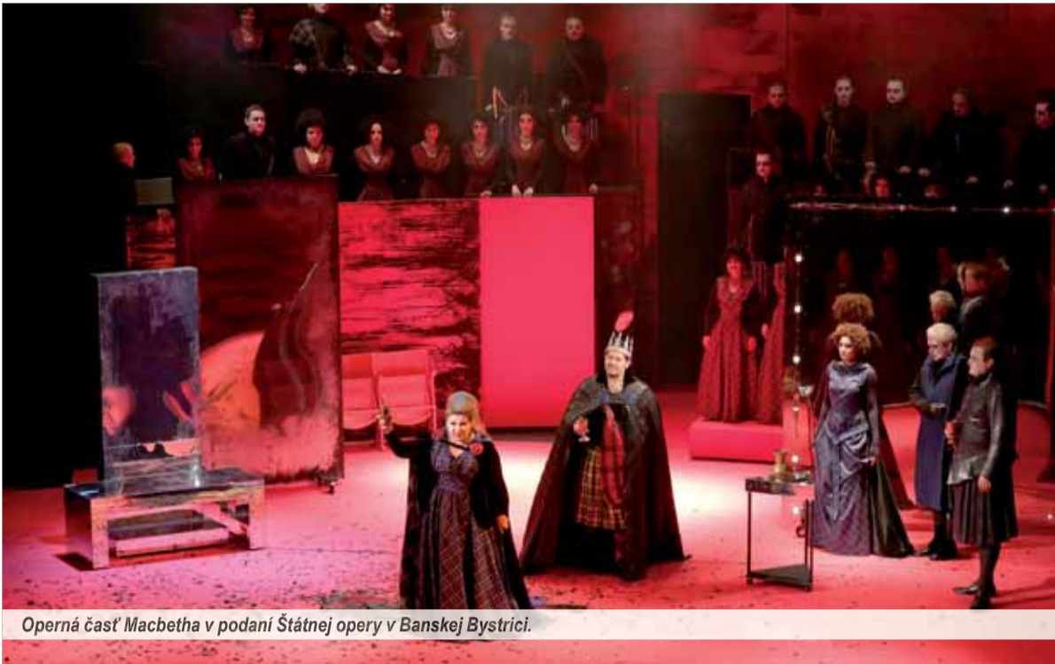
Operná časť Macbetha v podaní Štátnej opery v Banskej Bystrici.