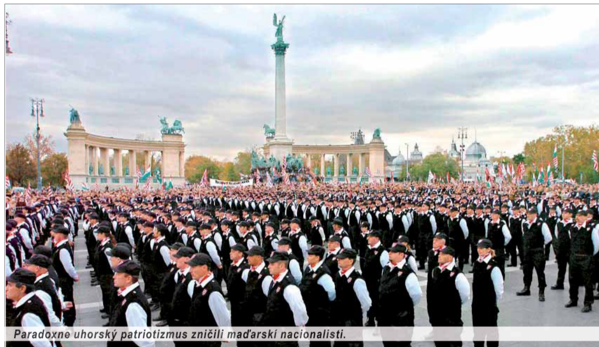
Paradoxne uhorský patriotizmus zničili maďarskí nacionalisti.

V slovenskej verejnosti sa v posledných desaťročiach často stretávame s porovnávaním patriotizmu a nacionalizmu (dokonca aj pápež Ján Pavol II. sa venoval tejto téme práve u nás), pričom tieto dva pojmy chápeme ako prejavy vlastenectva, ale niekedy ich staviame proti sebe. Patriotizmus hodnotíme pozitívne a nacionalizmus negatívne. Bez hlbšej analýzy týchto dvoch javov nemožno zaujať záver, ktorý by nebol zjednodušený a skreslený. Napriek tomu veľa slovenských intelektuálov a politikov sklzáva práve k takémuto nevedeckému nazeraniu a hodnoteniu.