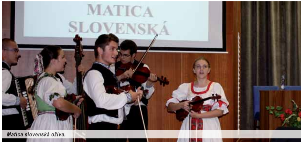
Matica slovenská oživa.

Kto pozeral vo štvrtok 17. októbra vo verejnoprávnej televízii reláciu Pod lampou a mal aké-také IQ, musel byť zaskočený. Ohromený z toho, aká vyprázdnená generácia mladých ľudí vstupuje do života. Prítom si pripomíname 150. výročie cyrilo-metodského jubilea i 150. výročie založenia Matice slovenskej, výsostne kultúrneho a hodnotovo orientovaného odkazu našich predkov. Isteže tento stav spoločnosti má svoju genézu a dokonca je aj ľahko pochopiteľný.