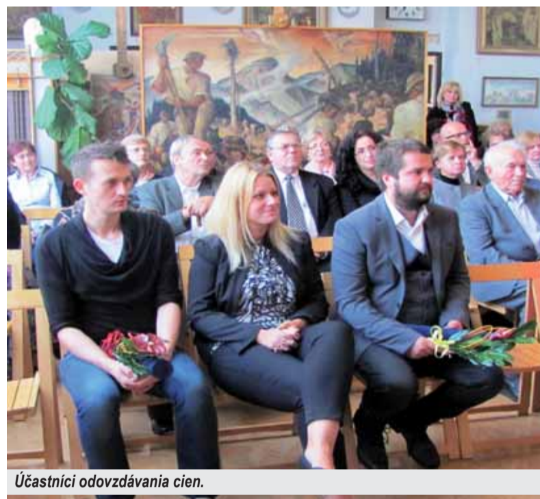
Účastníci odovzdávania cien.