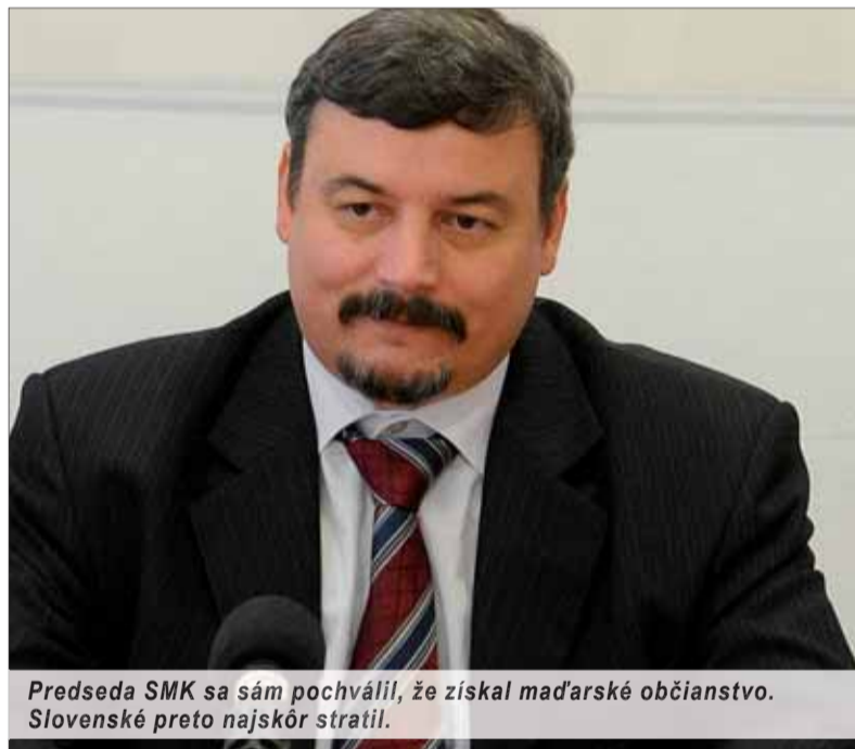
Predseda SMK sa sám pochválil, že získal maďarské občianstvo. Slovenské preto najskôr stratil.

Nezvolili práve toho vášho poslanca do zastupiteľstva? Bude na čele kraja človek, ktorého ste nechceli? Lahká pomoc – obráťte sa na miestne príslušný policajný orgán. Ak bude konať v zmysle ústavy a zákonov z nej odvodených, prijatých ústavným spôsobom a v čase volieb platných – uspejete a voľby budú vyhlásené za zmarené. Podľa nášho trestného zákona sa trestného činu marenia volieb dopúšťa aj ten, kto nesprávne spočíta voličské hlasy.