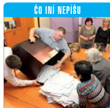
ČO INÍ NEPIŠU