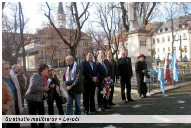
Stretnutie matičiarov v Levoči.