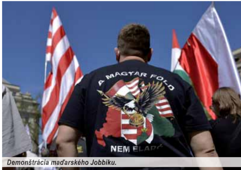
Demonštrácia maďarského Jobbiku.