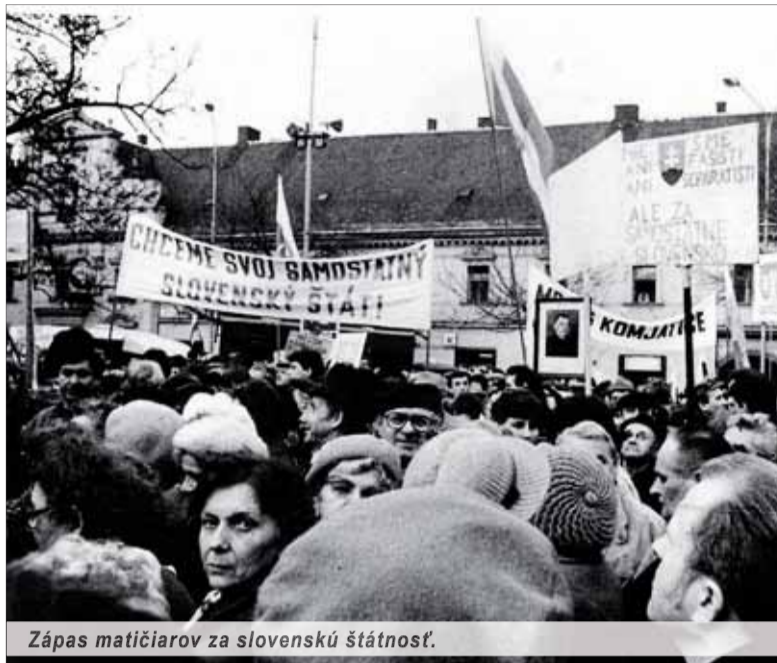
Zápas matičiarov za slovenskú štátnosť.

Matica slovenská, naša najstaršia kultúrna inštitúcia, už hneď od svojho založenia, stála vždy na čele kultúrnych a národných snažení slovenského národa. Vznikla z najvlast-