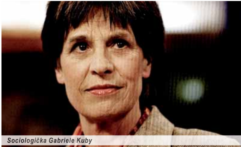
Sociologička Gabriele Kuby

„Mocná lobby sa za pomoci Organizácie Spojených národov