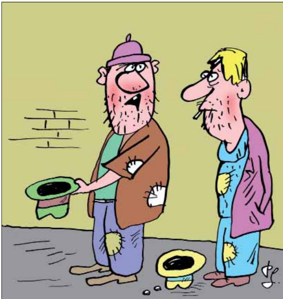
Sme na tom lepšie ako tí, čo žijú z honorárov za poéziu.

Rok 2013 mal v sebe ukrytú pre numerológov a poverčivých ľudí podozrivú trinásťku. Z hľadiska kultúry však bol rokom, v ktorom sa uskutočnila aspoň z finančného hľadiska najväčšia kultúrna akcia v doterajšej histórii samostatného Slovenska. Reálne čísla okolo EHMK 2013 sa ani pozornému internetovému pátračovi nepodarí nájsť, ale išlo určite o vyše šesťdesiat miliónov eur. Väčšina z tejto pre kultúru rozprávkovej sumy pochádzala z európskych štrukturálnych fondov. Zvyšok doplatila vláda Slovenskej republiky prostredníctvom ministerstva kultúry. Aj keď s riadnym časovým sklzom sa obnovilo a vytvorilo niekoľko kultúrnych stánkov, ktoré iste prospejú Košičanom v ďalšom rozvoji kultúrneho života. Ale ruku na srdce! Zachytil niekto z vás v celoslovenských, no najmä vo verejnoprávnych médiách články, reportáže či nedajbože priame prenosy z akcií Európskeho hlavného mesta kultúry?