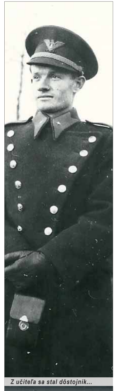
Z učiteľa sa stal dôstojník...