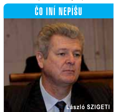
ČO INÍ NEPÍŠU

lil práve vtedy už zjavne dost' narýchlo Zemianskej Oľči dotáciu vo výške stošestnásťtisíc eur na opravu telocvične. Ale – čuďuj sa svet nezvyčajným náhodám – zrazu vstúpila do hry spomínaná