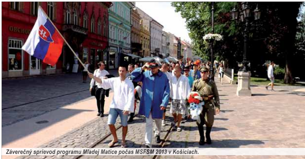
Záverečný sprievod programu Mladej Matice počas MSFSM 2013 v Košiciach.

Nedávno som sa dozvedel, že jeden môj spolužiak dnes pracuje vo výskumnom stredisku CERN medzi najlepšimi vedcami na svete. Je potešujúce, že náš rodák šíri dobré meno Slovenska v zahraničí. Mnohí Slováci sa v cudzine stali významnými aktérmi dejinných udalostí a niektorí aj symbolmi istej epochy. Preto ich môžeme nazvať i našimi ikonickými rodákmi.