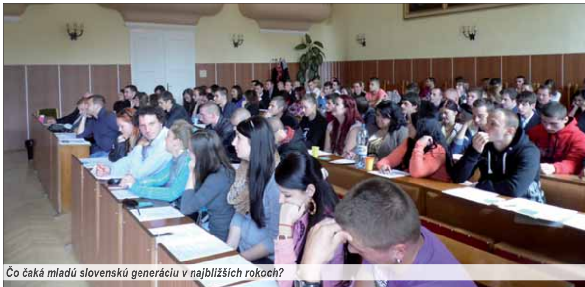
Čo čaká mladú slovenskú generáciu v najbližších rokoch?

V dnešnej slovenskej spoločnosti sa čoraz viac stretávame s pojmom „stratená generácia“. Tento výraz presne reflektuje, v akom stave sa dnes mladí ľudia nachádzajú. Rozčarovanie a znechutenie z celkovej existencie ťažkej životnej situácie, ktoré sú sprievodným javom súčasnosti, sa medzi touto generáciou šíria ako nákaza. Mladí ľudia len skepticky krúčia hlavou a neprestajne narážajú na bezmocnosť túto situáciu zmeniť.