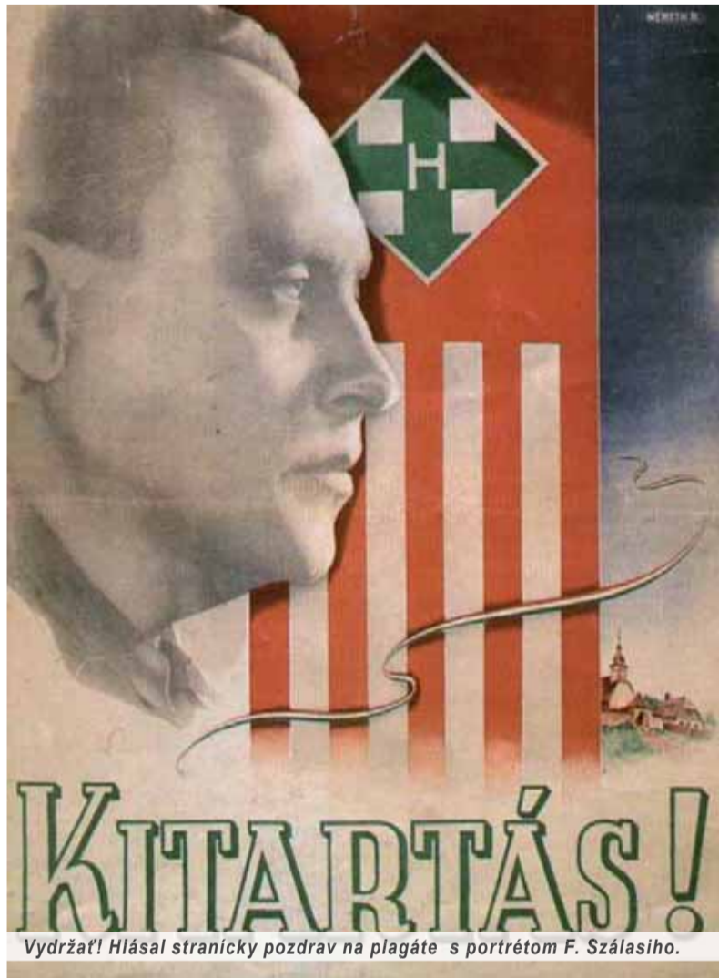
Vydržať! Hlásal stranický pozdrav na plagáte s portrétom F. Szálasiho.

Ríšsky správca Miklós Horthy bol po svojom pokuse vyjednávať so Spojencami o prímerí donútený k abdikácii a 16. 10. 1944 internovaný na zámku Hansee v Bavorsku. Po druhej svetovej vojne žil vo švajčiarskom a v portugalskom exile. Takmer dvadsaťpäťročná éra horthyovskej autoritárnej diktatúry spela k zániku. Nemci v polovici októbra 1944 dosadili za predsedu maďarskej vlády a „vodcu národa“ Ferenc Szálasiho a politickú moc, teraz už výrazne oklieštenú, prebrala po šesťročnom boji a vyčkávaní národno-socialistická Strana šípových krížov (Nyilas-kereszt Párt – NKP). Stala sa jedinou povolenou politickou stranou a zaviedla v Maďarsku národno-socialistickú diktatúru, spojenú s terorom a rasovo a politicky motivovanými vraždami.