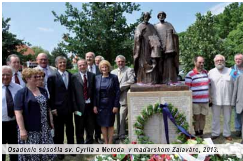
Osadenie súsošia sv. Cyrila a Metoda v maďarskom Zalaváre, 2013.

Otvárame rozsiahlejší cyklus Náš slovenský svet s matičnou reflexiou na jeho cenu, význam a poslanie v minulosti a súčasnosti. Skončený rok sv. Cyrila a Metoda pokladáme za dôstojnú odrazovú pôdu pre ďalšie témy zo slovenského sveta poučné pre všetkých, najmä pre našu mládež.