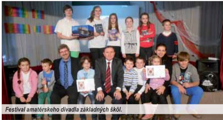
Festival amatérskych divadla základných škôl.

zentovala aj ZŠ Jasov, ktorá si odniesla do Jasova prestížnu cenu ministra školstva, vedy, výskumu a športu SR.