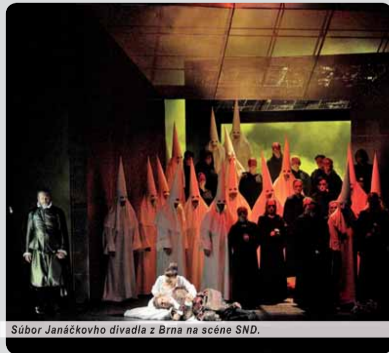
Súbor Janáčkovho divadla z Brna na scéne SND.

Fakulta výtvarného umění pri Vysokom učení technickom v Brne, na ktorej študujú desiatky slovenských nádejných umelcov, v novembri oslávila 20. výročie založenia, čo si pripomenula v zrekonštruovanom renesančnom Divadle Reduta – najstaršom v Európe. Reduta spolu s Janáčkovým divadlom a Mahenovým divadlom sú hracími priestormi Národného divadla v Brne. Jedným z docentov na FVU v Brne sa stal v tomto