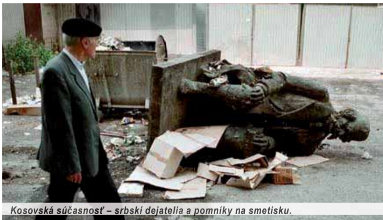
Kosovská súčasnosť – srbskí dejatelia a pomníky na smetisku.

Proti prijatiu Kosova do organizácie OSN UNESCO bolo aj