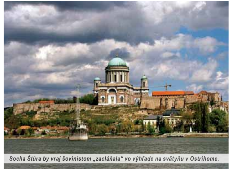
Socha Štúra by vraj šovinistom „začláňala“ vo výhľade na svätyňu v Ostrihome.