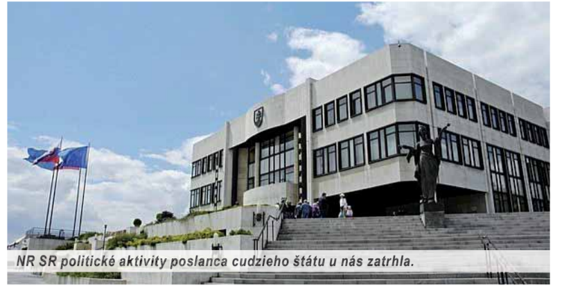
NR SR politické aktivity poslanca cudzieho štátu u nás zatrhla.

Novela zákona sa však netýka na Slovensku iba Jobbiku. Ak strana alebo jej poslanec budú na Slovensku pôsobiť v rozpore so slovenskými zákonmi, budú môcť dostať sankciu od šesťsto do tritisícpäťsto eur. A takú stranu tu máme už od minulých volieb. Dokonca opätovne kandiduje do parlamentu, aj keď má vo vedení osoby, ktoré sú s pravdepodobnosťou hraničiacou s istotou cudzími štá-