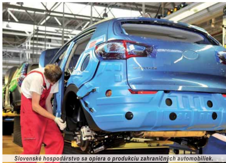
Slovenské hospodárstvo sa opiera o produkciu zahraničných automobiliek.

Slovensko je súčasťou svetovej ekonomiky. Je tiež súčasťou Európskej únie a v nej aj menovej únie. Je zároveň súčasťou európskeho hospodárskeho i politického priestoru. Z toho mu vyplývajú určité práva a povinnosti. Ako tieto skutočnosti využijeme a do akej miery pri ich uplatňovaní nestratíme vlastnú tvár a slovenské národné záujmy, závisí najmä od nás samých. Musíme však pripustiť realitu, že pri rozhodovaní hlas