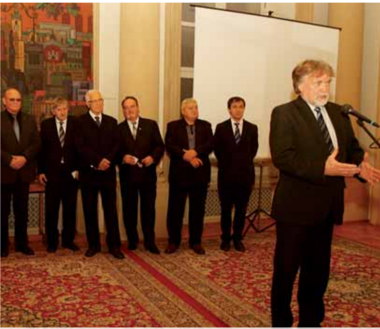
Predseda Výboru NR SR pre kultúru a médiá Dušan JARJABEK pri slávnostnom príhovore k laureátom.

Zámer uskutočniť reprezentatívne umelecké a kultúrno-spoločenské podujatie k Roku Ludovíta Štúra vznikol ako súčasť príprav na usporiadanie výstavy Dielo, pocta a portrét – Ludovít Štúr v slovenskom výtvarnom umení, ktorá bola inštalovaná v čase ústredných osláv na pôde Úradu vlády SR. Išlo práve o to, aby oceňované umelecké osobnosti mali dostatočný priestor na prezentovanie svojej umeleckej tvorby i na reflexiu o sebe samých.