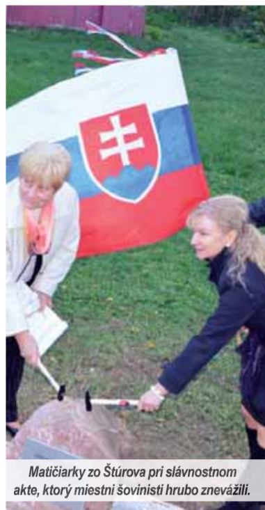
Matičiarke z Štúrova pri slávnostnom akte, ktorý miestni šovinisti hrubo znevažili.

Po tolkých desaťročiach názov Štúrovo v druhej väčšine nespochybnujú najmä žiaci slovenských škôl a gymnaziálnych tried. Iná situácia je u študentov a žiakov škôl či tried s maďarským vyučovacím jazykom. V tejto citlivej, ako v Štúrove vravia háklivej otázke je význam podujatia a aktivít Matice slovenskej, matičiarov a matičiarok v Štúrove a v susedných obciach a v tamojších školách