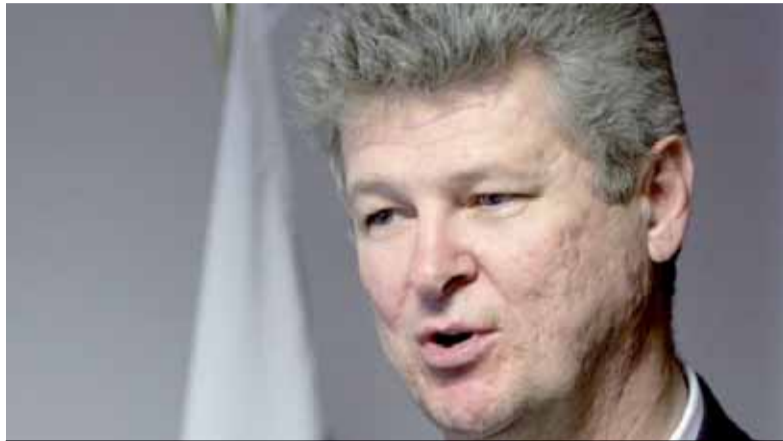
Maďarský autonomista, ktorý neuznáva odkaz L. Štúra.