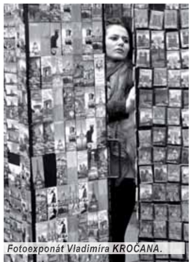
Fotoexponát Vladimíra KROČANA.

Vo výstavnej sieni liptovskomikulašského Domu MS jeho pracov-