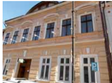
Penzión nad Bankou sa nachádza v srdci historického jadra Košíc