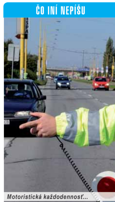
ČO INÍ NEPIŠU

Slovenská národná strana preto logicky a pochopiteľne protestuje proti zvyšovaniu pokút za prekročenie najvyššej povolených rýchlostí na cestách. Príslušnú novelu zákona má schvaľovať na novembrovej schôdzi parlament. Podľa SNS by sa parlament, vláda i polícia mali zamerať predovšetkým na to, čo je napísané na každom policajnom aute: Pomáhať a chrániť!