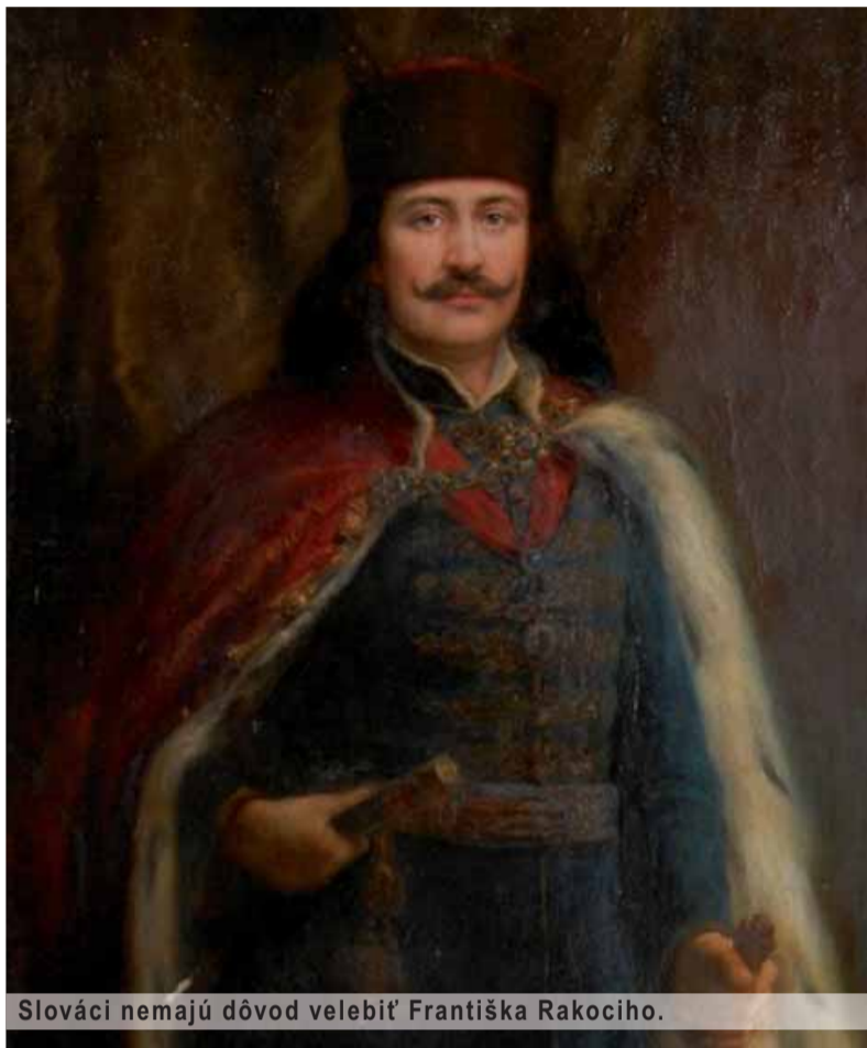
Slováci nemajú dôvod velebiť Františka Rakociho.

Ak denne „stretávate“ na námestiach sochy z dávnej či nedávnej minulosti, nerozlišujete, či sú to hrdinovia alebo len „hrdinovia“. Komu sa sochy nestavajú, o tom sa nevie, mohol mať hoci zlaté srdce. A z „hrdinov“ sa takto stávajú skutoční hrdinovia – ako napríklad generál Klapka, ktorý je ozdobou Komárna napriek tomu, že chcel dať obesiť Petöfiho! František Rákocii okupuje stenu košickej katedrály – Dómu sv. Alžbety – zaiste za... Za zásluhy o Košice? Ani náhodou!