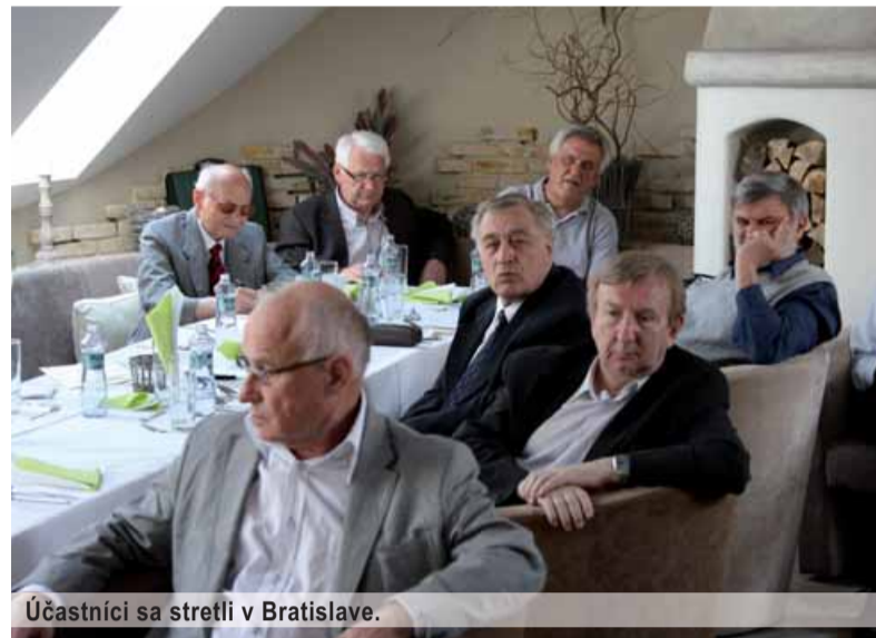
Účastníci sa stretli v Bratislave.