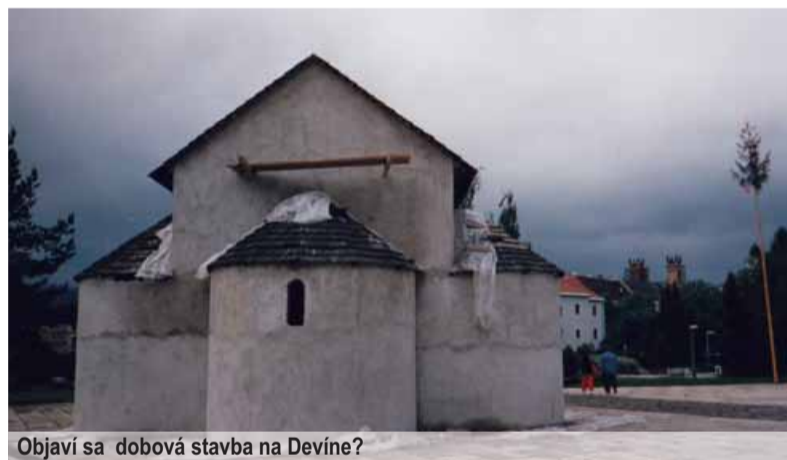
Objaví sa dobová stavba na Devíne?

ského hradu vyrástla replika devínskej baziliky, ktorá vo svojom vnútri ukrývala skutočné písomné poklady. Faksimile listu pápeža Jána VIII. Svätoplukovi či arcibiskupovi Metodovi, Zákon sudnyj ljudem, Napomenutie