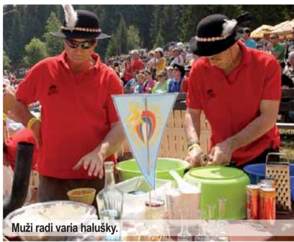
Muži radi varia halušky.

Krv z porajbaných prstov, pot pri varení i jedení a veselá muzika. Aj toto patrilo k majstrovstvám sveta vo varení halušiek v Terchovej, ktoré sa určite vydarili. Práve v čase terchovskej haluškiády začal švagor chodiť za robotou do Rumunska. Keď sa vrátil prvý raz, doniesol tamjší syr. Celkom fajn, chuťou pripomínal zhruba balkánsky kaškaval. Na druhý raz priniesol rumunskú bryndzu. O poznanie inej farby, akejsi žltkastej, inej konzistencie, akejsi red-