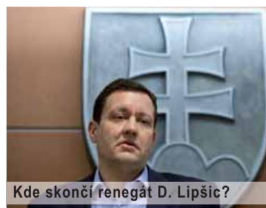
Kde skončí renegát D. Lipšic?

Dlho očakávaný odchod Daniela Lipšica z KDH sa napokon dokončil. Spolu s poslankyňou Janou Žitňanskou opustili hnutie dva mesiace po parlamentných voľbách a mesiac pred plánovaným dátumom snemu kresťanských demokratov. Sú prvými nezávislými poslancami v tomto volebnom období. Za povšimnutie stojí, že aj v minulom volebnom období sa prvým nezávislým poslancom stal člen klubu KDH Andrej Ďurkovský. A aj keď títo páni na prvý pohľad nemajú nič spoločné, nie je to tak.