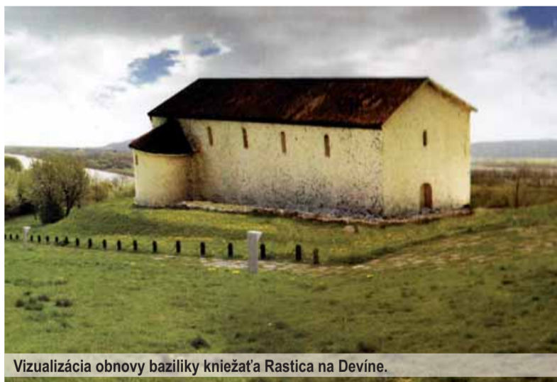
Vizualizácia obnovy baziliky kniežata Rastica na Devíne.