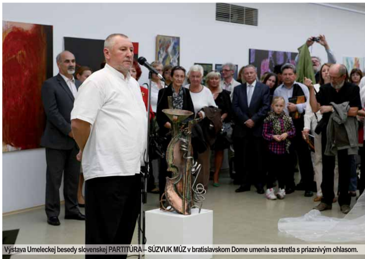
Výstava Umeleckej besedy slovenskej PARTITÚRA – SÚZVUK MÚZ v bratislavskom Dome umenia sa stretla s priaznivým ohlasom.

K evidentnej skutočnosti, že takmer dve desiatky príslušníkov spolku sa programovo vo svojich výtvarných dielach venujú transpozícii hudby a viacerí navyše popri výtvarnom talente disponujú rovnovážne aj talentom