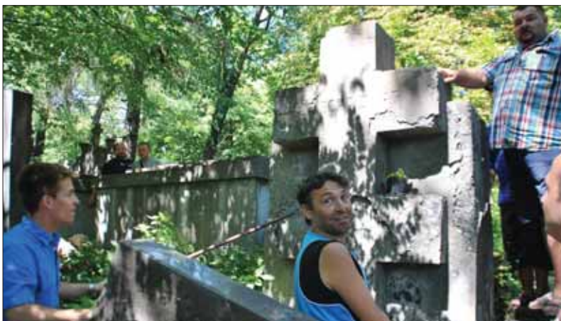
Objav pamätníka sedemnástim padlým slovenským vojakom na cintoríne v L'ove

Na slávnostné odhalenie cestovala do Lipovca štyridsaťčlenná skupina fanúšikov slovenských vojnových dejín. Na tento rok v O. Z. plánovali ďalšiu fázu obnovy tohto pietneho miesta, konkrétne rekonštrukciu časti pôvodných hrobových miest slovenských vojakov, čo je okolo deväťdesiat hrobov. Formu rekonštrukcie dohodli pri osobnej návšteve zástupcov Múzeu ozbrojených zložiek v júni 2018 priamo v Lipovci.