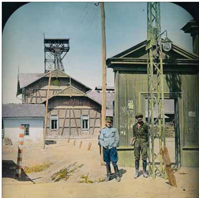
Akosi sa pozabúda na skutočnosť, že k prvej republike patrili aj rozsiahle oblasti Zakarpatskej Ukrajiny či Podkarpatskej Rusi s významným surovinovým potenciálom...

To nebol útok, to bola skutočná okupácia. Navyše k nám nevrhla legálna maďarská armáda, ale zdvižené vojsko boľševického rebela Bélu Kuna. Väčšina jeho bojovníkov sa práve vracala z krvavých bitiek v rozvrátenom Rusku, v ktorých doslova stratili ľudské správanie. Bol to brutálny teror bez akýchkoľvek civilizovaných pravidiel, v prvých mesiacoch dokonca politicky podporovaný najvyššími orgánmi Maďarska. Vytyčenie nových hraníc víťaznými veľmocami Maďari označili za smrť maďarskej národnej integrity, pričom pod týmto slovným spojením mali na mysli tento aj všetky porobené národy Uhorska, teda i Slovákov – v ich ponímaní to všetko bol „maďarský národ“. Tento hrozný a v podstate aj tragický sebaklam ich strašil ešte dlho po prehratej svetovej vojne! Prezident Mihály Károlyi na protest proti odtrhnutiu Slovenska, Sedmohradska a Zakarpatskej Ukrajiny abdikoval a moc odovzdal ozbrojenej zberbe – revolučným gardám Bélu Kuna. Vtedajšia osobnosť slovenskej politiky Ivan Dérier v tom