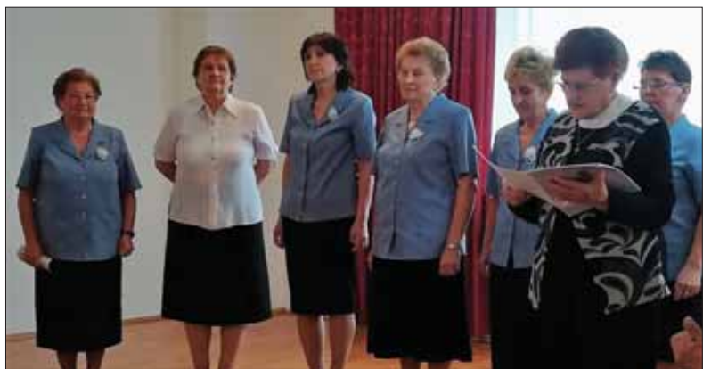
Členovia MO MS v podhorskej obci Obyce si v minulých dňoch pripomínali polstoročie činnosti a na slávnostnej hodnotiacej výročnej schôdži nechýbalo ani oceňovanie obetavej práce zaslužilých matičiariok.

Na priestore tohto príspevku ani zďaleka nemožno obsiahnuť celú matičnú históriu Obýc. Vyzdvihnime z nej aspoň najdôležitejšie okamihy, ktoré výrazne formovali kultúrne a národné dianie v obci, ale aj v širšom okolí. Už krátko založení tunajšej matičnej organizácie vstúpili jej členovia do povedomia spoluobčanov prezentáciou tradičných zvykov v čase Vianoc. Súčasťou všetkých obyčkových slávností bol od začiatku spevok