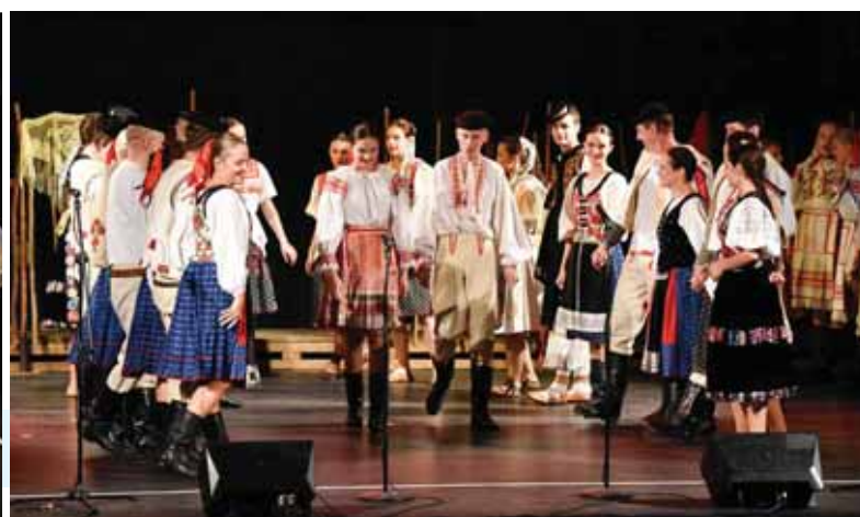
V takmer dvojhodinovom programe uviedli menší i väčší breznianski folklóristi všetky tanziskové tanečné choreografie a spevy, s ktorými úspešne prešli kus sveta.