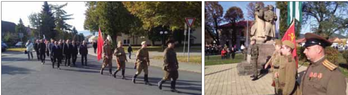
Hencovskí matičiari v dobových uniformách sú často súčasťou spomienkových aktov na vojnové udalosti, ako to dokumentujú aj obrázky z ich účinkovania na pripomenutie povstaleckej prehliadky počas Slovenského národného povstania v Detve.

V sobotu dopoludnia 6. októbra 2018 niekoľko stoviek ľudí pochodovalo starou časťou Detvy, mestom pod Poľanou, aby si takto pripomenuli sedemdesiatštyri rokov od uplynutia jedinej partizánskej prehliadky z obdobia Slovenského národného povstania.