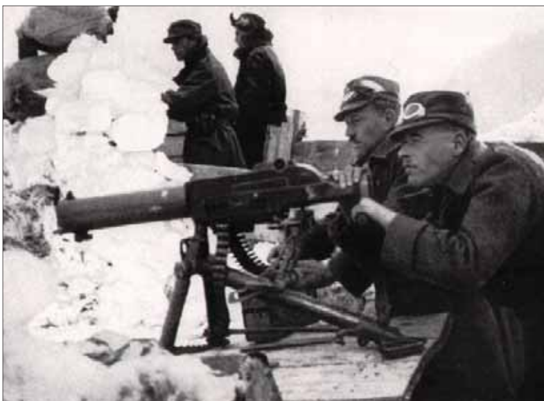
Nové automatické „strojné pušky“ aj nasadenie chemických zbraní prinášali na frontoch prvej svetovej vojny nesmierne obete – na snímke guľometníci v rakúsko-uhorských pozíciách.

Štyridsiatim štyrom bol tretí jún osudný. O téme existuje viac filmových a literárno-historických dokumentov, osobných iniciatív, najmä vojvodinských Slovákov. Kragujevský pomník martýrom mal až do roka 2002 istú zvláštnosť. Mená popravených boli napísané po česky, keďže to vtedy riadila Praha. To iritovalo