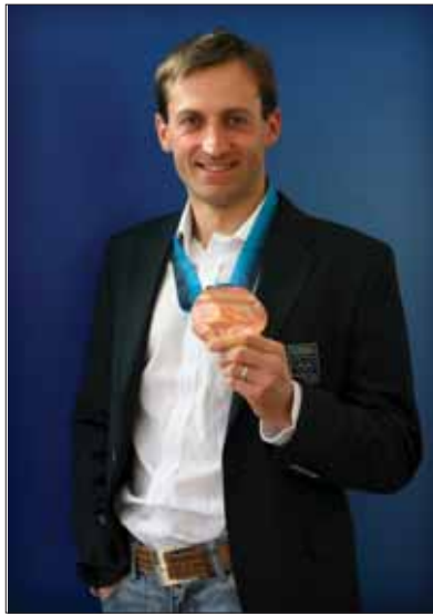
Pavol HURAJT v čase svojich najväčších športových úspechov, keď na Zimných olympijských hrách v kanadskom Vancouveri získal v pretekoch s hromadným štartom bronzovú medailu, a historická snímka, ako sa tešil z vynikajúceho výsledku po dobehnutí do cieľa pretekov.

Keďže som nemal až takú výkonnosť ako povedzme Martin Bajčičák alebo Ivan Bátory, s bežeckým lyžovaním som musel nedobrovoľne skončiť. Vtedy som si položil otázku – či sa zamestnať v bežnom zamestnaní, alebo ešte skúsiť iný šport. Keďže bežecké lyžovanie patrilo medzi vytrvalostné športy, rozhodol som sa, že vyskúšam ešte biatlon. Moje rozhodnutie stať sa profesionálnym biatlonistom uľahčila skutočnosť, že po niekoľkých skúšobných výstreloch z pušky som zistil, že na streľbu mám talent. Musím sa priznať, že predtým som nijakú zbraň v ruke nedržal. Začiatky boli, samozrejme, ťažké,