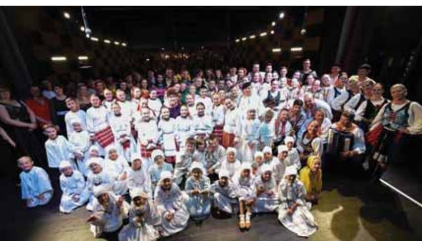
V slávnostnom programe k jubileu súboru Šťastné detstvo sa predstavilo niekoľko generácií jeho členov.

Predposlednú októbrovú sobotu sa v breznianskom mestskom dome kultúry uskutočnil slávnostný galaprogram pri príležitosti štyridsiateho výročia založenia Detského folklórneho súboru Šťastné detstvo.