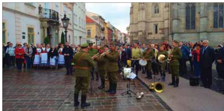
Atmosféra na Hlavnej ulici východoslovenskej metropoly pred začiatkom spomienkovej štafety na pôsobenie česko-slovenských legionárov, v radoch ktorých statočne bojovali aj slovenskí dobrovoľníci.

Na košické pomery početný sprievod prešiel Hlavnou ulicou a zastavil sa aj pri buste predsedu SNR 1848 J. M. Hurbana a pri reliéfe M. I. Kutuzova, kde si účastníci pripomenuli symbolicky najpočetnejšie legionárske vojsko v Rusku 1914 – 1920. Potom sprievod pokračoval k buste a tabuli Ludovíta Štúra a Jonáša Záborského. Druhá časť programu vrcholila v sále Slovenského technického múzea, kde bola pripravená prednáška o pohnutých udalostiach prvej svetovej vojny a oslobodenia od Uhorska. Prednášku sprevádzalo vystúpenie matičných folklórnych skupín, Orchestra Vychodňarov, ale aj divadelná scéna venovaná Janovi Jesenskému, legionárom a M. R. Štefánikovi. Vďaka organizačnému vkladu D MS v Košiciach a mladých matičiarov podujatie v tento historický deň v meste rezonovalo. Zúčastnili sa na ňom predstavitelia ÚC Košice, SZPB a Rusínskej obrody na Sloven-