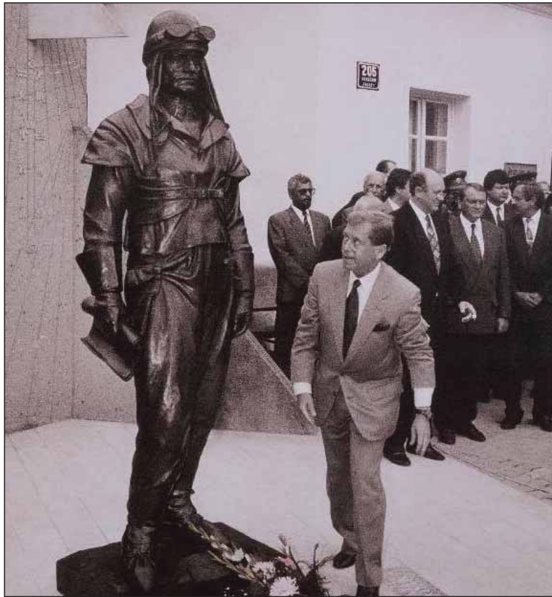
Táto fotografia je viac ako výrečná – vyfabulovaná veľkosť Václava Havla a skutočná veľkosť osobnosti národného hrdinu...

Priemerný dramatik sa stal prezidentom po tajnej dohode s komunistickým predákom Mariánom Čalfom za chrbtom OF a VPN. Havel sa k dohodám s komunistami nikdy nevyjadril, a tak faktom zostáva iba to, že bol zvolený za prezidenta jednoducho akklamčným