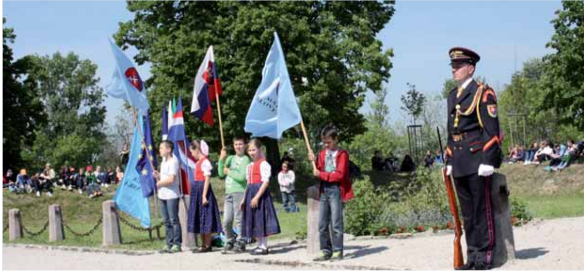
Mohyla M. R. Štefánika v Ivanke pri Dunaji predstavuje jedno z najpietnejších miest slovenských dejín.

Zásluhou matičného hnutia a matičných stredísk na podunajskej trase Bratislava – Komárno, tepne Žitného ostrova, sa po roku 1989 podstatne posilnilo jazykovo zmiešané prostredie o stopy – pomníky, busty svetového Slováka, Slovana, Európana generála Dr. Milana Rastislava Štefánika.