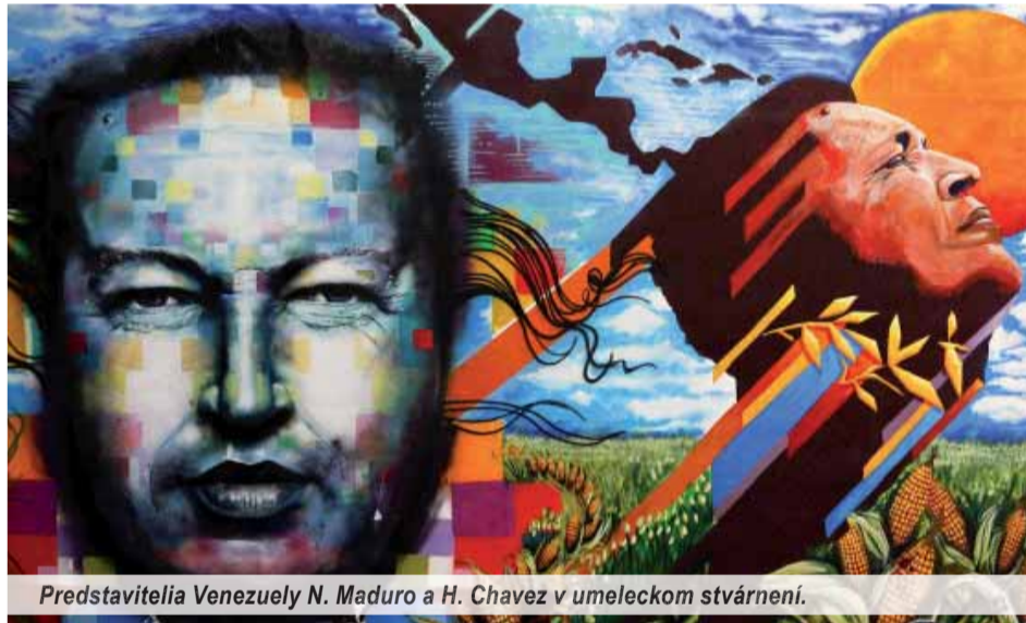
Predstavitelia Venezuely N. Maduro a H. Chavez v umeleckom stvárnení.

Celá Latinská Amerika má základ v indiánskej kultúre, ktorá je dnes preoblečená do kultúry katolíckej viery, ako som už spomínal. Etnická, rasová aj kultúrna zmesnosť je pre konečnú podobu kul-