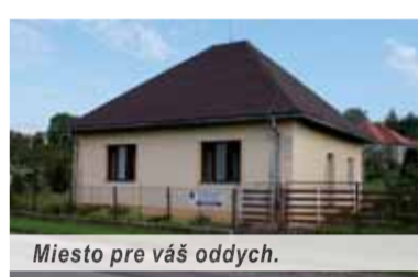
Miesto pre váš oddych.

Z ponuky je zrejme, že nejde o supermoderné ubytovacie zariadenie s wellnessom, ale o tu viac