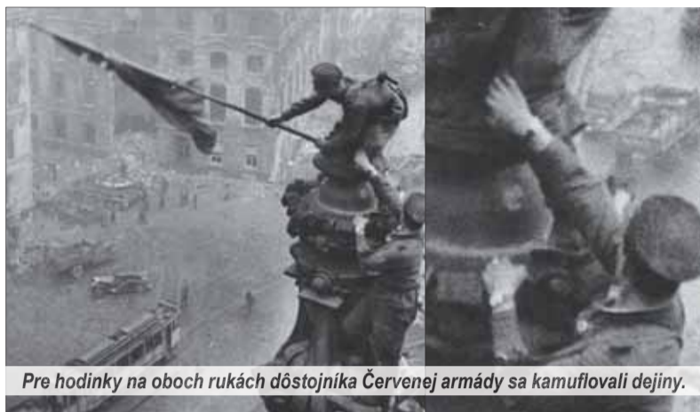
Pre hodinky na oboch rukách dôstojníka Červenej armády sa kamuflujú dejiny.

Slovenská verejnosť sa mohla prednedávnom na putovnej výstave fotografií zoznámiť s historickými udalosťami druhej svetovej vojny tak, ako ich zachytili reportéri TASS-u. Medzi nimi bola slávna fotografia vyvesovania bojovej červenej zástavy s kosákom a kladivom nad dobytým sídlom ríšskeho snemu – Reichstagom. Oficiálne dejiny Tlačovej agentúry Sovietskeho zväzu, ktorá je pod týmto názvom stále aktívna, sa dnes vracajú k skutočným príbehom, ako historické snímky vznikali.