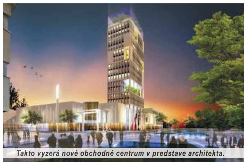
Takto vyzerá nové obchodné centrum v predstave architekta.

„Tento rok by sme radi získali všetky potrebné povolenia na