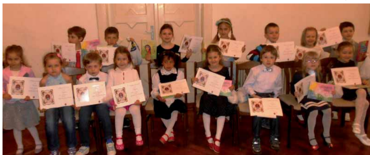
Odmenené šťastné deti s matičnými diplomami a krásnymi rozprávkovými knihami.

Matica slovenská zastúpená MO MS Košice-Myslava, mesto Košice, Slovenské technické múzeum v Košiciach usporiadali v reprezentačných priestoroch STM na košickej Hlavnej ulici 4. mája 2015 v rámci Dní mesta Košice už 11. ročník matičného galakonzertu detí z materských škôl z celého Košického kraja v prednese slovenských rozprávok Detské rozprávky Košice J. Uličianskeho.