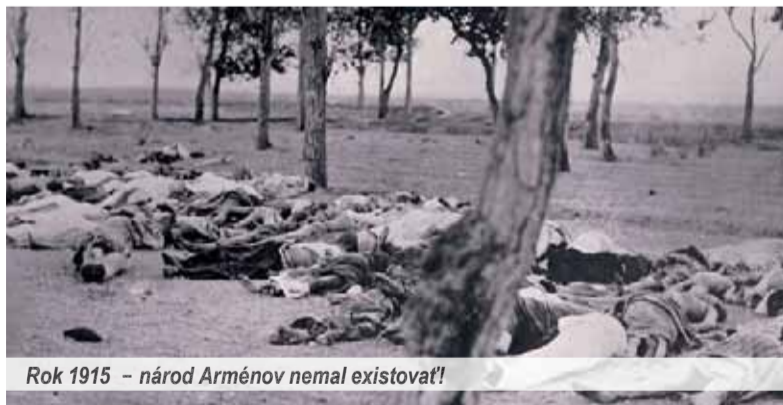
Rok 1915 – národ Arménov nemal existovať!

Zaujímavá je situácia aj v Ruskej federácii, ktorá má mimoriadne