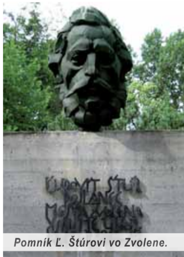
Pomník L. Štúrovi vo Zvolene.

Štúr sám vyslanec za slobodné kráľovské mesto Zvolen sa dôsledne pripravoval na svoje vystúpenia. Z tohto dôvodu aj prvú snemovú reč, pričom tá i všetky jeho ďalšie parlamentné prejavy a poznámky boli, samozrejme, publikované v novinách, 17. novembra 1847 zamerál na obhajobu práv slobodných kráľovských miest a meštianstva. V nadväznosti na L. Kossutha vystúpil Štúr po druhýkrát 21. decembra 1847 a zaoberal sa problematikou vykúpenia urbárnych poddaných z urbárskych povinností. (Pokračovanie v budúcom čísle)