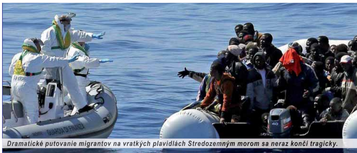
Dramatické putovanie migrantov na vratkých plavidlách Stredozemným morom sa neraz končí tragicky.

Európska komisia predstavila zámer, ako by sa spoločenstvo malo vyrovnáť s prílivom imigrantov. Z utečeneckých táborov, ktoré ležia v oblastiach konfliktov mimo Európy, je pripravená poskytnúť azyl pre dvadsaťtisíc utečencov. Pre Slovensko to znamená kvótu 356, alebo tiež prijatých 356 ľudí s krutým životným osudom.