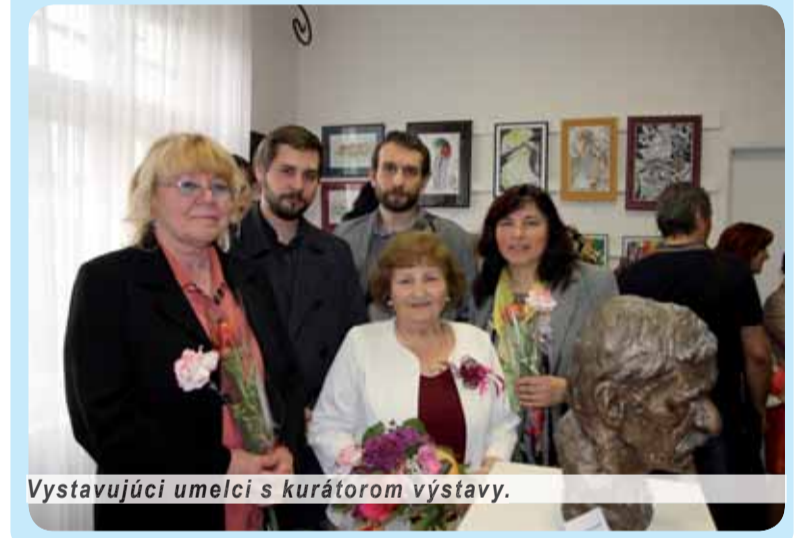
Vystavujúci umelci s kurátorom výstavy.