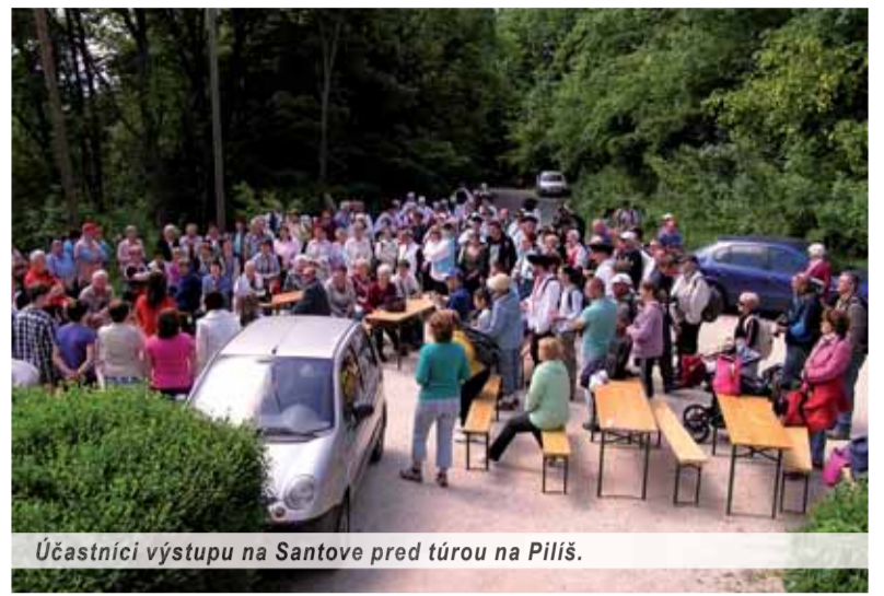
Účastníci výstupu na Santove pred túrou na Piliš.

Účastníci poznávacieho pobytu vzdali poctu pilišskym predkom zo Slovenska. Zažili súdržnosť a veria, že prispeli k zomknutiu síl ľudí dob-