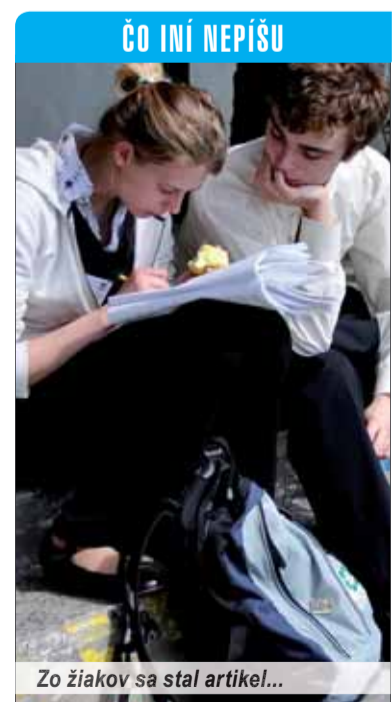
Zo žiakov sa stal artikel...

V niektorých prípadoch vraj školy vykazujú neexistujúcich žiakov zámerné. Takéto podvody sú za desaťtisíce eur. V niektorých prípadoch už prebiehajú súdne spory. Podľa ministra ide o vážny problém, pretože ministerstvo v súčasnosti pracuje s nedostatočnými údajmi. „V 21. storočí ako minister školstva