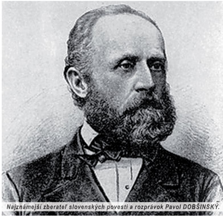
Najznámejší zberateľ slovenských povestí a rozprávok Pavol DOBŠINSKÝ.

Narodil sa 16. marca 1828, zomrel 22. októbra 1885. Ako ne jeden zo štúrovcov i Dobšinský pochádzal z Gemera. Rozhodujúci vplyv na jeho formovanie ako tvorivej osobnosti malo štúdium na lýceu v Levoči (1840 – 1848). Táto škola sa po odchode prívržencov Ľudovíta Štúra z Bratislavy na protest voči odstráneniu obľúbenej osobnosti z postu profesora od roku 1844 stala centrom hnutia slovenských študentov, podchytených vďaka aktivitám Jána Francisciho v organizácii nazvanej Jednota mládeže slovenskej (pozri vyššie). Najaktívnejšiu zložku združenia s celoslovenskou pôsobnosťou (pobočky fungovali pri evanjelických lýceách v Bratislave, Kežmarku, Levoči, Banskej Štiavnici a evanjelickom kolégiu v Prešove) tvorili od polovice štyridsiatych rokov Levočania. Práve v levočskej Jednote sa Dobšinský zoznámil s celoživotnými priateľmi Jánom Bottom, Jánom Čajakom i Ľudovítom Kubáňim. Vážil si ich ľudsky i z literárneho hľadiska. Ako editor usporiadal a skompletizoval často ťažko čitateľné verše už viackrát spomenutého Janka Čajaka (zomrel v roku 1867), práce Ľudovíta Kubáňiho, pričom dopísal jeho novelu Suplikant i niekoľko diel z pozostalosti Jána Bottu.