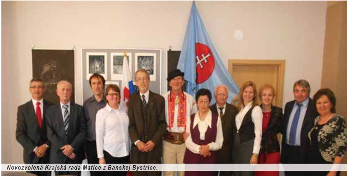
Novozvolená Krajská rada Matice z Banskej Bystrice.