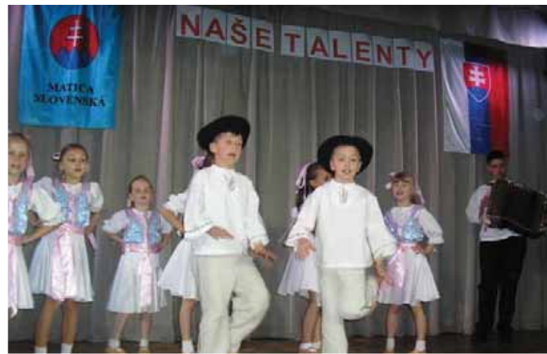
Žilinské Naše talenty 2016 hľadali nadané deti už po siedmy raz.