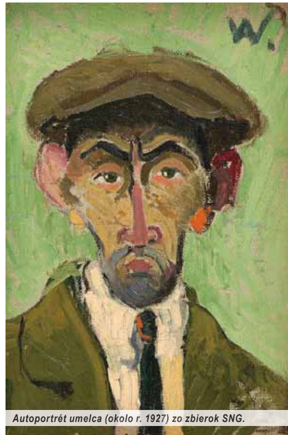
Autoportrét umelca (okolo r. 1927) z zbierok SNG.