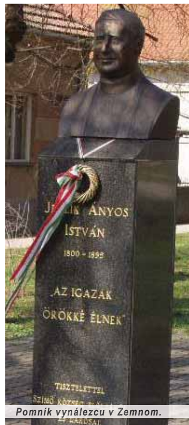
Pomník vynálezcu v Zemnom.

Štefan Jedlík sa narodil 11. januára 1800 v Zemnom pri Komárne v chudobnej roľníckej rodine. Stredoškolské štúdiá absolvoval na gymnáziách v Trnave a v Bratislave. V roku 1817 vstúpil do benediktínskej rehole v zadunajskej Pannonhalme, prijal rehoľné meno Anián a pokračoval v štúdiách teológie a súčasne aj matematiky i fyziky na univerzite v Pešti, čo bola časť súčasnej Budapešti. Po získaní doktorátu filozofie pôsobil ako profesor fyziky a prírodopisu na gymnáziu v Rábe (dnes maďarský Győr) a neskôr na Kráľovskej akadémii v Bratislave. Od roku 1839