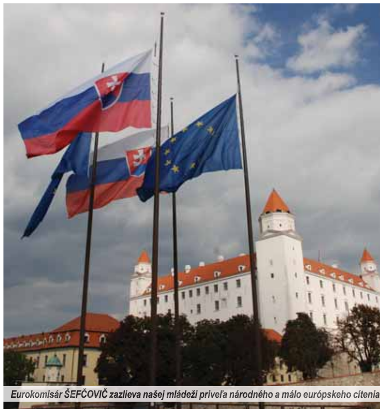
Eurokomisár ŠEĎČOVIČ zazlieva našej mládeži prívleľa národného a málo európskeho čítania.

Veď áno, je to pekné. Ale čo potom znamenajú výsledky