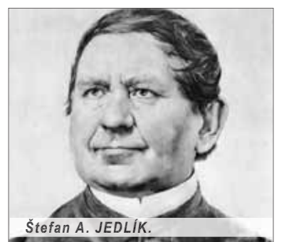
Štefan A. JEDLÍK.