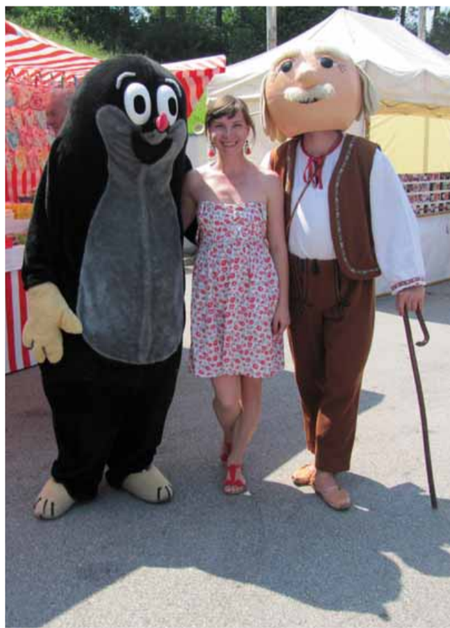
Deduško Večerniček a Krtko potešili deti i dospelých.