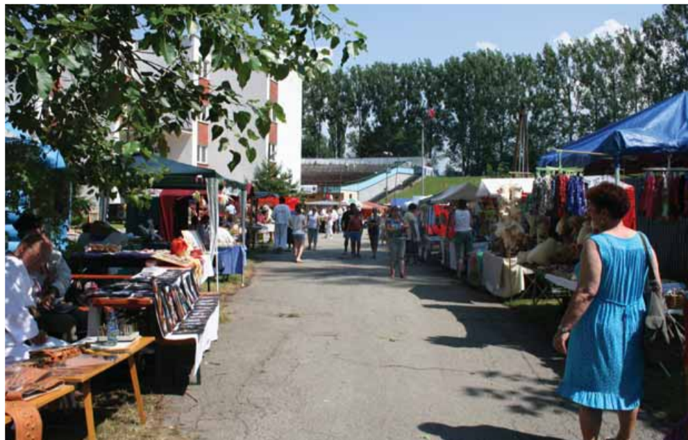
Na jarmoku ľudových remesiel ste si mohli kúpiť fujaru, drotárske výrobky či maľované plátno.