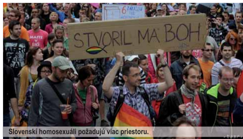
Slovenskí homosexuáli požadujú viac priestoru.

Začiatkom júna sme mali v Bratislave opäť možnosť prizerať sa pestrofarebnému dúhovému výjavu. Sexuálna menšina znowa mala neodbytné nutkanie prezentovať svoju nespokojnosť s jej aktuálnym postavením v našej „spiatočnickej“ spoločnosti a obnažovať svoje myšlienky do úplnej nahoty, a to miestami i doslovne.