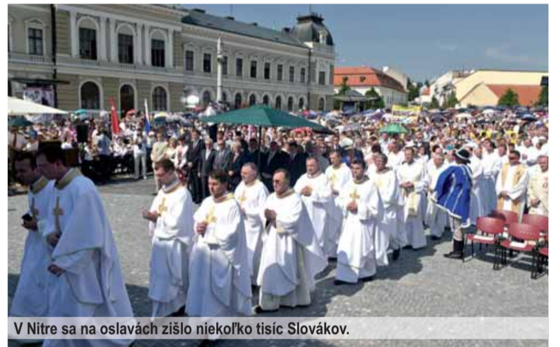
V Nitre sa na oslavách zišlo niekoľko tisíc Slovákov.