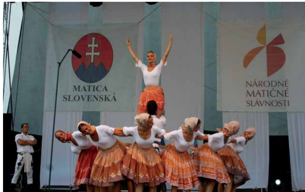
Nenašiel sa nikto, kto by netlieskal tanečnícom z Lúčnice.