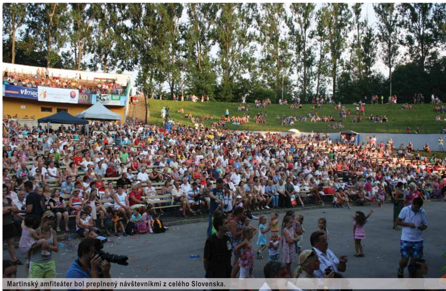
Martinský amfiteáter bol preplnený návštevníkmi z celého Slovenska.