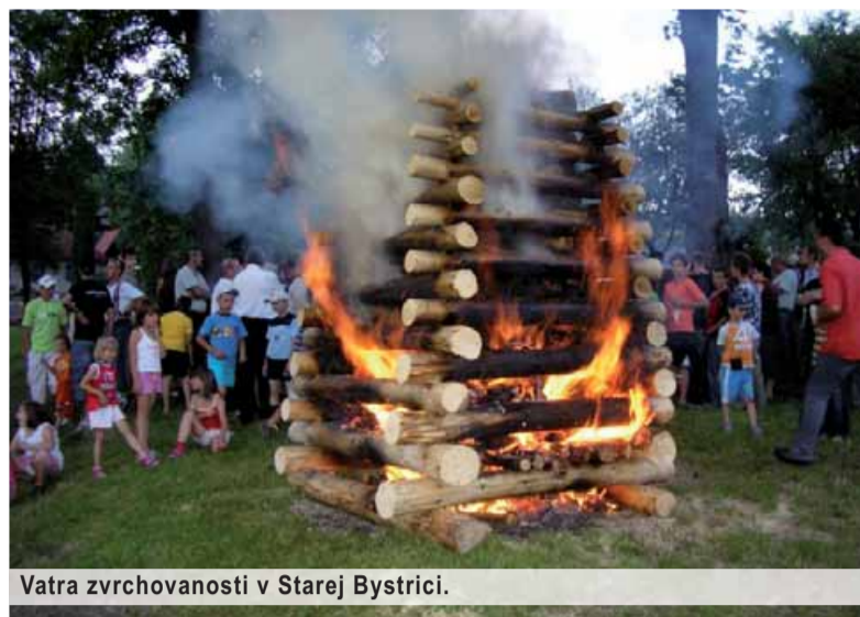
Vatra zvrchovanosti v Starej Bystrici.

Ján ČERNÝ – Foto: archív SNN, www.agrobell.sk