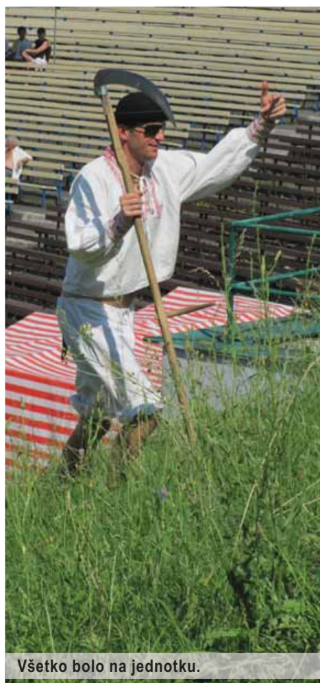
Všetko bolo na jednotku.