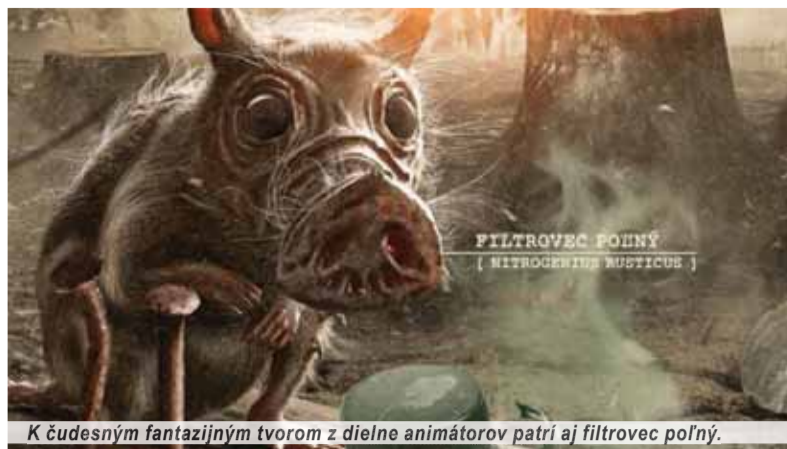
K čudným fantastickým tvorom z dielne animátorov patrí aj filtrovec poľný.

trvalo udržateľnej móde či otázkam plytvania jedlom. Organizátori správne odhadli, kde je kľúč k intenzívnejšiemu pôsobeniu myšlienok festivalu a v dopoludňajších hodinách prebehol takzvaný Junior festival pre základné a stredné školy. Ďalšou jedinečnosťou podujatia je jeho celoročný rozsah, keďže v rámci takzvanej „festivalovej tour“ navštívi desiatku krajských a okresných miest na celom Slovensku. To všetko s cieľom inšpiratívnym spôsobom meniť, bohužiaľ, zauží-