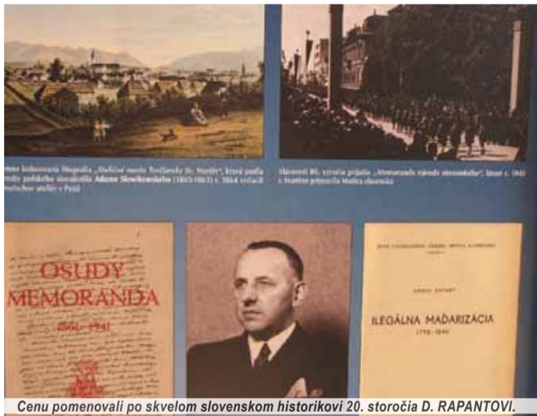
Cenu pomenovali po skvelom slovenskom historikovi 20. storočia D. RAPANTOVI.

• Ste vedeckým pracovníkom, posledných sedemnásť rokov aj tajomníkom Historického odboru Matice slovenskej a v súčasnosti aj šéfredaktorom Historického zborníka, čo je vedecké periodikum Slovenského historického ústavu a Historického odboru Matice slovenskej. Na čo z posledného