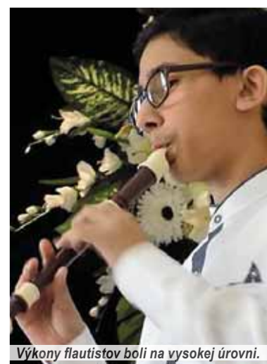
Výkony flautistov boli na vysokej úrovni.