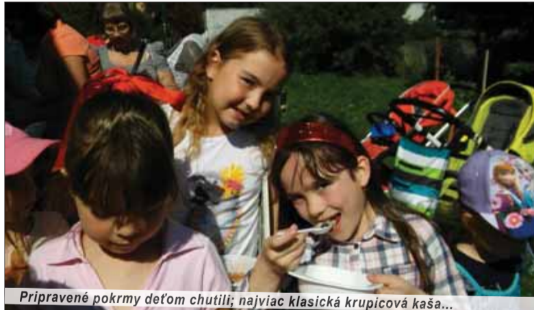
Pripravené pokrmy deťom chutili; najviac klasická krupicová kaša...

Za pekného slnečného počasia sa v Rodinnom centre zišla komunita rodičov, detí a učiteľiek tamojších škôl aj zástupcovia rezortných inštitúcií i sponzori a tiež účinkovalo divadielko, ktoré oživilo slovný, tanečný a spevácky repertoár o tému Ako uvariť dobrú kašu. Po skončení programu účastníci podujatia ochutnávali rôzne druhy kašo-