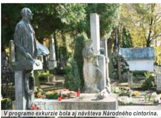
V programe exkurzie bola aj návšteva Národného cintorína.