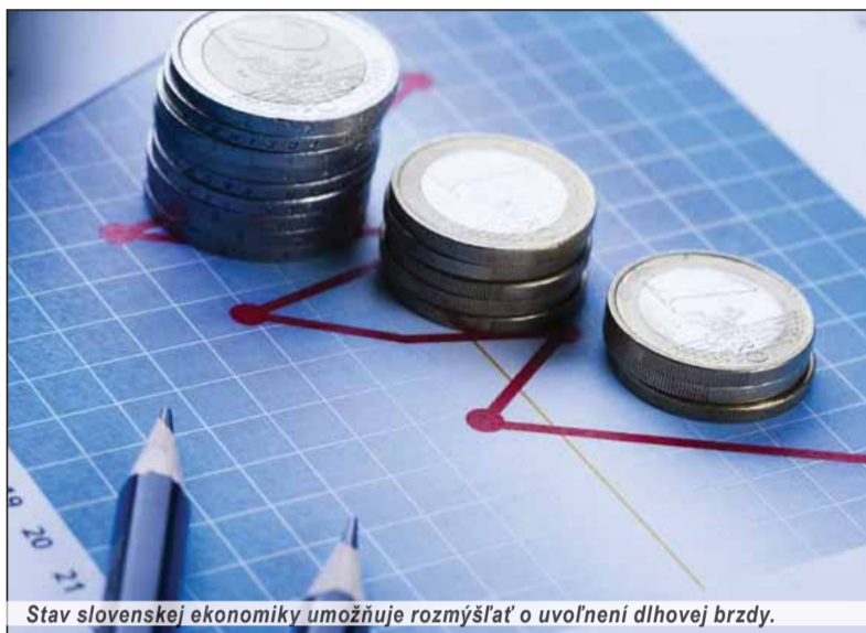
Stav slovenskej ekonomiky umožňuje rozmýšľať o uvoľnení dlhovej brzdy.

Na fungovanie štátu, ale aj na plnenie predvolebných sľubov budúcich vládnych kabinetov sú potrebné peniaze, ktoré vláda do štátneho rozpočtu získava najmä prostredníctvom daní, z vlastnej podnikateľskej činnosti a požičiavaním si peňazí od domácich a zahraničných investorov cez emitovanie štátnych dlhopisov a pokladničných poukážok. Ak verejný dlh podporuje hospodársky rast, netreba si s jeho výškou robiť starosti. Ak však hospodárstvo štátu neprosperuje, verejný dlh rastie, a teda zvyšuje sa deficit verejných financií k HDP. Ak je verejný dlh v štáte vysoký, menej peňazí na podnikanie dostane súkromný sektor, navyše dochádza k zvyšovaniu úrokov, viac sa šetrí a menej investuje s následným dosahom na budúci vývoj makroekonomických ukazovateľov. Na Slovensku máme ústavný zákon týkajúci sa rozpočtovej zodpovednosti vlády, ktorý hovorí o dlhových limitoch a z toho vyplývajúcej sankcii pre vládu. Ak vláda „dlhovú brzdu“ nedodrží, musí písomne zdôvodniť prekročenie deficitu k HDP a pripraviť súpis následných opatrení na jeho zníženie, ďalej je to viazanie troch percent vládnych výdavkov v rozpočte verejnej správy, zníženie plátov členov vlády, ba