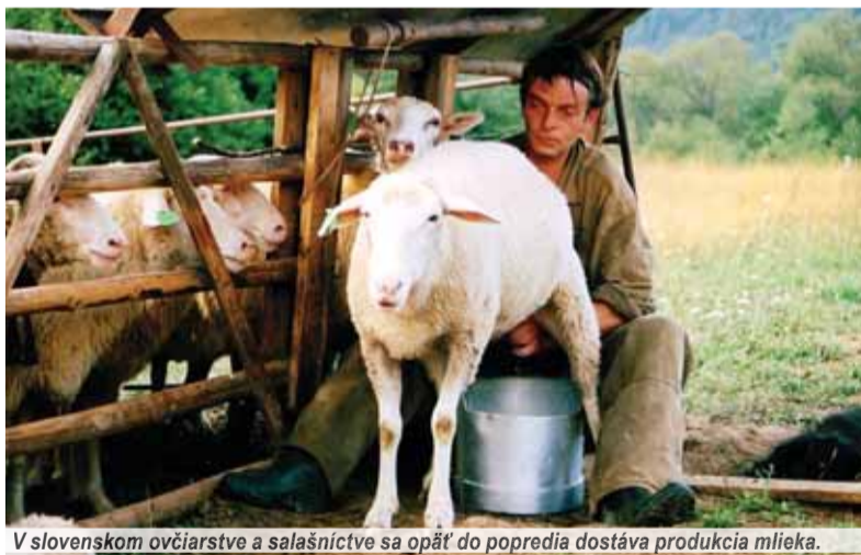
V slovenskom ovčiarstve a salašníctve sa opäť do popredia dostáva produkcia mlieka.

Karpatské salašníctvo sa líšilo od nížinného chovu oviec, rozšíreného do stredoveku v nížinatých oblastiach Slovenska. Pri horskom salašníctve sa ovce pásli najmä na vyššie položených nevyužívaných horských pasienkoch. So salašníctvom sa objavilo aj nové plemeno oviec – valaška. Vypelost' chovu sa prejavovala