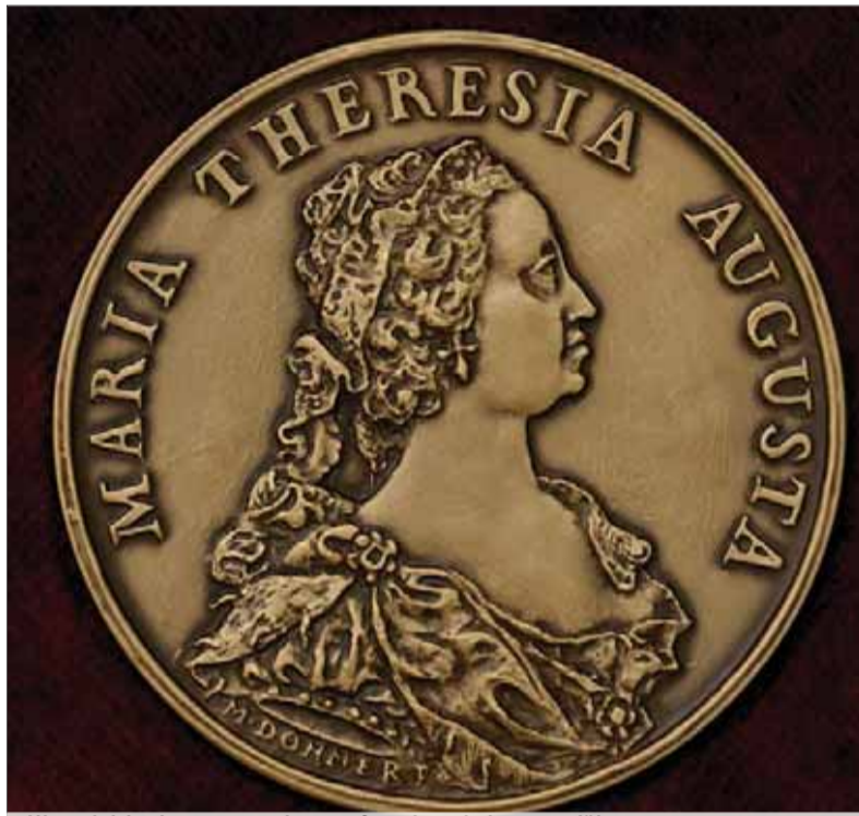
Historická minca s portrétom reformátorskej panovníčky.

Biskup Zigmund Kolonič pokrstil práve narodenú arcivojvodkyňu ešte v podvečer toho istého dňa, ako prišla na svet. Ceremonia prebiehala v prítomnosti členov habsburskej rodiny, dvorských činiteľov, vyslancov a pápežského nuncia. Do svätenej vody pridali päť kvapiek z rieky Jordán. Pri obradoch nechýbali ani vzácne relikvie – trň z Kristovej koruny, krv Spasiteľa a aj jeden klinec, ktorým Krista pribili na kríž. Dieťaťu sa ušlo až päť mien, čo v prípade člena takej významnej rodiny, akým boli rakúski Habsburgovci, nebolo až taký vysoký počet: Mária Terézia Walburga Amália Kristína.