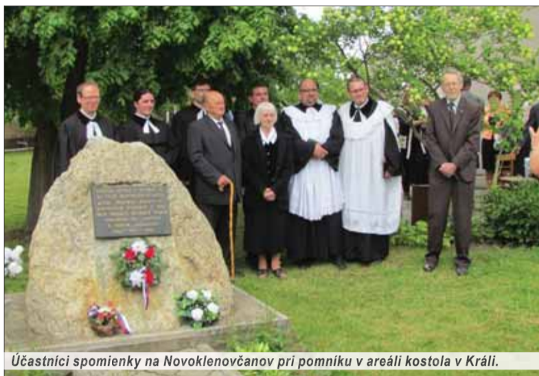
Účastníci spomienky na Novoklenovčanov pri pomníku v areáli kostola v Králi.