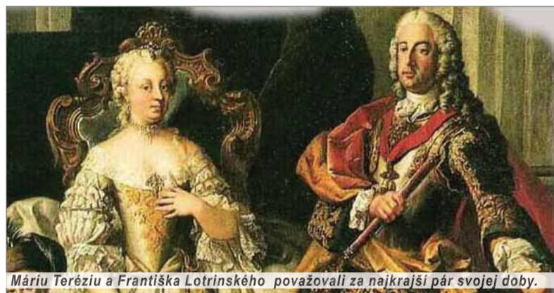
Máriu Teréziu a Františka Lotrinského považovali za najkrajší pár svojej doby.