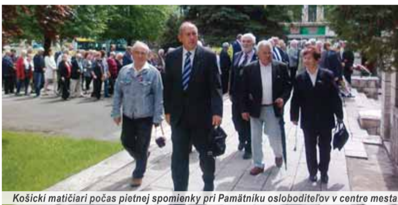
Košickí matičiari počas pietnej spomienky pri Pamätiku osloboditeľov v centre mesta.

Samotné oslobodzovanie Košic sa začalo v ranných hodinách 19. januára 1945 vstúpením jednotky