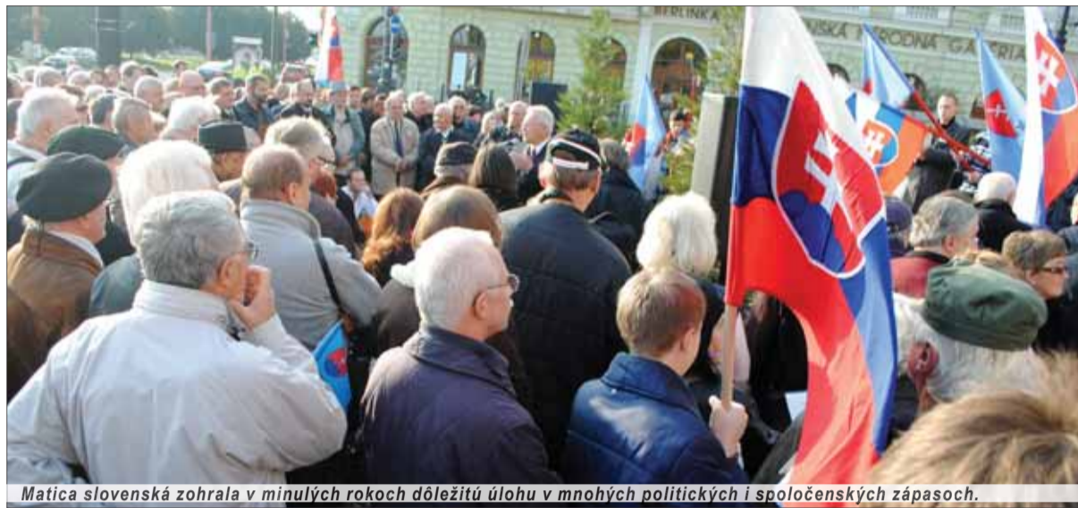
Matica slovenská zohrala v minulých rokoch dôležitú úlohu v mnohých politických i spoločenských zápasoch.

Štvrtstoročie maticných iniciatív pri obrane, ochrane a riešení novej slovenskej suverenity poskytuje priestor pripomenúť najmä mladšej maticnej generácii neodňateľné, nescudziteľné a nepremlčateľné zásluhy Matice slovenskej v búrlivých časoch nášho národa, najmä dramatický rok 1992. Stalo sa tak v sérii maticných výstupov z „kabinetu na fórum“ od začiatku deväťdesiatych rokov. Po „horúch udalostiach“ Bratislave a Uhrovci (Celonárodné zhromaždenie MS), Stretnutiach Slovákov z južného Slovenska v Šuranoch (od roku 1990), prelomovom valnom zhromaždení MS (1990), diskusiách o „funkčnej federácii“ (bývalý prezident ČSSR a ČSFR Václav Havel), čechoslovakistickom návrhu novej Ústavy ČSFR (1991), dnes už historických maticných Memorandách (199, 1991).