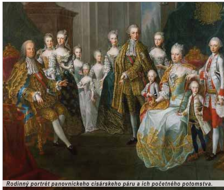
Rodinný portrét panovníckeho cisárskeho páru a ich početného potomstva.

Dvadsaťdruhého októbra 1740 zomrel Karol VI. a Mária Terézia sa ujala vlády. Na druhý deň už predsedala ministerskej rade. Dôraz