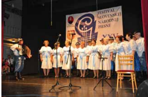
Všetkých účinkujúcich na 25. ročníku Festivalu slovenskej národnej piesne v Devínskej Novej Vsi spájala úprimná láska k hudbe a ľudovej kultúre.