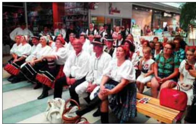
Priestory obchodného domu v centre dolného Zemplína sa nadlho zmenili na vďačnú folklórnu scénu a hľadisko.