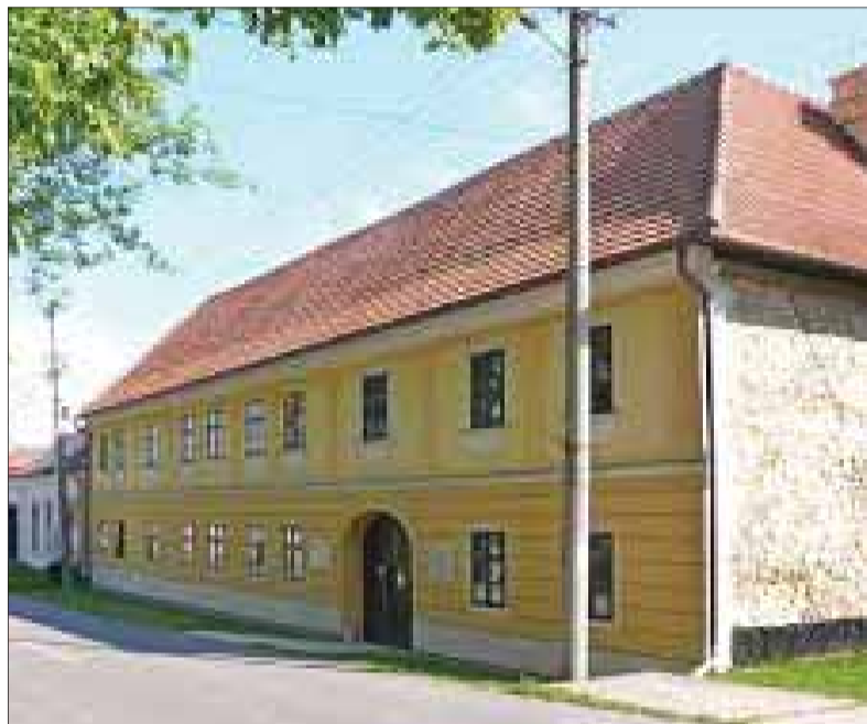
Patronátne gymnázium v Kláštore pod Znievom už svoju vzdelávaciu kapitolu uzavrelo a pedagogickú štafetu od neho prevzalo v roku 1959 gymnázium v Turčianskych Tepliciach, ktorému tiež hrozí „zatvorenie“ bez ohľadu na jeho historickú postać.

Zrejme práve toto mohli byť dôvody, aby sa podporila likvidácia tohto štúdia, resp. tieto dôvody sa uvádzajú. Zabudlo sa pritom na to, že okres Turčianske Teplice pokračuje ďalších takmer dvadsať kilometrov opačným smerom, ako aj na to, že sú aj iné obce v jeho okolí. Ak k tomu uvedieme, že na cestu do školy treba použiť hromadnú dopravu, tak na ceste do Martina treba prestupovať. Je azda jasné, že pre deti vo veku od