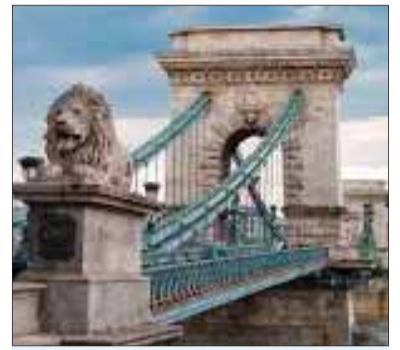
Reťazový most v Budapešti