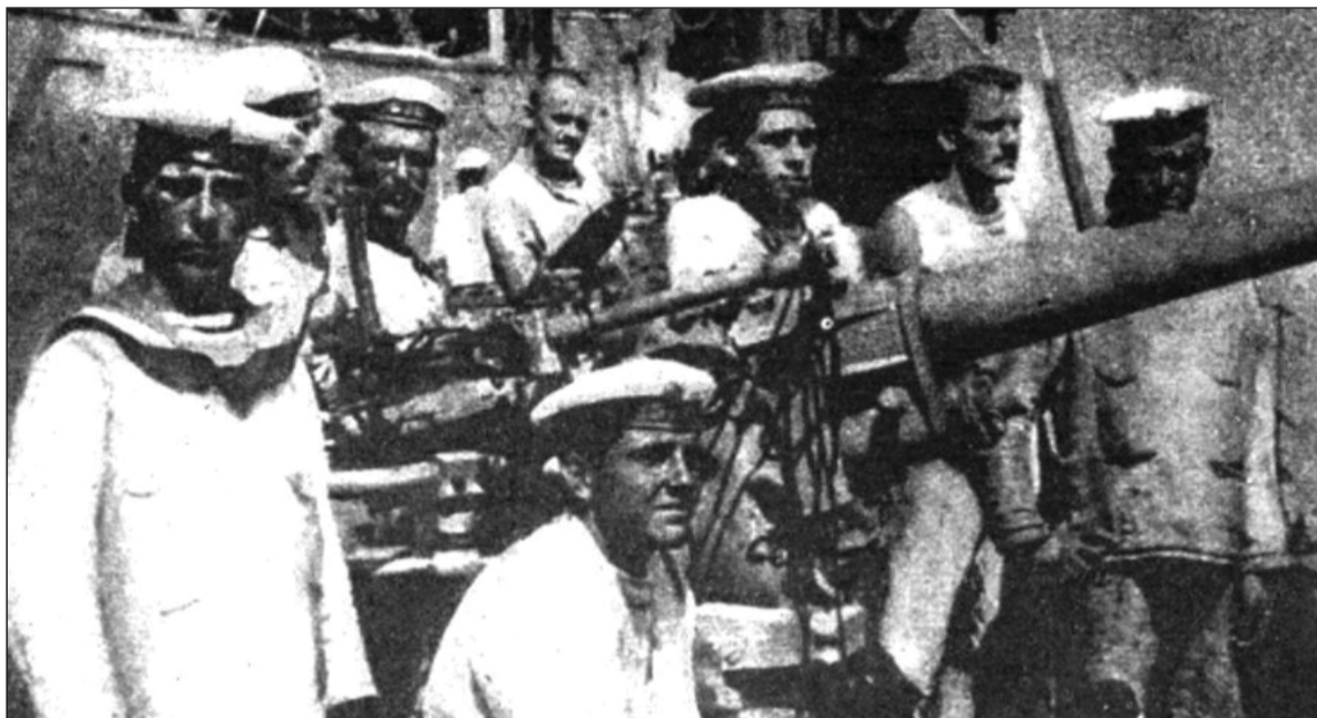
Vojnovými neúspechmi a hladom demoralizovaní námorníci rakúsko-uhorského vojenského loďstva sa prvého februára 1918 v čiernohorskej Kotorskej boke postavili na ozbrojený odpor svojmu veleniu.

Už v noci rakúsko-uhorské armádne velenie sťahovalo do priestoru vojenské posily a pobrežné pevnosti dostali úlohu nasmerovať všetky zbraňové systémy na lode, ktoré sa zapojili do vzbury, a v prípade akéhokoľvek pohybu potopiť ich. Veli-