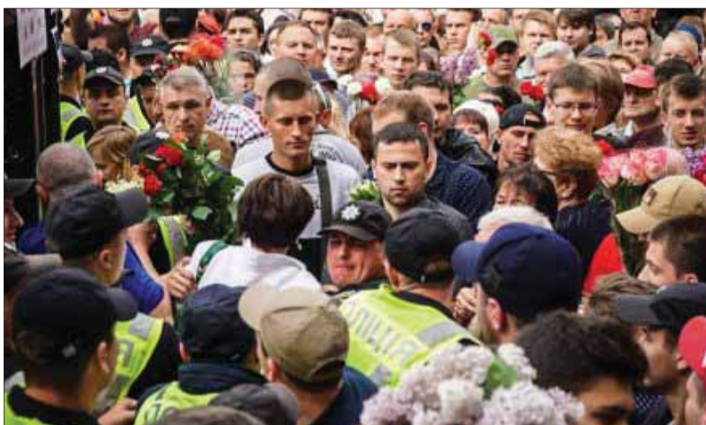
Ukrajina prežíva schizofrenickú súčasnosť plnú drám a spoločenského nepokoja

Pomajdanská Ukrajina v úsilí čo najviac sa vzdialiť od nenávideného Ruska začala prijímať rôzne, viac či menej produktívne opatrenia sledujúce tento cieľ. Popri Jaceňukovom plote na hranici nová moc začala obmedzovať ruské televízne vysielanie, zakazovať ruské filmy, čiže obmedzovať používanie ruštiny vo verejnom priestore, ako aj pracovať na posilnení postavenia ukrajinského jazyka. Nová Ukrajina zakázala komunistickú stranu a propagáciu komunistického symboliky. V roku 2015 Verchovna rada Ukrajiny schválila