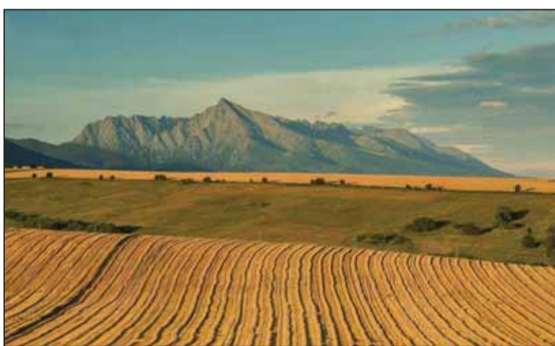
Politická opozícia na Slovensku sa v pachtení po moci usiluje spojiť nespojiteľné – zavraždenie mladého novinára dáva do súvisu s nedostatkami, o ktorých písal a kde sa často spomínali aj nedostatky v agrosektore, za čo obviňuje kdekoho, aktuálne ministerku Gabrielu MATEČNÚ.

Opozícia si pseudopričin na odvolanie ministerky zhromaždila nadostač. Medzi nimi aj tvrdenie, že ako ministerka zastupuje skôr oligarchov ako skutočných roľníkov, pričom svojím konaním ohrozuje budúce zdroje pre Slovensko na