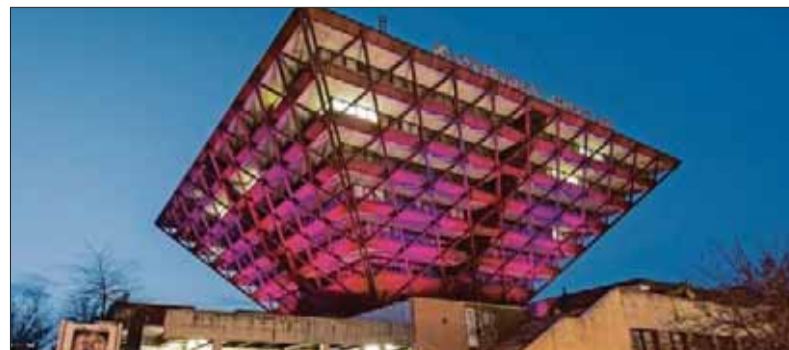
Budova Slovenského rozhlasu v Bratislave púta svojou unikátnou architektúrou, „architektúra“ vysielania sa však mnohým koncesionárom vidí postavená na hlavu.

monitoringy televízneho vysielania, ako aj monitoring vysielania na základe sťažností. Plánované monitoringy však súviseli s voľbami do orgánov samosprávnych krajov. Podľa toho, koľko len občianskych vyhlásení sa objavilo na verejnosti pre nespokojnosť so stavom vysielania vo verejnoprávnom telerozhlasu, by sa dalo očakávať, že RVR mala plné ruky práce. Ale na stave vysielania sa v podstate dosiaľ nič prevratné nezmenilo. Ako aj, keď najčastejšou vetou správy je konštatovanie: „RVR nenašla dôvody na začatie správneho konania a sťažnosť posúdila ako neopodstatnenú.“ Takto RVR reagovala na množstvo námietok, že RTVS nezabezpečila objektivitu a názorovú vyváženosť tak v niektorých spravodajských príspevkoch, ako