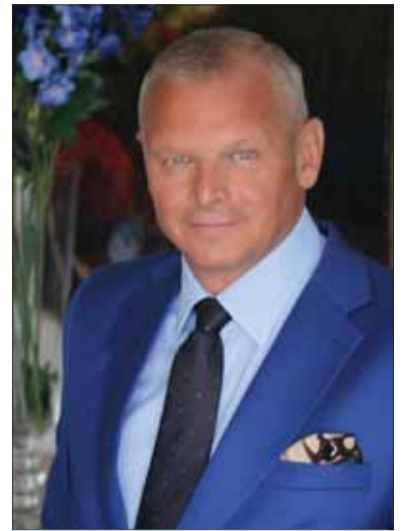
Po úspešnej kariére v prezidentskom tíme aj vo vedení popredných peňažných ústavov mnohí Slováci kandidujú na post hlavy štátu uvítali; mainstream bol proti...

Som poctený, že nebohý prezident Michal Kováč sa o mne vyjadril týmito slovami. Vážim si, že som mal možnosť kráčať vedľa neho počas jeho prezidentského a štátno-