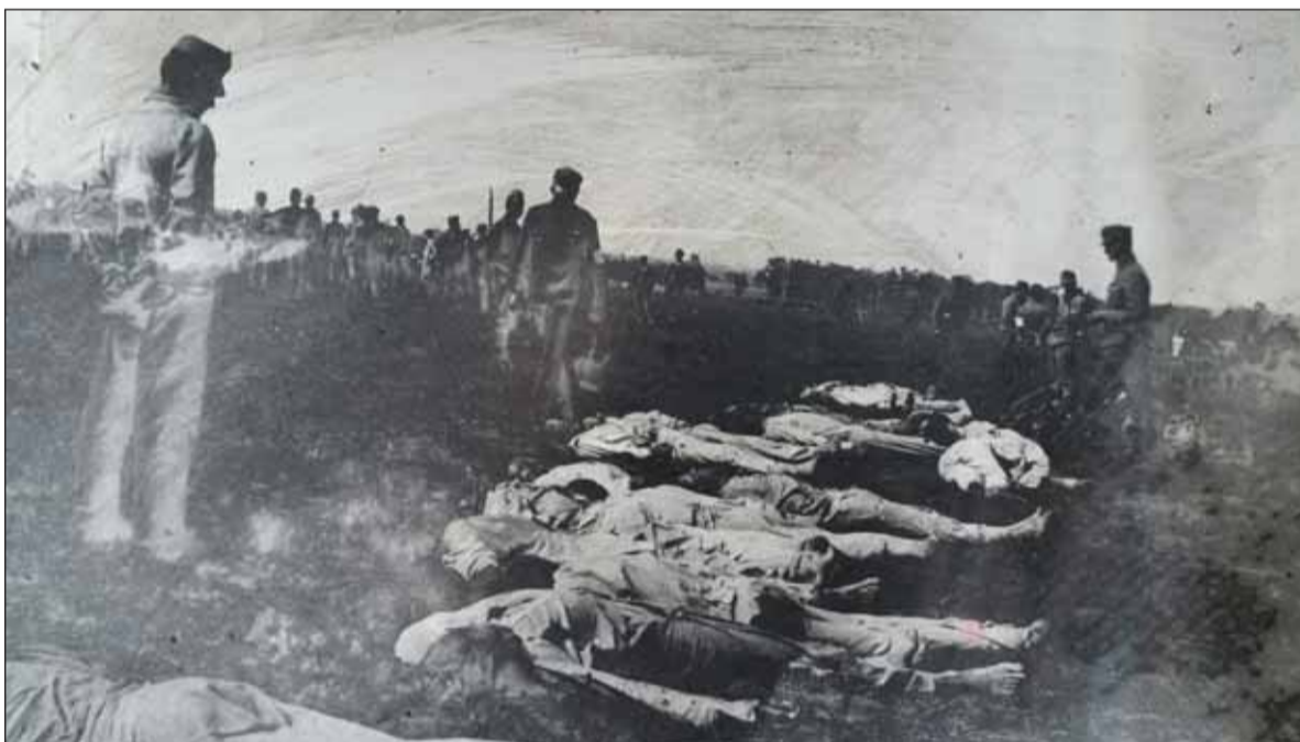
V srbskom Kragujevci popravili po vzbure zo začiatku júna 1918 štyridsiatich štyroch vojakov 71. pešieho, tzv. Trenčianskeho pluku. Na snímke postrieľaní vzbúrení.

tel základne Gussek dal vzbúrencom ultimátum. Kontraadmirál Hansa ho však presvedčil, aby sa nenáhlil a aby zabránili masovému krviprelievaniu. Napriek tomu, keď sa k vzbúrencom pripojila obrnená loď Rudolf, dal na ňu vypáliť niekoľko striel a torpéd. Medzitým vplávali do Kotorskej boky z otvoreného mora ďalšie bojové lode s namierenými hlavňami kanónov na vzbúrené plavidlá. Na druhý deň sa vzbúrení vzdali, jednej skupine organizátorov sa podarilo hydroplánom odletieť do Talianska, vyše osemsto námorníkov zatkli, 432 odsúdili na dlhoročné väzenia – tých všetkých zachránil iba koniec vojny. Štyroch organizátorov zastrelili 11. februára 1918 pri cintorínskom múre v čiernohorskom meste Skaljari.