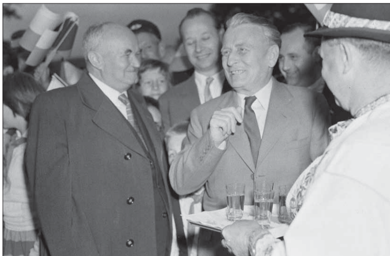
Karel BACÍLEK (vľavo na snímke s prezidentom Antonínom Novotným) bol tragikomickou figúrkou komunistického papaláškeho vládnutia

Karolovi Šmidkemmu, vedúcemu príprav SNP za komunistov, pridala strana ako radistu Čecha Karla Bacílka, v tom čase ukrytého v Moskve. Mal udržiavať spojenie Šmidkeho s velením sovietskych vojsk. Keď ho nad územím Poľska zhodili s vysielacou, zakopal ju na mieste zoskoku – a viac ju nenašiel. Po niekoľkých týždňoch dovandroval z Poľska na Slovensko a Slovenská národná rada mu musela nájsť novú vysielaciu. Bacílek však ani teraz spojenie nezabezpečil, lebo medzitým zabudol, na keď ho nad územím Poľska zhodili s vysielacou, zakopal ju na mieste zoskoku – a viac ju nenašiel. Po niekoľkých týždňoch dovandroval z Poľska na Slovensko a Slovenská národná rada mu musela nájsť novú vysielaciu. Bacílek však ani teraz spojenie nezabezpečil, lebo medzitým zabudol, na keď ho nad územím Poľska zhodili s vysielacou, zakopal ju na mieste zoskoku – a viac ju nenašiel.