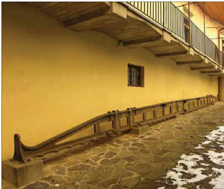
Skúšobný diel Sečéného reťazového mosta v Budapešti je uložený v areáli hradu Krásna Hôrka

kach dala tavením získať železná huba, z ktorej sa ručným kovaním stalo kujné železo, začali sa stavať výkonnejšie, takzvané slovenské pece. A po nich prišli na rad pilierové vysoké pece. Kým pri prvej technológii bolo možné získať kilogramy železa, pri ďalších už stovky a tisícky ton železa.