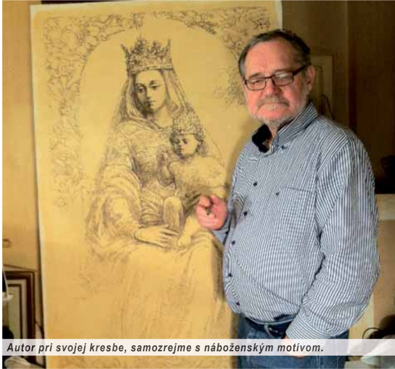
Autor pri svojej kresbe, samozrejme s náboženským motívom.

Keď som bol malý, vstával som na svitaní, keď všetci ešte spali, a hrával som sa v našej „Pálfiovej záhrade“. Pozoroval som rastliny, príchod dňa a požehnanie, kde je postavený náš dom, a v tej izbe, ktorá dodnes jestvuje. A druhá vec, ktorá ma nesmierne zaujímala, bol čas. Totiž ten fakt, že som sa nenarodil