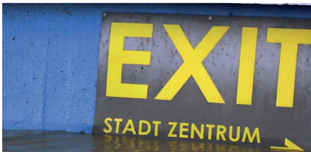
Východ z mesta...