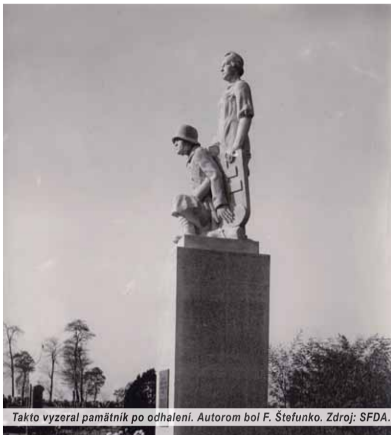
Takto vyzeral pamätník po odhalení. Autorom bol F. Štefunko.

Všetci si toto miesto pamätáme tak, že na hrobch rástol orgován zmiešaný s trávou. Obraz sa zmenil určite na lepší. Skutočne je to dôstojné, výtvorne a esteticky zladené miesto s výborne