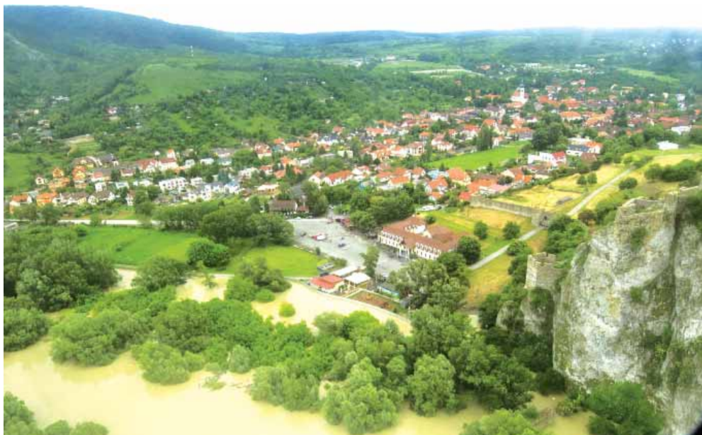
Monitorovací let Dunaja a Moravy 4. júna 2013. Na snímke podhradie Devína.