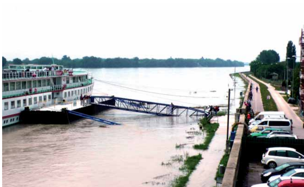
Uviaznutá výletná loď, ktorá neplánovane zakotvila v Komárne 6. júna 2013.