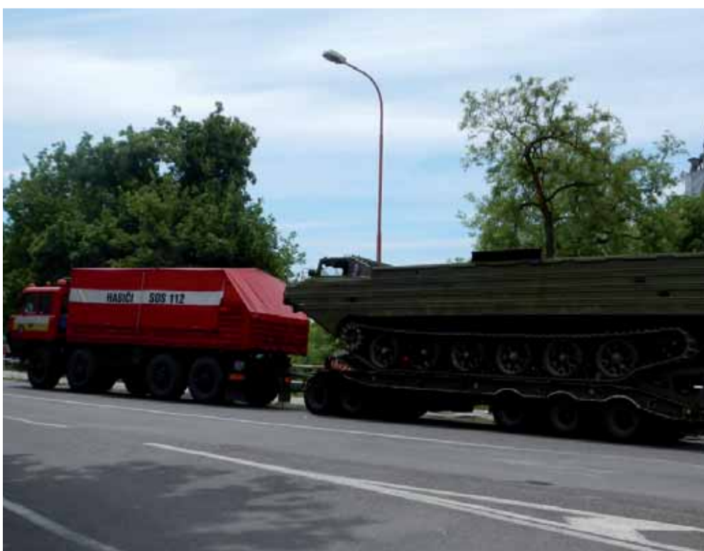
Záchranárske zložky boli pripravené aj na preliatie mobilných hrádzi.