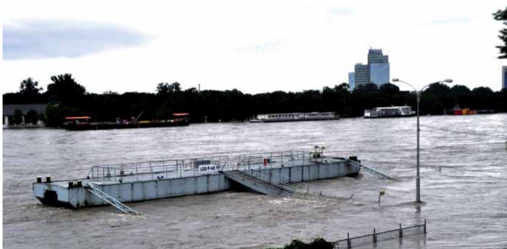
Voda ohrozovala bežný život v hlavnom meste Slovenska niekoľko dní.