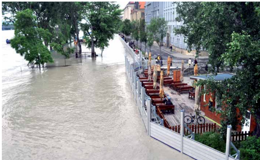
Bratislavu pred katastrofou zachránili mobilné zábrany.