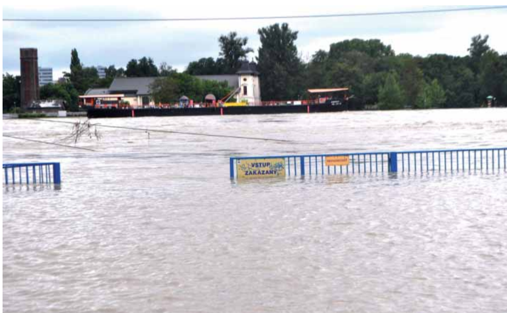
Aj napriek veľkej snahe voda napáchala obrovské škody.