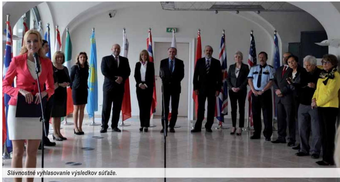
Slávnostné vyhlasovanie výsledkov súťaže.

Projekty, ktoré podporujú odmietavý postoj mladých ľudí k drogám, ako aj k ďalším závislostiam, nabúdajú práve v dnešných časoch čoraz väčšiu dôležitosť. Je ideálne, ak sa protidrogová osveta spája s tvorivosťou. Výtvarná súťaž pre mladých ľudí Prečo som na svete rád/rada už takmer dvadsať rokov nabáda mládež, pedagógov, ale aj množstvo návštevníkov výstav na zamyslenie sa nad tým, ako eliminovať novodobú epidémiu drogových závislostí a dať prednosť zdravému životnému štýlu.