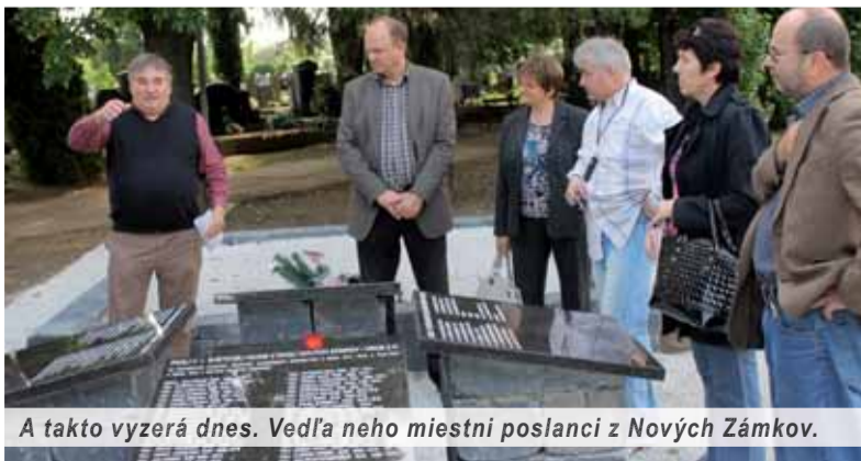
A takto vyzera dnes. Vedľa neho miestni poslanci z Nových Zámkov.

Predtým však na základe žiadosti SHO bolo v odborných komisiách pri MsZ i v mestskej rade a v mestskom zastupiteľstve schválené postavenie súsošia padlým legionárom. Keďže občania maďarskej národnosti spísali proti pamätníku petíciu, napriek schváleniu v zastupiteľstve primátor uznesenie nepodpísal. Mesto bolo rozdelené na dva tábory. Problémom bola aj vysoká cena pamätníka. Aby sa vášne upokojili, zvolil sa lacnejší variant – tabuľa. Ale aj jej história je zahmlená.