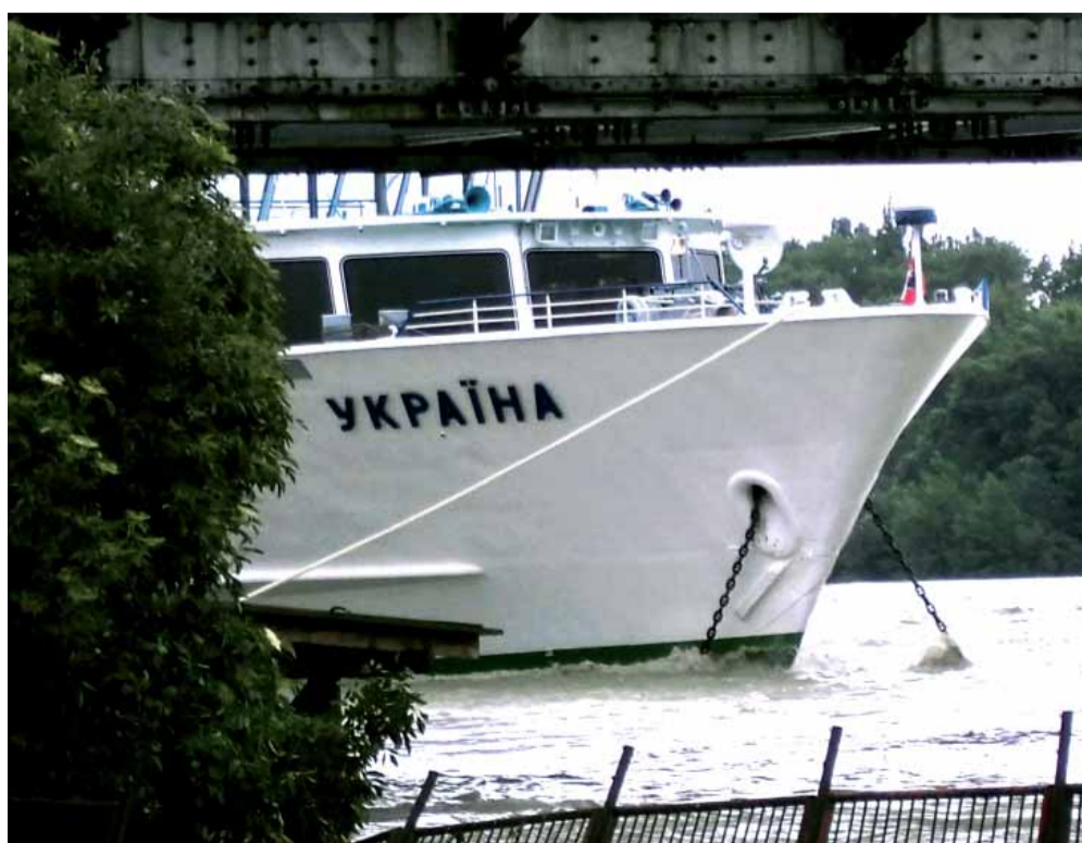
Loď Ukrajina sa nevmestila pod jeden z bratislavských mostov.