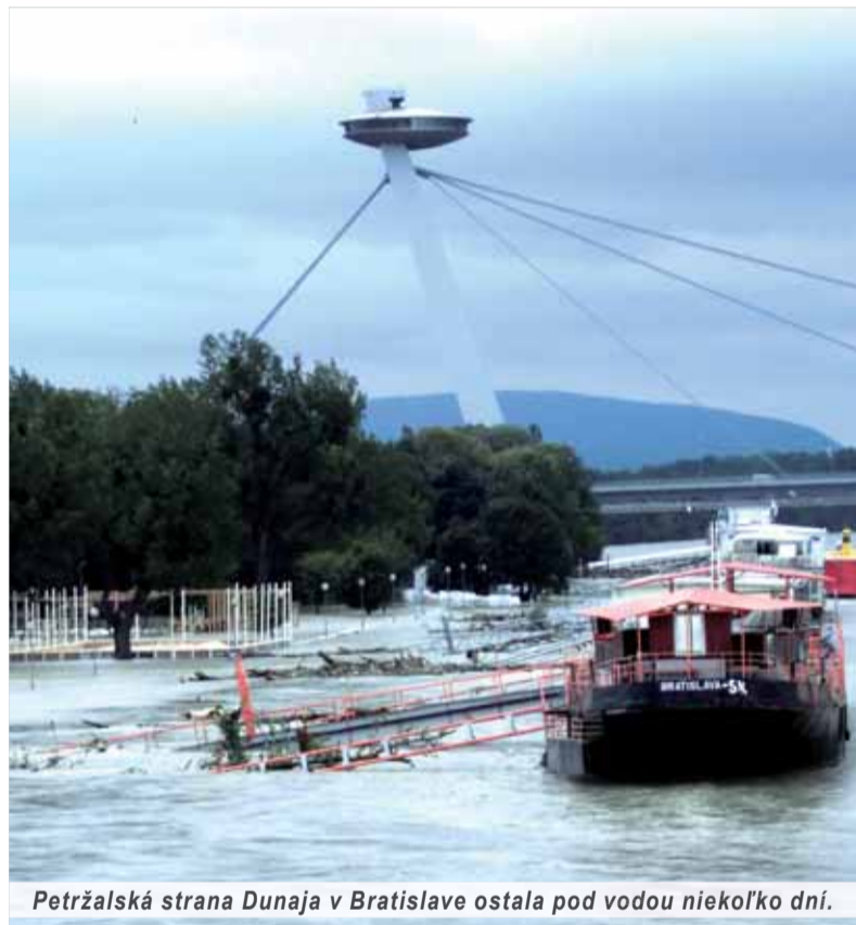
Petržalská strana Dunaja v Bratislave ostala pod vodou niekoľko dní.