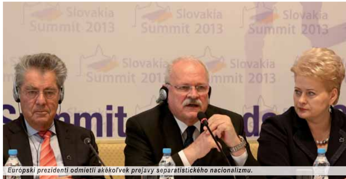
Európski prezidenti odmietli akékoľvek prejavy separatistického nacionalizmu.

Ako potichu sa začala, tak potichu sa skončila. Konferencia dvadsiatich hláv európskych štátov v Bratislave naše médiá príliš nezaujala. To je dôkaz, že bola možno úspešnejšia, ako by sa mnohým u nás páčilo. Navyše potvrdila správny kurz slovenskej diplomacie v otázke Kosova.