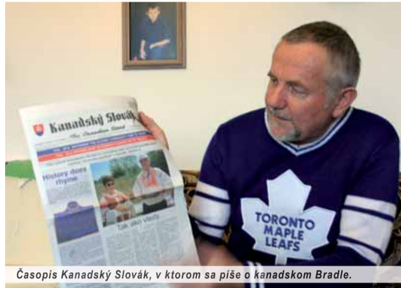
Časopis Kanadský Slovák, v ktorom sa píše o kanadskom Bradle.