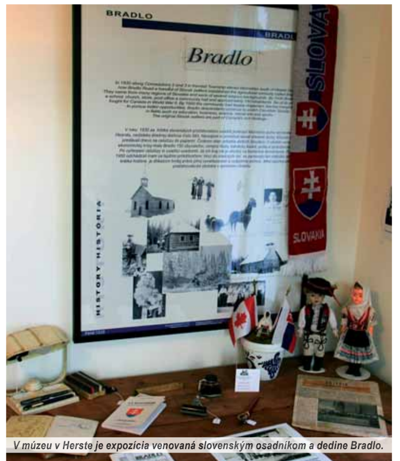
V múzeu v Hearste je expozícia venovaná slovenským osadníkom a dedine Bradlo.