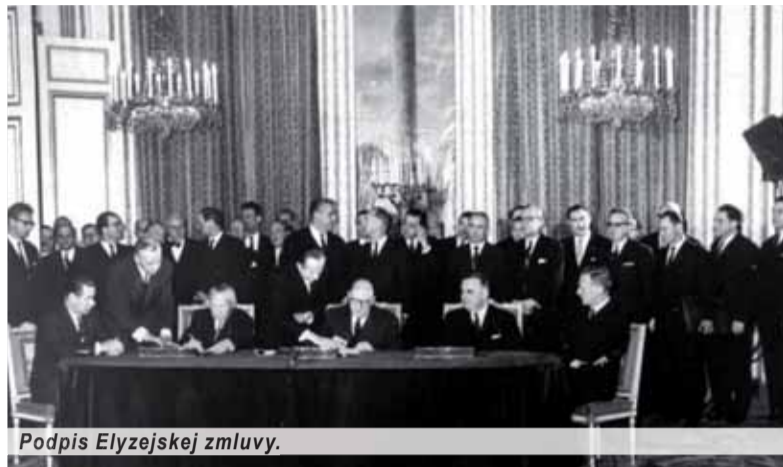
Podpis Elyzejskej zmluvy.

Ako konkrétne vidí toto výročie slovenská diplomacia, slovenská vláda dnes, to vyplýva zo slov štátneho tajomníka Ministerstva zahraničných vecí a európskych záležitostí SR Pet-