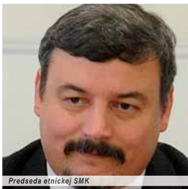
Predseda etnickej SMK

Strana maďarskej komunity (SMK) otvorene hlása, že chce v nadchádzajúcich novembrových komunálnych voľbách mať v čo najväčšom počte obcí na južnom Slovensku starostov maďarskej národnosti. „Aplikovanie dvojazyčnosti, fungovanie maďarských inštitúcií vieme zabezpečiť najskôr prostredníctvom nich,“ zhodla sa Republiková rada SMK na rokovaní v Bratislave.