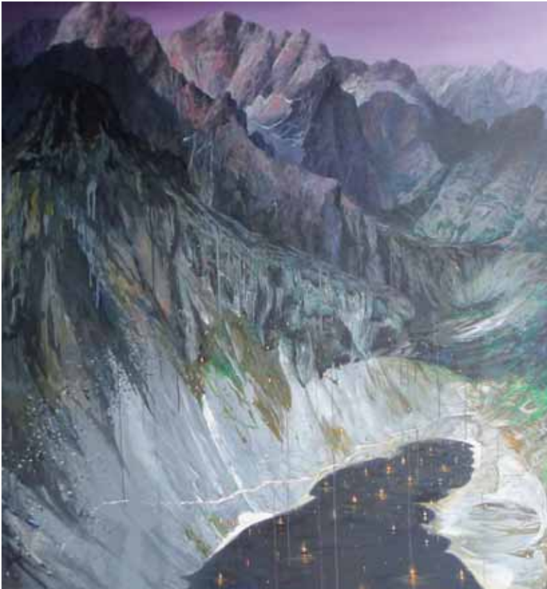
Originálne dielo R. BIELIKA inšpirované Vysokými Tatrami.

Už dvanásť rokov pôsobí v magickom prostredí starého Kežmarku Galéria u Anjela. Budova galérie je zasadená do zachovalej architektúry ulice Starý trh na ceste ku Kežmarskému hradu. Zázitok z návštevy je ozaj mimoriadny, nehovoriac o prenikavom pocite panorámy Vysokých Tatier z Kežmarku. Prívržencov a nadšencov z radov slovenských priateľov umenia si získava aj svojím jednoznačne sebavedomým cieľom – byť modernou galériou umenia európskeho formátu.