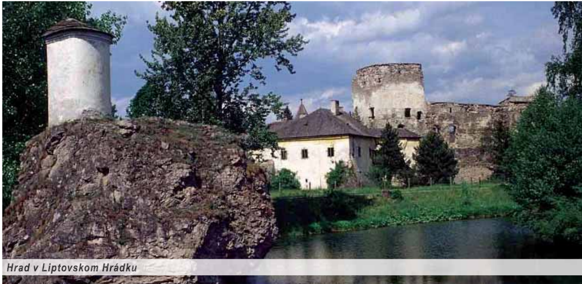
Hrad v Liptovskom Hrádku