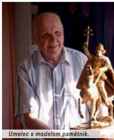
Umelec s modelom pamätníka.

Zvlášť však zažiaril v textilnej tvorbe na báze aplikácií, v artproteise a najmä v nebyvalých veľkorozmerných textilných realizáciách v gobeline viacerými monumentálnymi dielami k podnetom Veľkej Moravy a odkazu cyrilo-metodskej byzantskej misie. Od polovice šesťdesiatych rokov sa zanielene venoval a rozpracoval ikonografický kánon a podoby zobrazenia a vytvoril aj vzácny súbor symbolických portrétov a námětových dejinných sekvencií z úsvitu slovenských a slovanských dejín na našom území, ktoré znamenajú kolísku a zrod našej národnej kultúry a vzdelanosti, ale aj cirkevných dejín Slovanov a kresťanstva. Ako známa výtvarná osobnosť a odborník na toto obdobie