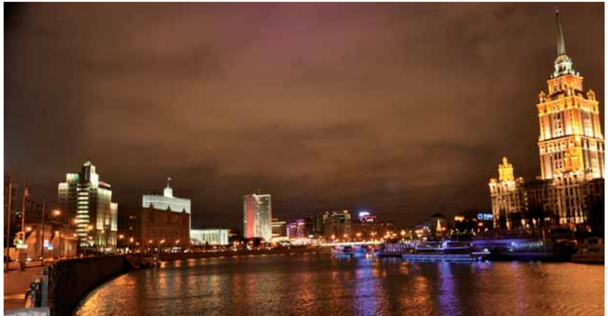
Aj panoráma starej Moskvy dostáva v posledných rokoch novú tvár.

Hotel mi poskytuje členstvo v klube – potom nemusím odísť napoludnie, ale až