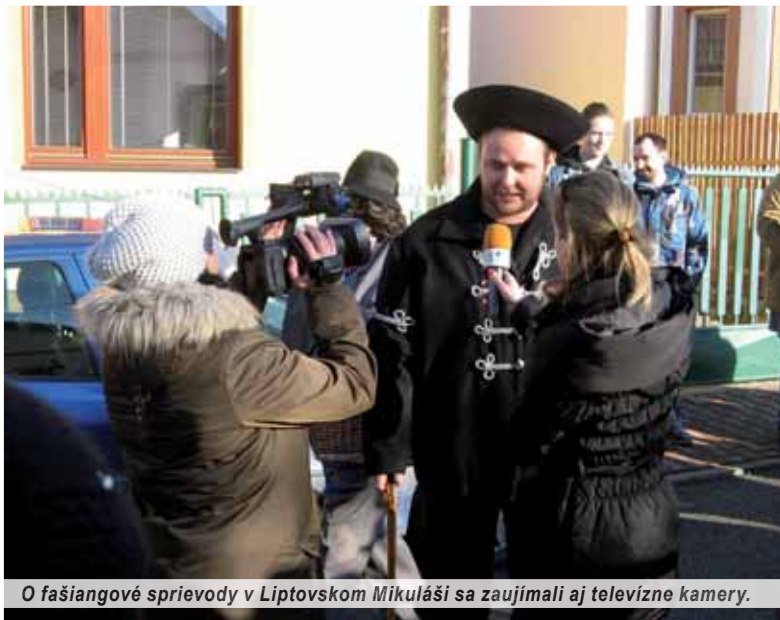
O fašiangové sprievody v Liptovskom Mikuláši sa zaujímali aj televízne kamery.

Liptov je známy tým, že sa tu uchovávali staré zvyky a obyčaje. V poslednom období sa zvyky našich predkov udomácnujú aj v liptovských mestách. Príkladom je Liptovský Mikuláš, kde sa už tradične v mestských častiach konajú fašiangové sprievody a tzv. „bursovanie“. Mladí matičiari sa chopili iniciatívy a usporiadali už tretie fašiangy v mestskej časti Palúdzka. Tento rok im na pomoc prišli aj miestni seniori z tamojšieho klubu seniorov Palúdzka.