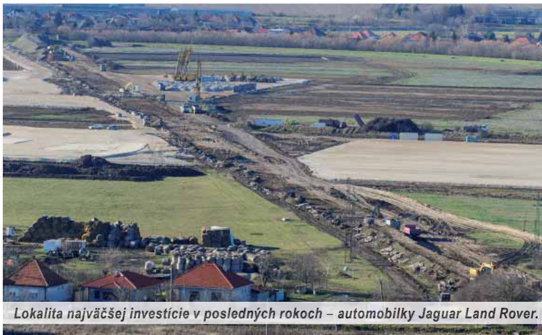
Lokalita najväčšej investície v posledných rokoch – automobilky Jaguar Land Rover.

Na Slovensku už teraz pracuje množstvo občanov Maďarska, ich priemerný zárobok, ktorý dostanú u nás, je asi o stošesťdesiat eur vyšší ako porovnateľný na podobnej pozícii