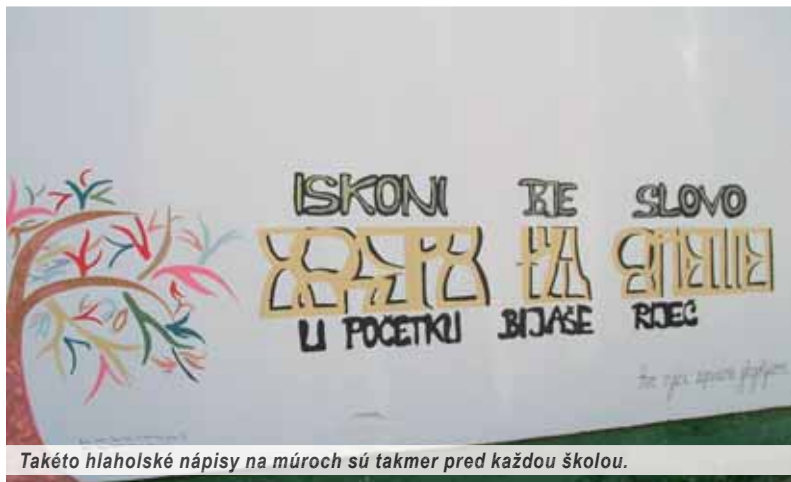
Takéto hlaholské nápisy na múroch sú takmer pred každou školou.

Práve v Jurandvore objavili aj Bašskú dosku (Baščanska ploča). Ide o jednu z vôbec najstarších písomných pamiatok, čo sú do kameňa vytesané texty v chorvátskej hlaholike. Bašská doska pochádza z roku 1089 a jej rozmery sú 197 krát 99 centimetrov. Do dosky je v hlaholike vytesaný text dokumentu, ktorým chorvátsky kráľ Zvonimir