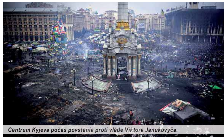
Centrum Kyjeva počas povstania proti vláde Viktora Janukovyča.

ravo, vrátane väzenia, vo februári 2014 poslal od kormidla zvrhnutý prezident Janukovyč. Napokon do novej ukrajinskej mocenskej štruktúry nepasovala ani po februárovom majdane 2014. „Majdan“ nielen zmenil pomer síl, ale aj de facto