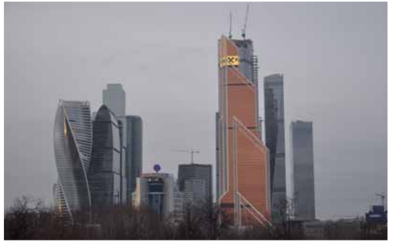
Panoráma súčasnej Moskvy dominujú mrakodrapy zahraničných spoločností.