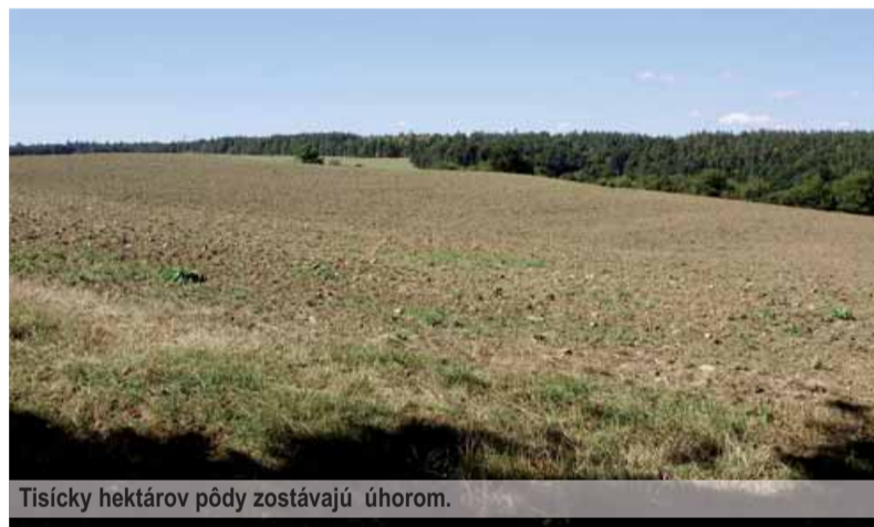
Tisíciky hektárov pôdy zostávajú úhorom.

Keď sa naši ministri alebo premiérka vyberú do Bruselu, čo tam vlastne robia? Ako obhajujú naozaj existenciu záujmy Slovenska? Dajú prednosť atraktívnej fotografii s pani Merkelovou pred neprijemnými rokovania- mi a predkladajú námietky? A akou mierou poznania je vybavená veselá novinárska družina, tvoriaca pomerne často sprievod