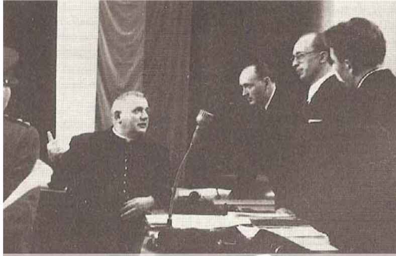
Prezident Dr. J. Tiso so svojimi advokátmi na súde. Súd ho poslal na šibenicu.

Udalosti po novembri 1989 prispeli k tomu, že po dvadsaťročnom novinárskom dištanci ma vtedajší, takpovediac umiernení komunistickí novinári, pracujúci v normalizačnom období, vyzvali, aby som pomohol zrehabilitovať 356 politicky i materiálne zdeptaných „dubčekovských“ novinárov. Novinárska rehabilitácia spočívala iba v tom, že sa im vrátili novinárske preukazy. Akékoľvek finančné odškodnenie za dvadsaťročné politické i materiálne bezprávie sa odmietlo. Zopár novinárov sa vrátilo do pôvodných redakcií, ale väčšina sa pre vek do redakcií nevrátila.