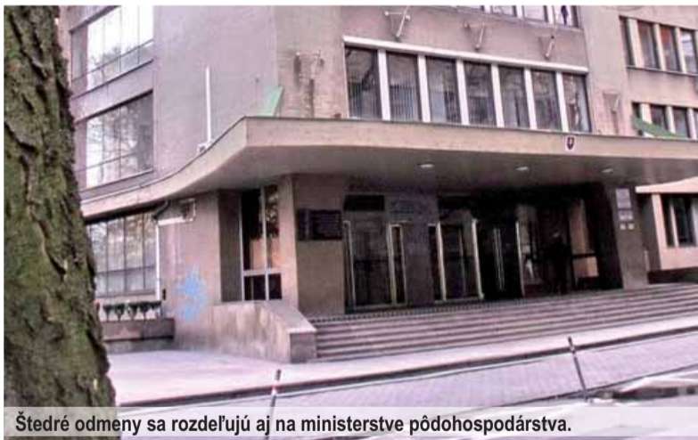
Štedré odmeny sa rozdeľujú aj na ministerstve pôdohospodárstva.

BRATISLAVA (Ivan BROŽÍK) – Úradníkom na ministerstvách porozdeľovali odmeny, o akých sa bežným občanom môže iba snívať, a šéfovia rezortov sa pobrali loviť do terénu volebné ovečky. Už mesiace tento štát nikto neriadi, nikto tu nevládne. Skutočné ovce zo salašov pritom miznú, chov dobytky je zdecimovaný, rastlinná výroba dožíva na celoplošnom siatí repky. Slovenskému poľnohospodárstvu veľmi málo pomôžu chabé výzvy – „kupujte slovenské výrobky“.