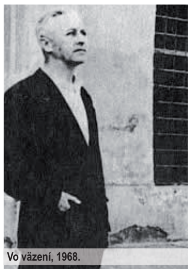
Vo väzení, 1968.

Za celý čas autonómie sme nemohli dostať do slovenských rúk ani jednu jedinou posádku, ani jediné