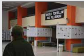
Celé týždne visel v aule Paneurópskej univerzity na Tematinskej ulici transparent Radšej tortellini ako Pellegrini...

Zmenilo sa čosi od antiky? Starí stále majú z mladých tiky... Keď na Tematinskej ulici v zhluku petržalských bytoviek, nežne premenovaných na „králikárny“, uskakujem pred drahými autiakmi zvučných značiek, ktorými sa zväžajú na zaplatené prednášky a semináre poslucháči Paneurópskej univerzity – budúci masmediálni čaro-dejníci a žúr-nalisti –, čo budú, súc vyškolení na potreby dneška a propagandy svojimi docentmi a profesormi, informovať o svete a formovať verejnú mienku – prídu mi zavše na myseľ i na jazyk kadejaké hanlivé slová aj antické citáty. Veď sa mi, ale aj matkám s kočíkmi, už viackrát podarilo uskočiť pred parádnyimi limuzinami v poslednej chvíli... Bývam v tejto časti hlavného mesta, a ak by som vedel kde, už by som tam napísal alebo zatelefonoval, aby na tú úzku hradskú pomedzi bloky, ktorú si elitní študenti a ešte elitnejší „dialkari“ (ale tí iba v sobotu) myli s pretekárskou dráhou, namontovali dajaké retardéry. Je to síce nesprávne – oficiálne je to spomalovací prah – ale vo vzťahu aj k tým „fitipaldiovcom“ za volantom dosť výstižné... Možno by im mohla poradiť bývalá premiérka Radičová – etička, ktorá je tam najvyššia akademická autorita, aby boli ohladuplní a autami neohrozovali peších spoluobčanov. Keď som však vlni vo vestibule tej panskej a progresívnej školy počas promócie videl jeden transparent, povedal som si, že by to bolo, ako hádzat hrach na stenu... Už teraz mám strach, čo budú písať do novin!