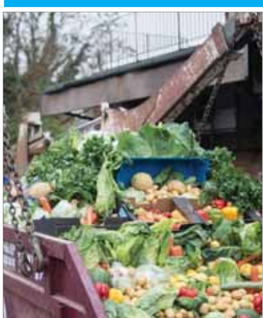
Tony potravín končia v kontajneroch.

a nespĺnením očakávaní vlastností nakúpených potravín. Vyše šesťdesiat percent odpadu z potravín v domácnostiach pritom predstavuje odpad z ovocia a zo zeleniny, významný je tiež podiel hotových jedál, výrobkov z mäsa, mlieka a cereálne produkty.