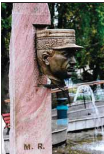
Pylón s bustou M. R. Štefánika pred Roľníckym domom v centrálnej časti humenského námestia a pôvodný vzhľad generálovoho pamätníka pred kaviarňou Štefánia...