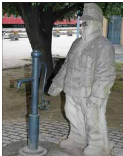
Azda najpopulárnejšou humenskou sochou zostáva Švejk pri železničnej stanici aj s „pumpou“, kde čerpal „železitú vodu“...