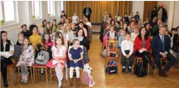
Chvilky napätia a očakávaní pred začiatkom recitačných „zápolení“ v metropolách východu – Košiciach a Prešove.

Opäť po roku sa v Košiciach a Prešove uskutočnili Krajské kolá súťaže v prednese slovenskej povesti Šaliansky Matko Jozefa Čigera Hronského. Matiční funkcionári, členovia odborných porôt aj odborníci na prednes referujú o pôsobivých vystúpeniach, skvelých prednesoch a výborných podmienkach, ktoré organizátori opäť zabezpečili a pripravili pre súťažiacich.