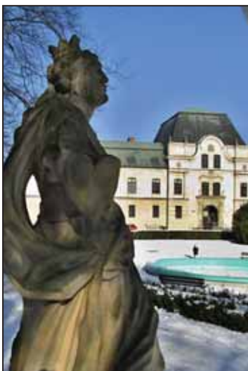
Barokové sochy v parku boli často cieľom vandalov. Zrekonštruované sú preto umiestnené v kaštieli.

Svoje o tom vie aj socha svätého Jána Nepomuckého, ktorú postupne komunisti premiestňovali z hornej časti námestia smerom dolu k malej železničnej stanici, až akýsi figliar na ňu tajne v noci zavesil kartón s nápisom: „Už ma nepresúvajte, lebo sa nahnevám a sám sa vyberiem na Valaškovce.“ Pravdepodobne súdruhovia pochopili, že to myslí vážne,