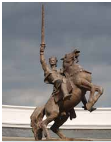
Počas vlády pravicovej koalície v rokoch 2010 – 2012 vytvorili „odbornú“ komisiu, ktorá rozhodla o odstránení nápisu z podstavca Svätoplukovej sochy na Bratislavskom hrade, na ktorom stálo, že bol kráľ starých Slovákov.