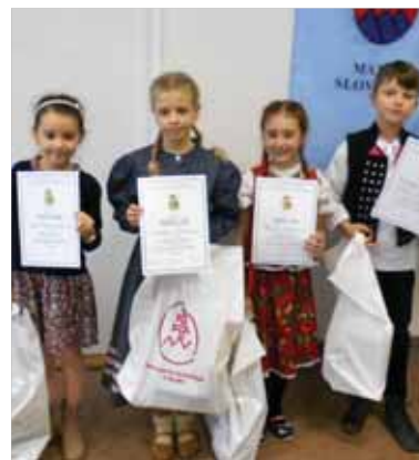
Aj títo mali drobci sa chcú podobať na Matka...