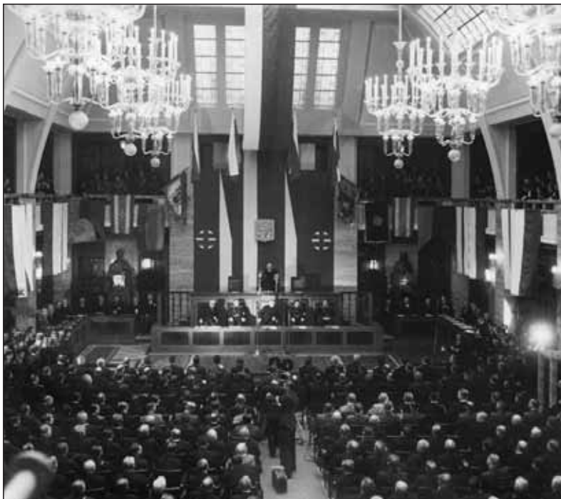
Udalosti marca roka 1939 niekoľkokrát zaplnili zvolenými poslancami rokovaciu sálu Slovenského snemu na rozhodovanie o dramatických a ďalekosiahlych národnostných otázkach, ktorých výsledkom bolo aj vyhlásenie Slovenského štátu.