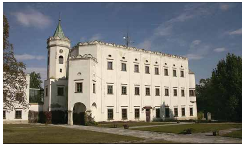
Kaštieľ v Moravoch sa vracia jeho pôvodná krása, a ako sa zdá, opäť sa sem vracia aj krása výtvarných umeleckých diel. Nie však zásluhou štátu...

Program OĽaNO neprináša nijaké konkrétne predstavy, najmä nie také, ktoré by boli inovatívne. Program sa zameriava skôr na všeobecné myšlienky, niečo, s čím súhlasí každý. Napríklad: Podporiť vstup súkromných investícií do kultúry. Zlepšiť prístup ku kultúre aj v odľahlých častiach Slovenska. Zlepšiť a zjednotiť dopravné a informačné značenie historických a turistických atrakcií, propagáciu a informovanosť o lokalitách a kultúrnych inštitúciách krajiny. Podpora obnovy a zachrany kultúrneho dedičstva pre ďalšie generácie, tým aj podpora cestovného ruchu. Odpredaj vybraných ruín kultúrneho dedičstva za