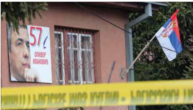
Staré krivdy v Kosove prekrývajú nové a zvyšujú etnické napätie ako po atentáte na umierneného srbského politika Olivera Ivanoviča, čím sa táto jednostranne vyhlásená albánska džava opäť premenila na sud pušného prachu...

Srbsko dlží veľkú vďaku Slovensku, Rumunsku, Cypru, Grécku a Španielsku za principiálnu ochranu medzinárodného práva. Tieto členské krajiny EÚ neuznali nezákonné vyhlásenie tzv. Kosova za samostatný a nezávislý štát.