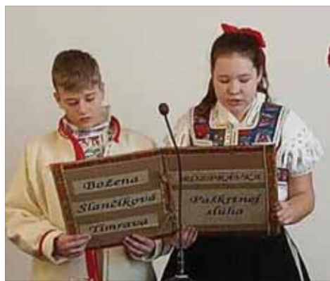
Na Dni materinského jazyka účinkovali žiaci štyroch škôl z Novohradu.