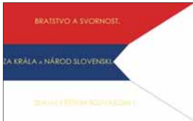
Dobrovoľnícka vlajka, pod ktorou bojovali v verušmých rokoch.