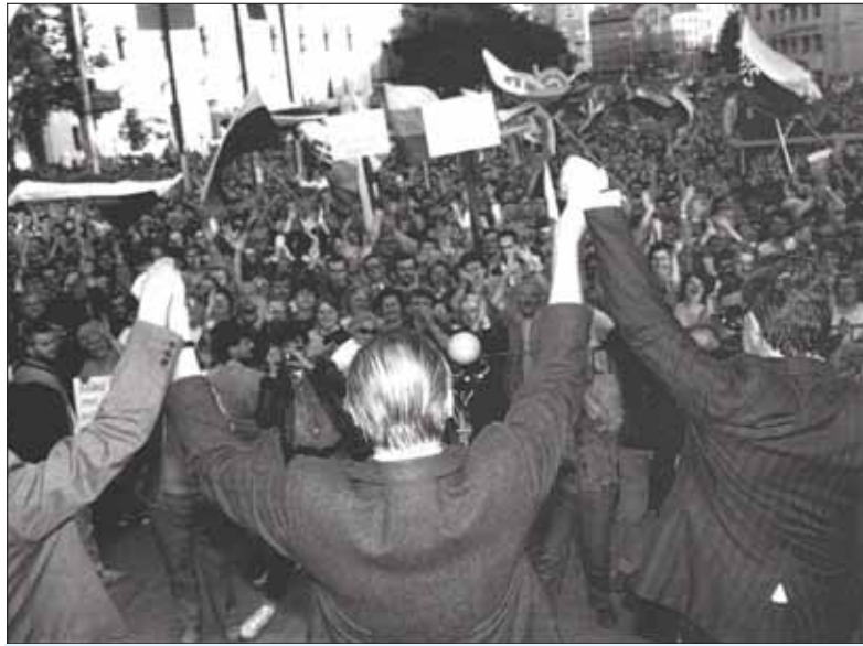
Združenie Korene spolu s inými národnými spolkami vrátane Maticy slovenskej organizovalo demonstrácie za národnú samostatnosť, na ktorých sa zúčastnili desaťtisíce podporovateľov.

Za tzv. základnú zmluvu medzi SR a MR „o dobrom susedstve a priateľskej spolupráci“ som ako jediný verejne odmietol hlasovať a nazval som ju „rozsudok smrti nad slovenským juhom“. Kiež by som nemal