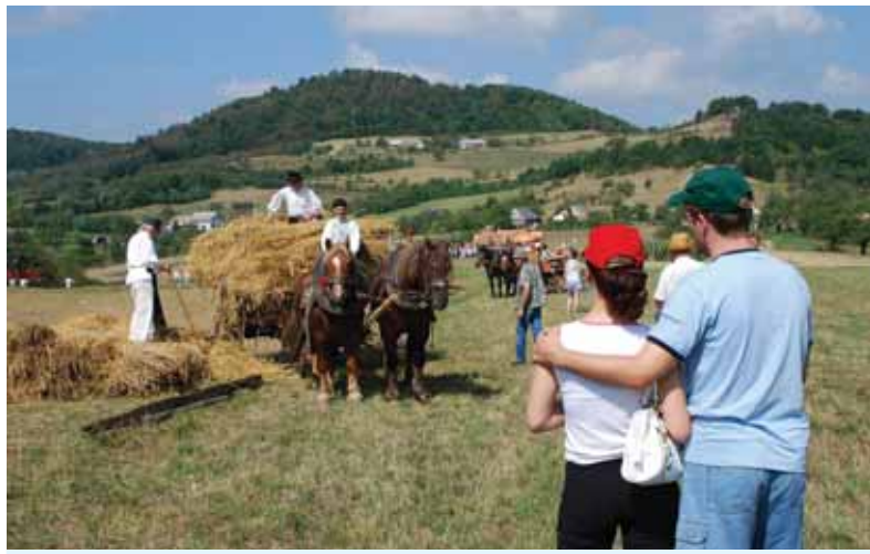
Viaceré ukážky tradičných prác sa odohrávajú na hrušovských lazoch.

remeslách, ako aj personálu vo dvoroch a v iných potrebných odvetviach podujatia.