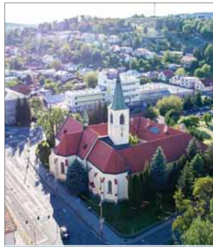
Areál spojený s činnosťou pátrov jezuitov v Humennom