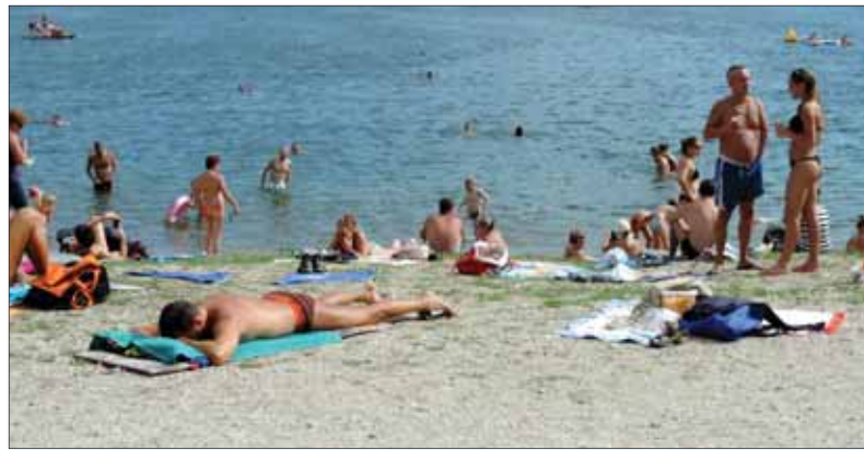
Podobný obrázok z dovolenkovej idylky si tohto roka sotva uložíme do rodinných albumov.

Cestovné kancelárie, ktoré by bez pomoci štátu v prípade vracania peňazí zo zaplatených dovoleniek mohli vo veľkom krachovať, prišli s myšlienkou tzv. výmenných voucherov, teda poukazov, ktoré by klienti mohli využiť v budúcej