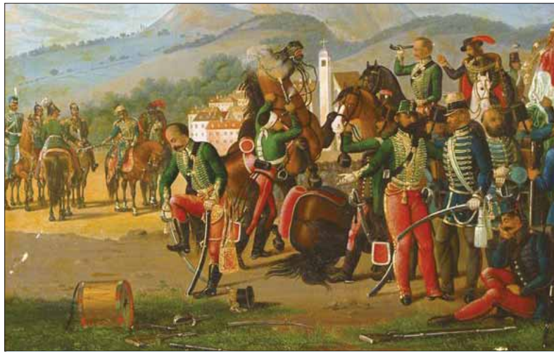
Dobový výjav z čias uhorských revolúcií 1848 – 1849, keď maďarskí honvédi a slovenskí dobrovoľníci skladajú zbraň...

Po páde Bachovho absolutizmu bol nakrátko úradníkom v Budine a bol prítomný aj pri vzniku Pešťbudinských vedomostí. V júni 1861 prichádza na národné zhromaždenie do Martina, kde sa stal zapiso-