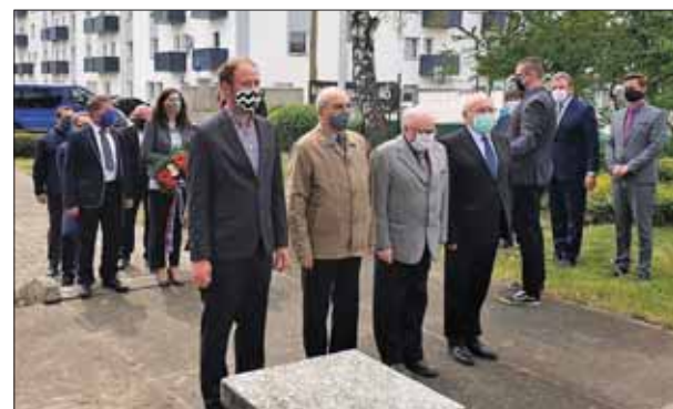
Liptovskomikulášski členovia Matice slovenskej si v minulých dňoch na viacerých miestach pripomenuli výročie Žiadostí slovenského národa.

Ani v zložitej situácii, v akej sa spoločnosť nachádza, v Liptovskom Mikuláši nezabúdajú na pripomenutie dôleži- tých historických medzníkov. Desiateho mája si v popoludňajších hodinách pripomenuli sto sedemdesiate druhé výročie vyhlásenia Žiadostí slovenského národa.