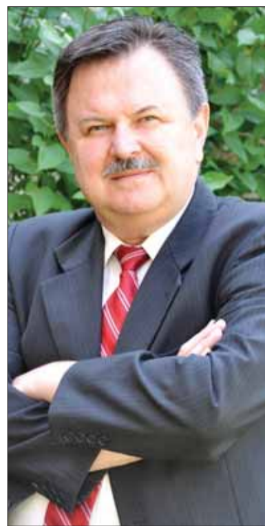
L. MOLITORIS: Situáciu v obciach pripojených k Poľsku komplikoval rad protislovenských rozhodnutí (viac aj na strane 8).

• Po druhej svetovej vojne opätovne nastala tvrdá polonizácia zo strany štátnych i cirkevných orgánov. Akú úlohu v tomto procese zohral vtedy ešte kardinál Wojtyła?