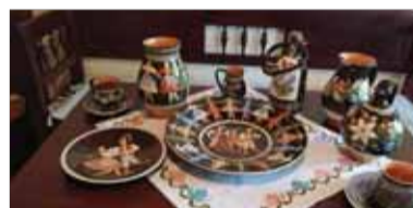
Charakteristická pozdišovská keramika