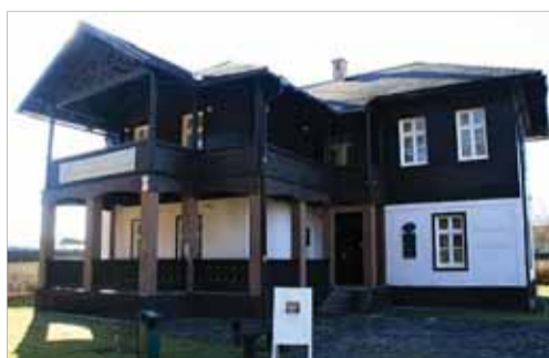
Galéria Mikuláša Galandu v Turčianskych Tepliciach

rom na prízemí mala Galandova matka krajčírsku dielňu a otec notársky úrad, Turčianska galéria upravila a v roku 1979 objekt vyhlásila za národnú kultúrnu pamiatku. Slúži ako galéria, v ktorej je vystavená časť umelcových prác. Stalo sa tak pričinením najmä manželky Mikuláša Galandu, ktorá svojho manžela prežila o štyridsať rokov. Už na prvý