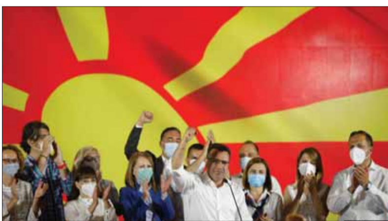
Zoran Žaev (uprostred) ohlasuje volebné víťazstvo Sociálno-demokratického zväzu Macedónska.

Aj pre pandémiu sa na hlasovaní zúčastnilo necelých päťdesiatjedem percent oprávnených voličov. Svoju vôľu tak vyjadrilo vyše deväťstotisíc občanov, ktorí si vyberali spomedzi päťnástich strán a koalícií. Hlasovanie sprevádzalo množstvo sťažností na neregularnosti, vysoký počet hlasovacích lístkov označených ako neplatných, ako aj hackerský útok, ktorý odhalil nepripravenosť štátu na podobné hrozby. Hlavný volebný duel zviadli dve najväčšie macedónske politické strany: Sociálno-demokratický zväz Macedónska Zorana Žaeva (SDSM) vo volebnej koalícii s albánskou stranou Besa a Vnútoraná macedónska revolučná organizácia – Demokratická strana macedónskej národnej jednoty (VMRO-DPMNE) Christijana Mickoského, ktorý prevzal žezlo v strane po niekoľkonásobnom premiérovi Nikolovi Gruevskom – exultantovi ukrývajúcom sa pred macedón-