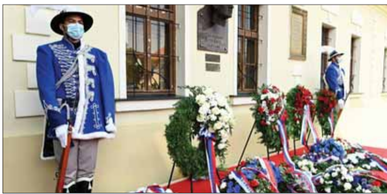
Čestná stráž pri rodnom dome M. R. Štefánika v Košariskách počas osláv 140. výročia jeho narodenia

„Nikdy sa nevzdávajte svojho práva meniť veci na lepšie, uchovajte si vôľu, zanietenie a húževnatosť, tak ako to robil