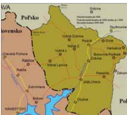
Historické mapy územia Oravy a Spiša, v ktorých pripadli slovenské obce Poľsku.

S blížiacim sa dátumom hlasovania sa situácia ešte viac komplikovala. Po dedinách sa presúvali poľskí agitátori, ale aj propoľskí Slováci, pochádzajúci podobne ako Machay zo spišských a z oravských dedín. Raz hrozili, inokedy sľubovali predstaveným obci úrady a rôzne výhody. Ľud ich častoval hanlivou prezývku „Poľštiaci“. Agitátori zne-