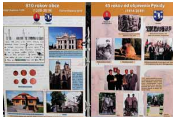
Vďaka matičiarom bude výstava Svätí sedmpočetníci dlhodobo dostupná v exteriéri areálu Farského kostola Krista Kráľa.

Sviatok svätých Cyrila a Metoda sa neviaže iba so slovenským Betlehemom – Nitrou. Cirkevné obrady, púte, ale aj rôzne iné podujatia po celom Slovensku dokazujú, v akej úcte solúnskych vierozvestcov majú Slováci. Práve okolo dátumu 5. júla sa organizujú mnohé matičné podujatia naprieč celým Slovenskom.