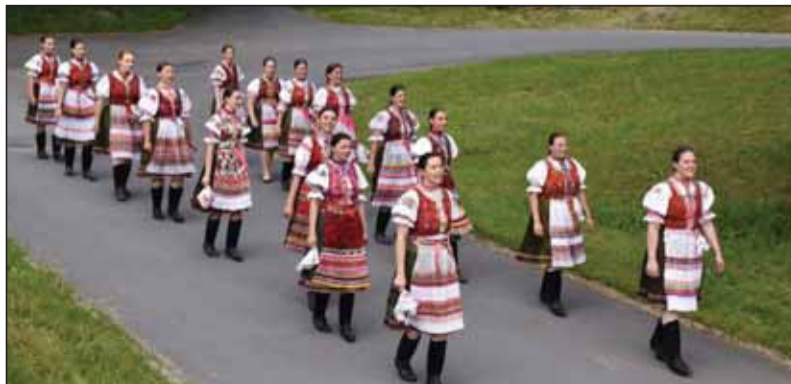
Hrušovské folkloristky zo súboru Ragačinka predvádzajú jarné chorovody, ktoré sa do pripravovanej knihy dokumentovali v týchto letných dňoch...

Rok 2020 je výrazne poznačený vplyvom koronavírusovej pandémie a s ňou súvisiacich opatrení, ktoré majú dosah na všetky sféry súkromného i verejného života. Zásahy neobišli ani kultúru a podujatia vrátane matičných sa alebo zrušili, alebo presunuli na ďalšie obdobie.