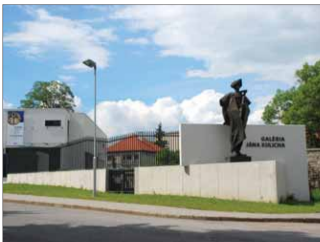
Exteriér galerijného objektu v Zvolenskej Slatine

Štvrtý okruh Z našich dejín v roku 2018 bol venovaný tým, ktorí tvorili