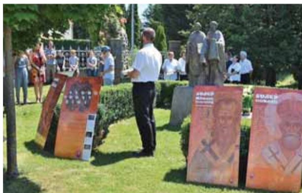
Tohtoročná slávnosť k úcte sv. Cyrila a Metoda v Čiernych Kľačanoch