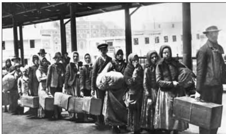
Vystáhovalci zo Slovenska na ceste za „lepším životom“ za morom

kov nadrobno rozdrvený andezitový kameň. Kúsok od neho mal odložený drevený fúrik, hrable a menšiu lopatu. Uhrin báči, chlap ostrihaný „na ježka“, s hustými fúzami pod nosom, bol našim nemčinianskym cestárom. Ako československý legionár prešiel celé Rusko, mrzol na Sibíri, praco-