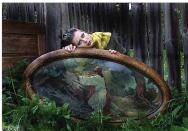
Okrem módnej a umeleckej fotografie umelkyňa inklinovala k rodinným albumom, kde ju fascinovali výrazy tváre členov jej rodiny z rôznych vetiev, a takto vidí samu seba.

Venovala som sa najmä moderovaniu na rôznych akciách. Veľa som recitovala už aj na základnej škole a spolu so sestrou sme vyhrávali rôzne recitačné súťaže. V rámci mediál-