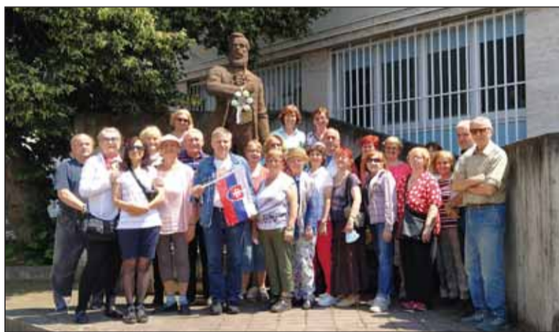
Košickí matičiari pred „zabudnutou“ Štúrovou sochou vo Veľkých Kapušanoch

Ďalším cieľom bolo Vinné. Prvá písomná zmienka pochádza z roka 1249. V obci pred Kostolom sv. Anny je busta významného Slováka Františka Jozefa Fuga, ktorý sa tu narodil. František Jozef Fuga, vlastným