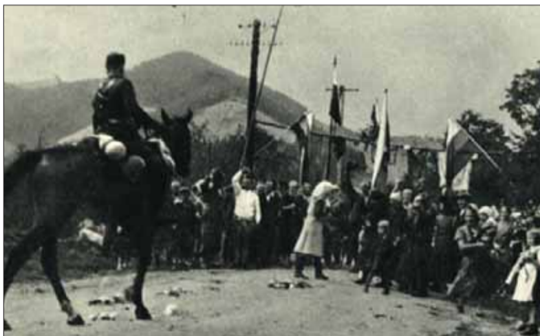
Slovenské obyvateľstvo severnej Oravy v septembri 1939 víta slovenských vojakov.