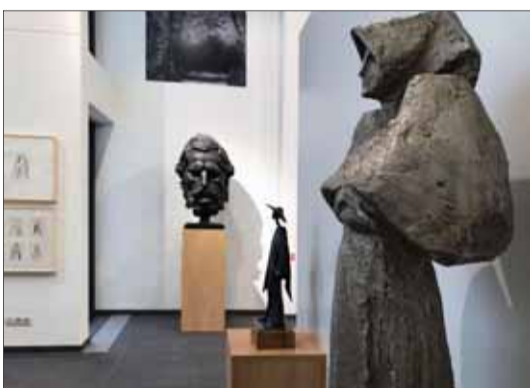
Časť expozície súčasnej výstavy majstrových diel