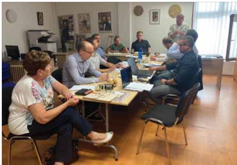
Snímka z rokovania Predsedníctva Matice slovenskej, na ktorom sa prijal program pôsobenia v dočasnej pracovnej komisii MK SR v súvislosti s navrhovanými zmenami vo financovaní ustanovizne.

Predsedníctvo MS rokovalo 21. júla 2020 v Matici slovenskej v Bratislave, kde riešilo aktuálne úlohy MS, nové návrhy na zviditeľnenie ustanovizne na verejnosti, ale hovorilo aj o súčasnej situácii v súvislosti s medializovanými zámermi Ministerstva kultúry SR (MK SR). Predsedníctvo MS odsúhlasilo účasť v dočasnej pracovnej komisii MK SR týkajúcej sa zmeny financovania ustanovizne.