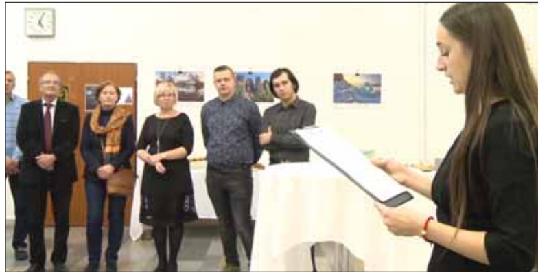
Prezentácia výstavy Objekty svetového dedičstva UNESCO v Rusku v Ruskom centre v Prešove, o ktorej informovala aj RTVS.

• Ktorého ruského autora, filozofa, básnika alebo prozai-