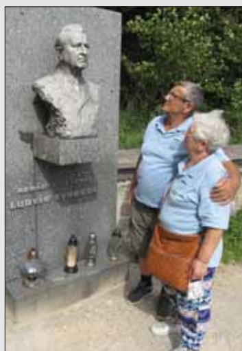
V Aleji hrdinov Dukly je aj pamätník známeho generála Ludvíka Svobodu.

Tohto roku si pripomíname sedemdesiate piate výročie ukončenia druhej svetovej vojny. Pre koronavírus sa väčšina Slovákov rozhodla prežiť letné dni doma. Samotná návšteva Vojenského historického múzea vo Svidníku upúta expozíciu, ktorá mapuje nielen druhú, ale aj prvú svetovú vojnu i činnosť légii. Exponáty vo vitrínach i vonkajšom areáli múzea ponúkajú možnosť zoznámiť sa s vojenskou technikou účastníkov vojnového konfliktu.