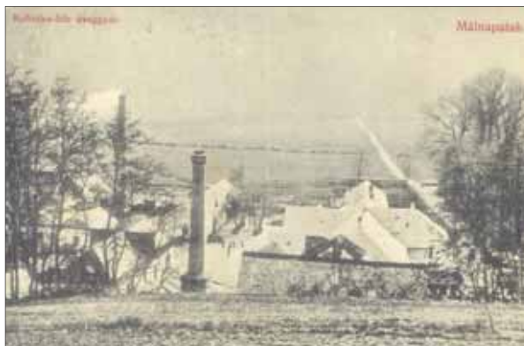
Fotografia pôvodnej fabriky v Málinci

Po dvoch rokoch živorenia a straty nádeje na znovuoživenie prevádzky rozhodli sa málinskí sklári založiť sklárske robotnícke družstvo. Podľa vypracovaného plánu sa malo vytvoriť družstvo, ktoré si prenajme sklárňu po podnikateľovi Kuchynkovi. S prácou sa malo začať prvého januára 1933. Prípravný výbor poslal vypracovaný plán úradom na schválenie. Odborníci síce uznali realnosť predložených výpočtov, ale len na tri mesiace prevádzky. Podľa