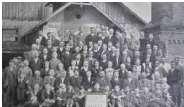
Sklárski družstevníci už fabriku raz zachránili v roku 1933. Výroba sa napokon skončila po 150 rokoch začiatkom 21. storočia po privatizácii.

ich názoru životaschopný podnik potreboval vstupný kapitál skoro dva milióny vtedajších korún československých. Prvý pokus o zmenu tak stroskotal.