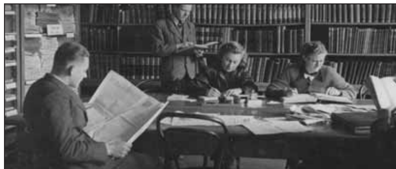
Matica slovenská desaťročia budovala knižničný fond vo svojej národnej knižnici, ale hrubým štátnym zásahom za ministrovania herca Milana Kňažka po prijatí tzv. knižničného zákona prišla nielen o knižnicu, ale aj o objekty, ktoré jej patrili. Aj preto sa súčasné matičné vedenie rozhodlo sformovať nanovo špecializovanú inštitučnú knižnicu.

Doterajšie využitie príručných knižnic vedeckých a odborných pracovísk MS nebolo postačujúce, slúžili len zamestnancom na pracovisku. V nie-