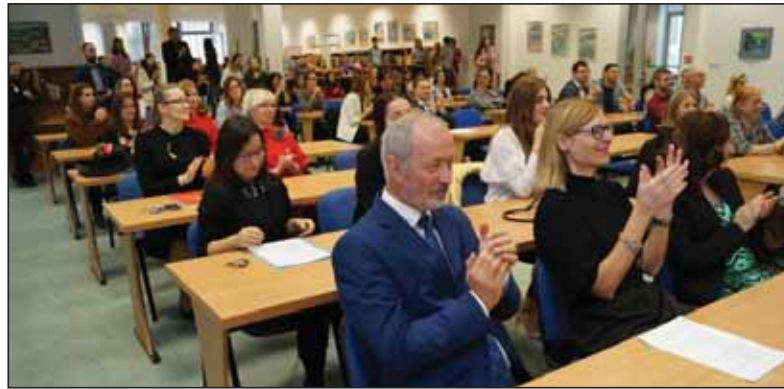
Ruské centrum v Prešove pripravuje podujatia nielen pre základné a stredné školy, ale aj pre staršie vekové kategórie.

kde som si tento jazyk zamilovala a rozhodla sa ho zdokonaľiť a prehliť na vysokej škole. V súčasnosti, keď sa viac preferuje anglofónna kultúra, určite treba zdôrazňovať slovanský kontext a slovanskú vzájomnosť, s ktorými sa neodmysliteľne spája história, bohatá kultúra a tradície Slovanov, ktoré by sme mali medzi