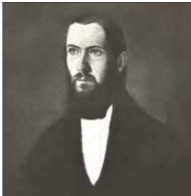
Podivinsky štúrovec v mladších rokoch svojho života

Ani cestou z Halle nemohol obísť Prahu. Zalúbenci sa stretávali v dome