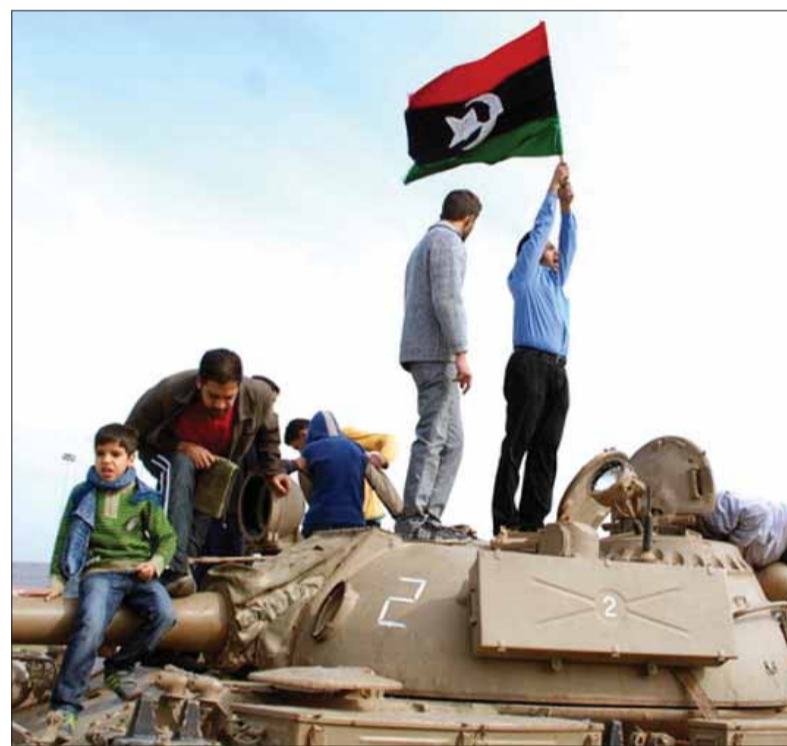
Revolúcie Arabskej jari dvíhali víťazné vlajky nielen nad domácimi autokraciami – ako to bolo aj v Líbii, ale aj nad „socialistickým“ arzenálom, ktorý ich posilňoval a bránil...

„Dom je základnou potrebou pre jednotlivca, preto by nemal byť vlastnený nikým iným.“ Aj preto veľmi štedro podporoval kúpu domu, resp. nájomné ako také