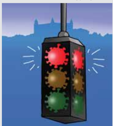
Karikatúra: Lubomír KOTRHA