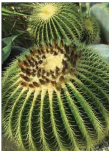
„Svokrine taburetky“ je výstavná pomenovanie tohto druhu kaktusa z jubilačnej košíckej Botanickej záhrady UPJŠ.

rastlín. Na ploche dvadsiatich štyroch hektárov sa nachádza lesná