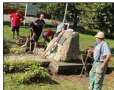
Dobrovoľníci pri úprave pamätníka

potešila informácia, že poslanci Banskobystrického samosprávneho kraja schválili projekt Miestneho odboru Matice slovenskej v Králi s názvom "Oprava pamätníka predkov Novoklenovčanov, úprava jeho okolia". A tak s finančnou podporou BSK mohli uskutočniť opravu