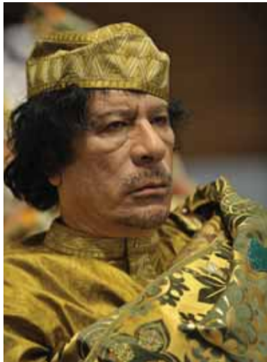
Politickému eklektikovi Muammarovi al-KADDÁFÍMU sa z historických vzorov aj z moderných politických modelov podarilo sformovať nenapodobiteľný spoločenský systém.

Spočiatku sa Kaddáfí inšpiroval Násirovou panarabskou politikou. V roku 1970 po egyptskom vzore založil politickú stranu Arabský socialistický zväz. Strana čoskoro získala značný vplyv a začala kritizovať Radu revolučného vedenia. Preto začiatkom roka 1973 Kaddáfí zavrhol parlamentnú demokraciu ako