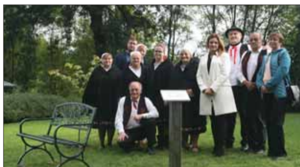
Šurianski matičiari sa tiež podieľali na dôstojnom pripomenutí jubilea svojej obce aj výročia narodenia Milana Rastislava Štefánika.

V obci Šurianky, ležiacej pri Nitre, sa rozhodli na novej pamätnej tabuli pripomenúť dve významné výročia – 75. výročie prvej písomnej zmienky obce a 140. výročie narodenia generála Milana Rastislava Štefánika.