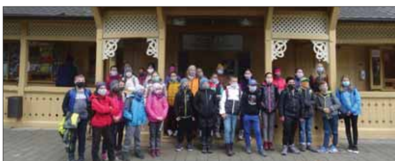
Školáci z viacerých škôl v Gemeri si v nedávnych dňoch priamo na „mieste deja“ pripomínali sto päťdesiate výročie objavenia Dobšinskej ľadovej jaskyne.

Žiaci ZŠ akad. Jura Hronca v Rožňave, ZŠ Petra Kellnera Hostinského v Gemerskej Polome a ZŠ Eugena Ruffinyho v Dobšinej navštívili Dobšinskú ľadovú jaskyňu, aby spoznali tento prírodný skvost. Hneď po vstupe ich očarila krehká krása kráľovstva večného ľadu. Na dvoch stanovištiach v jaskyni si vypočuli úryvky z brožúry, ktorá vznikla pri príležitosti sto päťdesiateho výročia objavenia Dobšinskej ľadovej jaskyne. Dozvedeli sa, ako tento unikát podzemného sveta objavil 15. júna