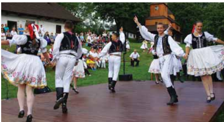
Účinkujúci na Rusínskom folklórnom festivale našli skvelú scénu pre svoje tance a spevy v areáli skanzenu Vihorlatského múzea v Humennom.