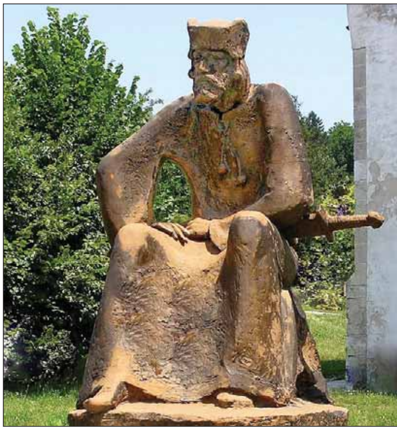
RASTISLAV – monumentálne dielo akademickej sochárky Ludmily CVENGRŔOŠOVEJ v Devíne – na mieste, kde má najväčšie dejinné opodstatnenie.

Rastislav s pomocou Božou však jasne rozpoznal, že nestačí stavať blaho ľudu a upevňovať jeho štátnosť len na politických výpočtoch, vojenskej moci a bohatstve. Uvedomil si, že treba sa držať slov Pána Ježiša: „Hľadajte teda najprv Božie kráľovstvo a jeho