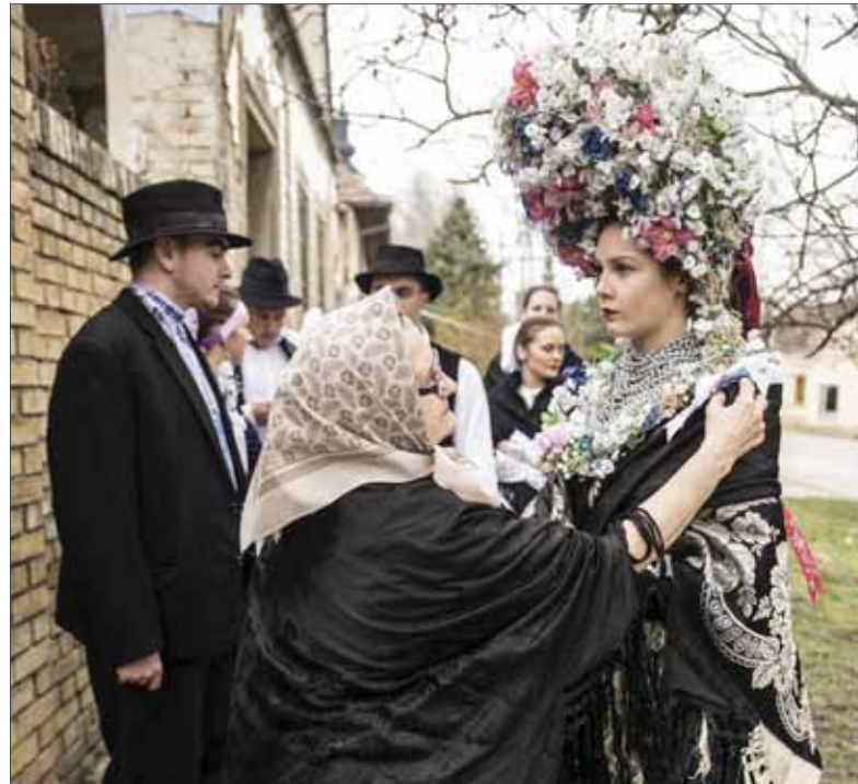
Naši krajanovia v srbskej Vojvodine až úzkostlivo zachovávajú zvyky svojich predkov – až sme na Slovensku neraz prekvapení ich autenticitou. Na snímke tradičná slovenská svadba v Srbsku.

Chceme zapojiť všetky relevantné rezorty. Snažím sa vysvetlovať, že štátna politika voči krajanom je komplex politik jednotlivých rezortov – od kultúry cez školstvo, dokonca aj rezort práce, vnútra či hospodárstva a ďalšie. Pri nastavení a neskôr aj pri realizácii štátnej politiky voči krajanom je nevyhnutná spolupráca celej štátnej správy, ale aj mimovládneho sektora či politickej reprezentácie. O to viac, ak chceme prehodnotiť krajaniskú