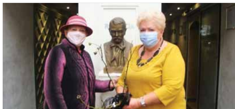
Sadenice vyšľachtenej ruže Hviezdoslav odovzdali matičiari zo Spišskej Novej Vsi aj vedeniu hotela pod týmto názvom v Kežmarku, kde P. Országh býval počas študentských rokov.