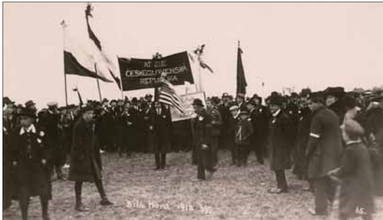
Slovenský a český národ po rozpade Rakúsko-Uhorska prejavil vôľu žiť v spoločnom štáte ako rovný s rovným. V skutočnosti len alternatívne programy osamelých politických strán sa k rovnoprávnemu a spravodlivému usporiadaniu pomerov a vzťahov medzi Čechmi a Slovákmi približovali.

Všetci ľudia mali byť rozdelení do štyroch stavov: poľnohospodári, robotníci, obchodníci a živnostníci a priemyselníci a duševne pracujúci. Do parlamentu mali voliť oprávnení voliči v rámci svojich stavov. Takto kreovaný hospodársko-stavovský parlament mal mať maximálne sto-päťdesiat členov. Senát mal mať maximálne šesťdesiat členov, z toho tretina mala byť priamo volená občanmi, tretinu mali tvoriť virilisti