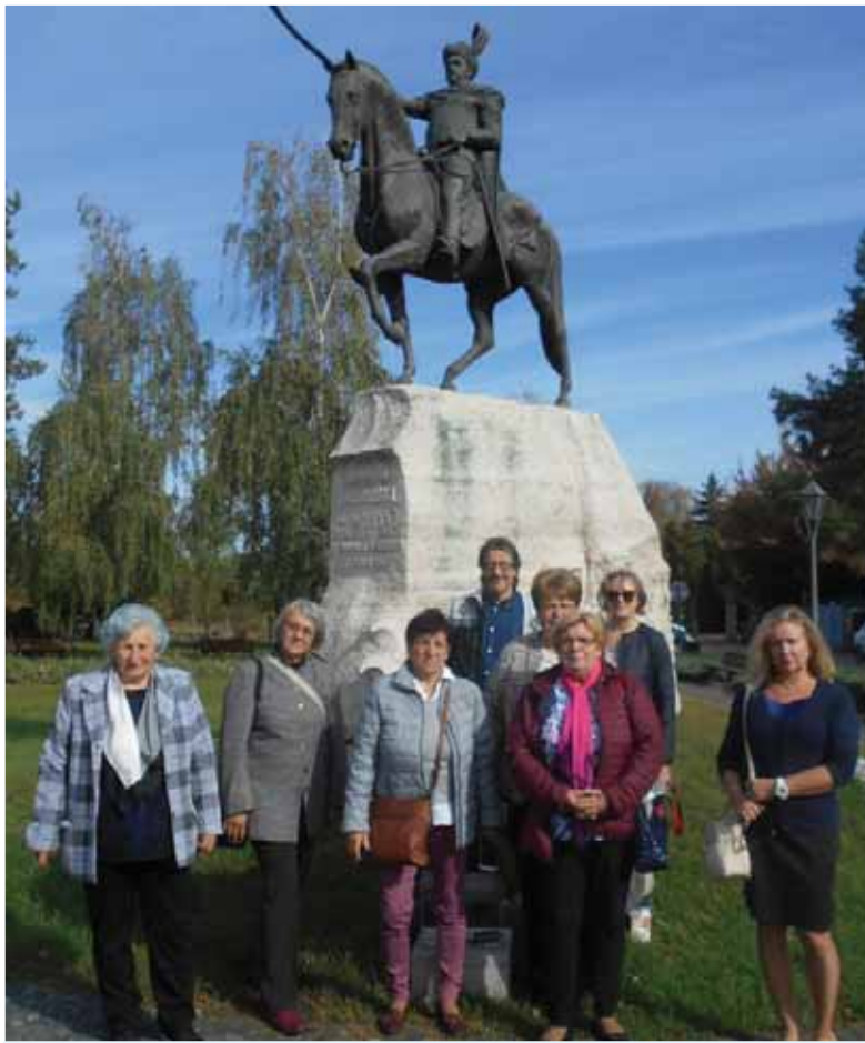
V zahraničí má víťaz nad Turkami pri Viedni poľský kráľ Ján III. Sobieski jediný monumentálny jazdecký pamätník v Štúrove, kde mu nedávno vyjadrili úctu matičiari a jeho tamojší obdivovatelia.

Pamätník kráľa Jána III. Sobieskeho stojí pred rímskokatolíckym farským úradom v blízkosti Kostola sv. Imricha. Meria bezmála sedem metrov, samotná jazdecká socha má 325 centimetrov a je umiestnená na podstavci s fragmentmi rozlomeného kola a tureckého polmesiaca. Autorom je maďarský sochár Lajos Győrfy, ktorý je v Maďarsku známy najmä sochami kráľov a maďarských revolucionárov, výjavmi a symbolmi z revolučných rokov v Maďarsku a Uhorsku. Ján III. Sobieski má iba dve sochy v Poľsku a pamätník v Štúrove je jediným pomníkom v zahraničí. Bronzovú plastiku kráľa Sobieskeho na koni v nadživotnej veľkosti dalo postaviť Občianske združenie Limes Anavum v roku 2008. Na podstavci je vyrytý nápis v poľštine, slovenčine, maďarčine a nemčine: „Prišli sme, videli sme a Pán Boh zvíťazil!“ Ján III. Sobieski, kráľ Poľska, záchranca Európy, na tomto mieste 9. októbra 1683 zvíťazil nad tureckou presilou, čím doviedol Uhorsko a okupované oblasti k definitívnemu oslobodeniu.