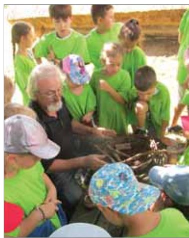
Chlapci a dievčatá sa počas letnej školy v archeoparku zoznámili s ukázkami výroby prúteného náradia.

umiestnený objekt z lokality Nižný Hrušov, okres Vranov nad Topľou,