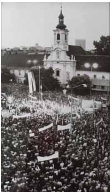
Nielen november 1989 takto davmi nadšených ľudí zaplnil Námestie SNP v Bratislave, ale aj všetky ďalšie rozhodujúce „bitky“ o Slovensko a slovenčinu sa odohrávali v centre slovenského hlavného mesta.

Komárno, Nové Zámky, Šurany, Banská Bystrica Rimavská Sobota,