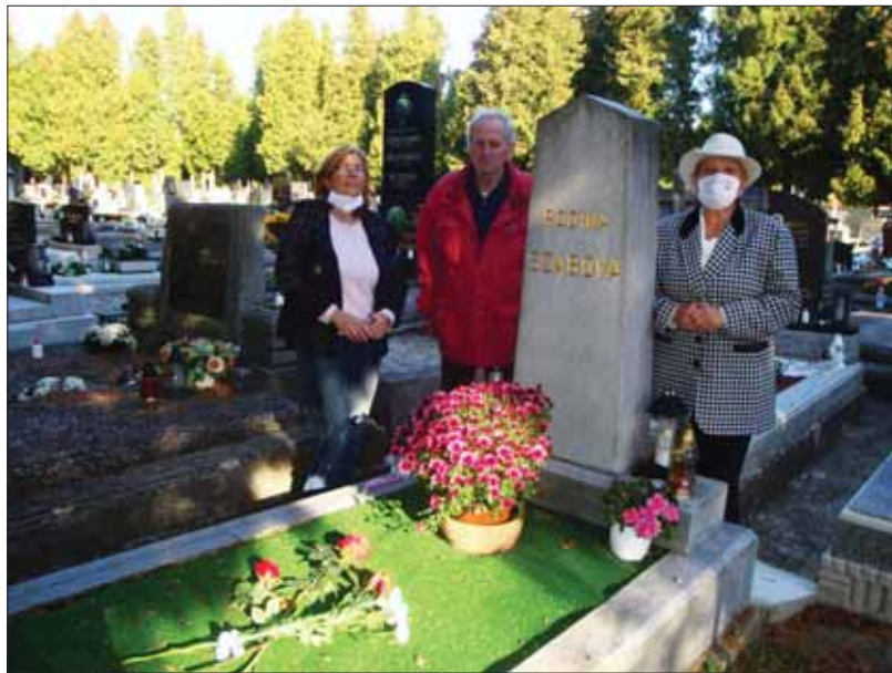
Sté výročie vzniku matičného odboru v Spišskej Novej Vsi si tamojší členovia MS pripomenuli vyznamenaním príležitostnej poštovej pečiatky a počas nedávnej Pamiatky zosnulých aj položením kvetov k hrobom všetkých doterajších predsedov matičnej organizácie.