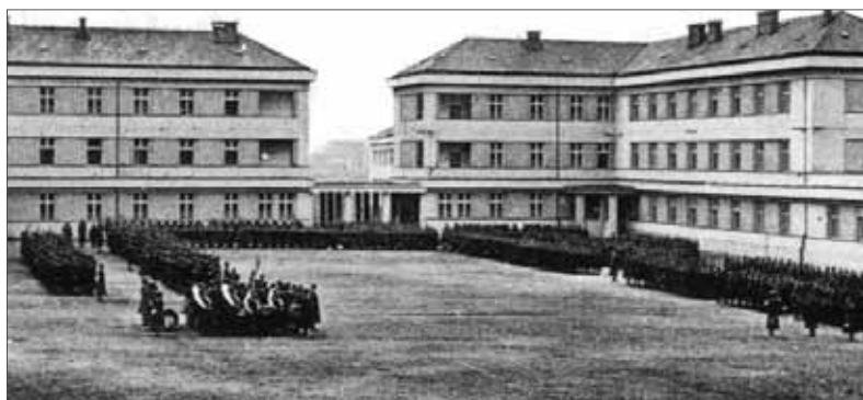
Podľa predstáv stúpcov stavovského štátu mali byť armáda a polícia výhradne používané na obranu štátu a ochranu občanov – na verejné ciele, a nesmeli byť zneužívané na parciálne politické ciele mocenských zoskupení.

z verejného života, teda rektori univerzít, čelní predstavitelia cirkví, krajskí prezidenti (šéfovia územných samospráv), šéfovia obchodných komôr a podobne, no a nakoniec tretina členov mala byť vymenovaná hlavou štátu (prezidentom) z najvýznamnejších osobností krajiny. Vládu malo tvoriť osem ministrov odborníkov,