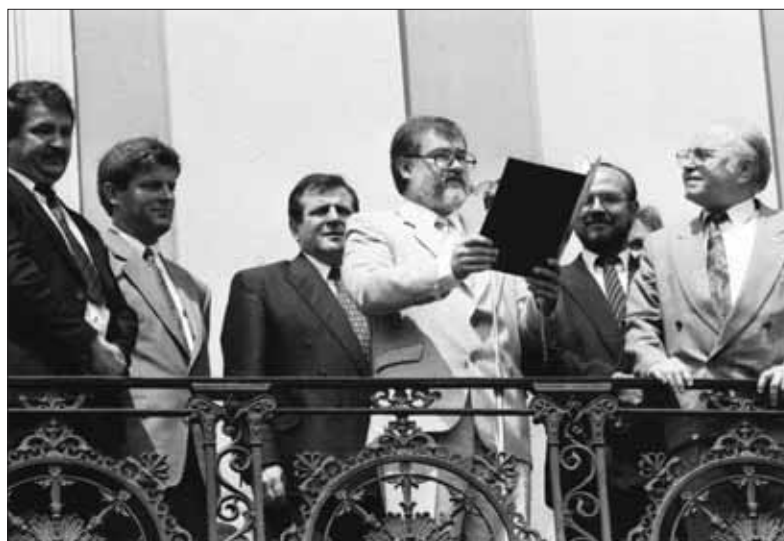
Balkón historickej Slovenskej národnej rady na Župnom námestí v Bratislave bol svedkom mnohých prelomových udalostí – zápasov o demokratickú svojbytnosť nášho štátu i jej vyhlásenia.

Východiskom na dosiahnutie cieľa ostávalo celoštátne refe-