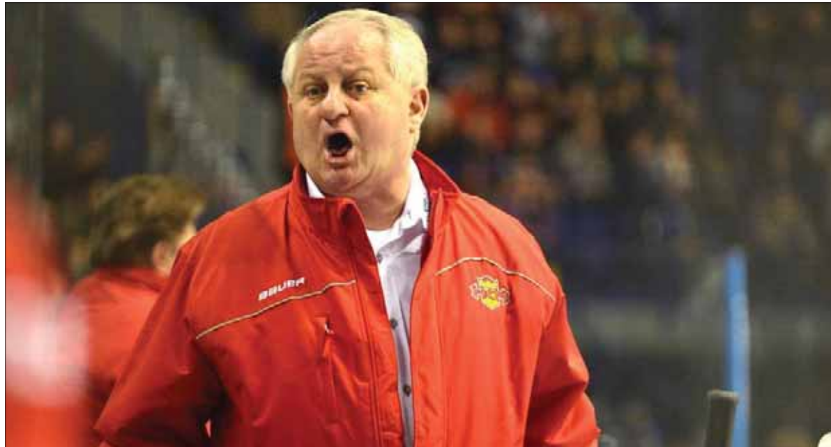
Július ŠUPLER je slovenská trénerská hokejová legenda. Výrazne sa pričínal o vzostup slovenského hokeja v minulých rokoch a o svojich manažerských kvalitách presvedčil aj na trénerských angažmánach v zahraničí.

Podľa vtedy platných predpisov IIHF sa nástupníckou reprezentáciou do nasledujúceho obdobia stala tá, ktorá disponovala vyšším percentuálnym podielom hráčov v predchádzajú-