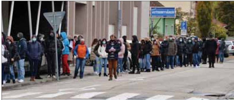
Okres Dunajská Streda bol jediný v južných oblastiach, kde sa podľa rozhodnutia príslušných orgánov muselo uskutočniť druhé kolo celoplošného testovania. Verme, že s menšími radmi a radmi s dodržiavaním rozstupov...

„Nemecko, čiže tiež štát EÚ, ponúka zoznam antigénových testov. Je ich okolo stopäťdesiat z celého sveta, ale nie je medzi nimi ani jedna kórejská firma.“ Tvrdí Štefan Harabin vo svojom statuse na sociálnej sieti. Podľa neho „testy, ktoré sa použili u nás cez víkend, boli kreované na