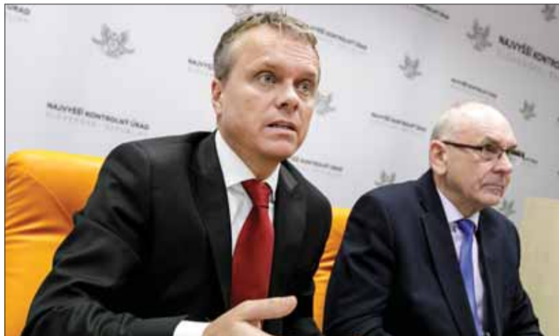
Vedenie Najvyššieho kontrolného úradu pomerne často informuje verejnosť prostredníctvom médií o výsledkoch svojich previerok – tak to bolo aj v súvislosti s rizikami pri zabezpečení dostatočného množstva medicínskeho materiálu na zvládnutie epidemiologickej situácie.

• Ukazuje sa, že otvorenosť Európy i sveta je významným rizikom spojeným s ohrozením zdravia jednotlivcov i širokej verejnosti. NKÚ v rámci kontroly preveril alebo preveruje riziká vzniku a prenosu nebezpečných infekčných och-