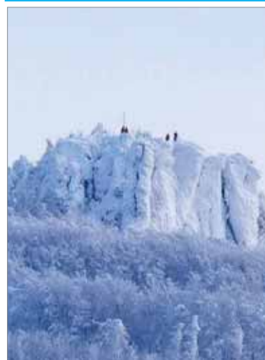
Sninský kameň vyzdobený srieňom

na pôvodnom mieste. Ak sa po železnom rebriku vyštveráte na Malý Sninský kameň, nájdete tu osadenú schránku s vrcholovou knihou, kde môžete zaznamenať svoj výstup. Podmaňujúci je aj výhľad na Veľké vihorlatské