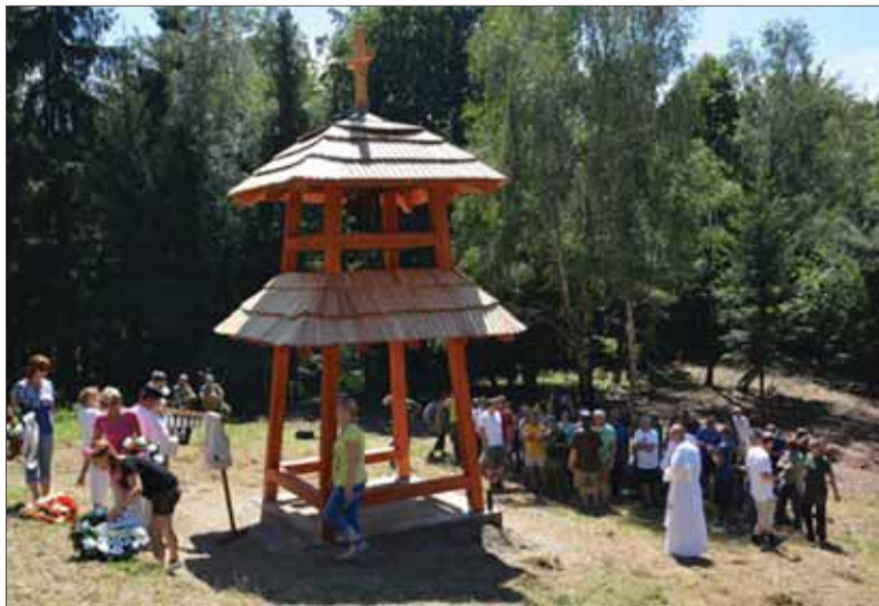
Zvonica na kóte Skory sa stala miestom mnohých turistických vychádzok i pietnych aktov.