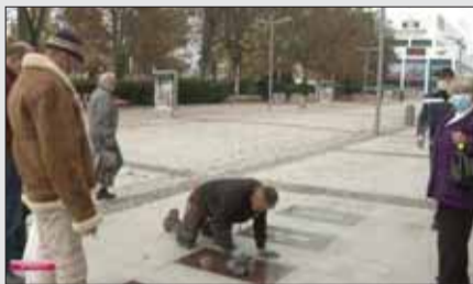
Aj vo Zvolene sa rozhodli vyzdvihnúť prínos osobností, ktoré tu žili alebo pre mesto vykonali zásadnú prácu umiestnením tabuľky s ich menom na Chodník slávy.