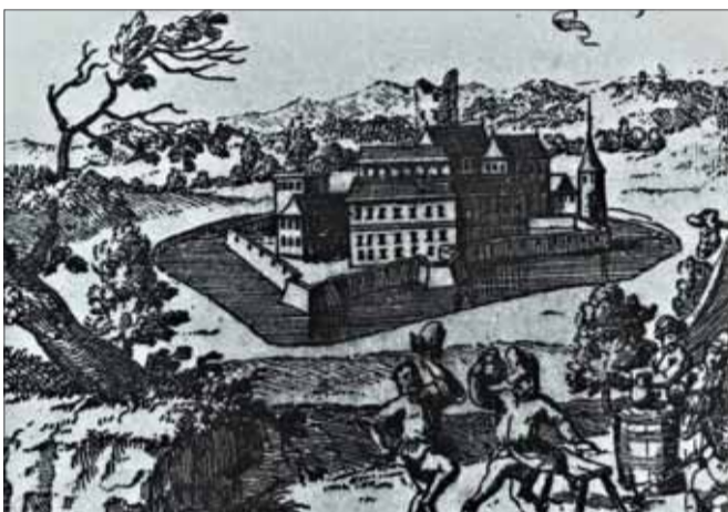
Vranovské opevnené sídlo – medirytina Justa van den Nypoorta z roka 1868

sú dvojpodlažné s obdĺžnikovým pôdorysom a zaklenuté valenými samonosnými klenbami, ktoré sú vzájomne prepojené masívnymi arkádovými oblúkmi. Priestory prvého podzemného podlažia majú rozmery desať krát deväť metrov a ich klenby dosahujú výšku aj vyše štyroch metrov. Pamiatkari podľa prieskumu konštatovali, že ide o stredovekú stavbu, objekt z prvej polovice 15. storočia. Na základe týchto skutočností Ministerstvo kultúry Slovenskej republiky vyhlásilo v roku 1994 objekt za národnú kultúrnu pamiatku.