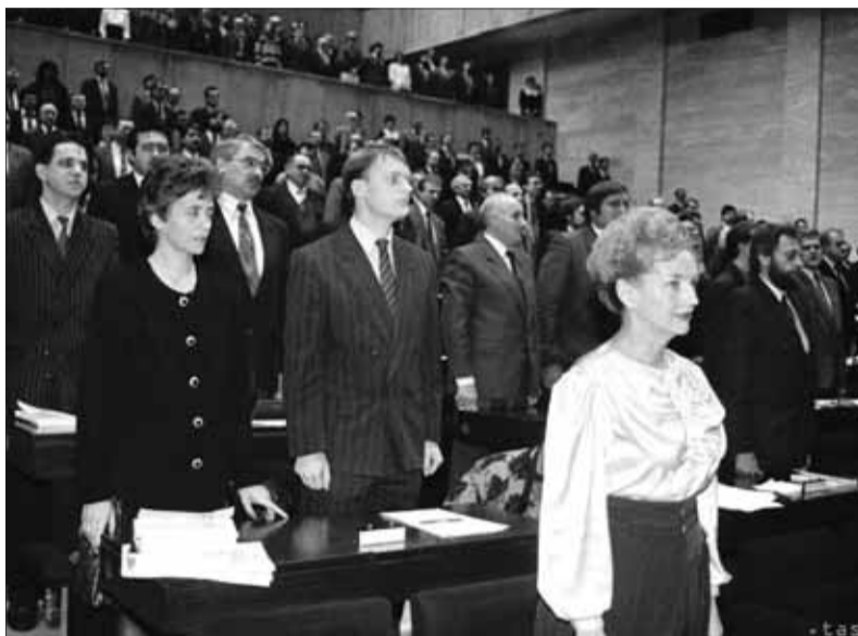
Slávnostné aj dramatické chvíle vo Federálnom zhromaždení ČSFR, keď sa rozhodlo o zániku federácie a vzniku dvoch samostatných štátov – Českej republiky a Slovenskej republiky.

Prvým veľkým sporom bola tzv. pomlčková vojna na jar 1990. Slováci týmto spôsobom právom žiadali, aby oficiálny názov spoločného štátu pred svetom jasne dokazoval, že bol štátom dvoch suverénnych a štátotvorných národov Slovákov a Čechov. Po dohode slovenských a českých poslancov obe komory Federálneho zhromaždenia prijali kompromisný názov Česká a Slovenská Federatívna Republika. Druhým veľkým sporom po prvých slobodných voľbách sa stal kompetenčný zákon. Ani v tomto prípade česká strana nebola ochotná preniesť z federálnej pôsobnosti väčšinu dôležitých právomocí na republiky (Slovenská republika, Česká republika). V decembri 1990 obe komory Federálneho zhromaždenia tak schválili ďalší kompromisný návrh, ktorý ani zďaleka nespĺňal pôvodné a od-