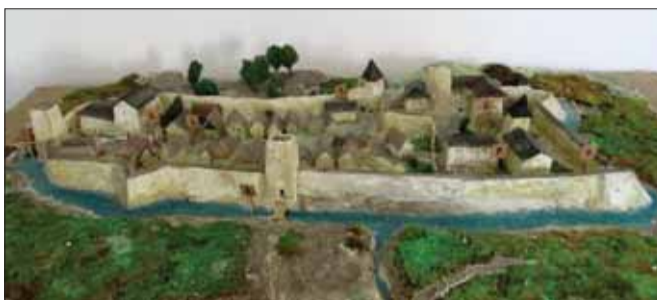
Maketa vodného hradu vo Vranove

V roku 1992 sa počas stavebných prác v areáli gymnázia, približne dva metre pod úrovňou terénu, našli podzemné priestory. Geologický prieskum vzápätí potvrdil, že podzemné priestory