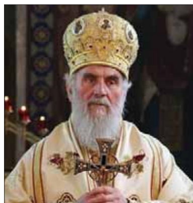
Srbi sa so smútkom rozlúčili so svojim patriarchom Jeho Svätosťou Irinejom, ktorý bol mimoriadne obľúbenou osobnosťou.

Patriarcha Irinej bol v poradí štyridsiatym piatym srbským patriarchom a celkovo päťdesiatym šiestym najvyšším cirkevným predstaviteľom SPC. Prví jedenásti mali totiž len titul archiepiskopa (ekvivalent arcibiskupa), pričom ten dvanásty – sv. Joanikije II., sa v roku 1346 stal prvým srbským patriarchom. Srbský patriarchát následne s prestávkami spôsobenými Turkami existoval do polovice 15. storočia, následne bol obnovený v roku 1557