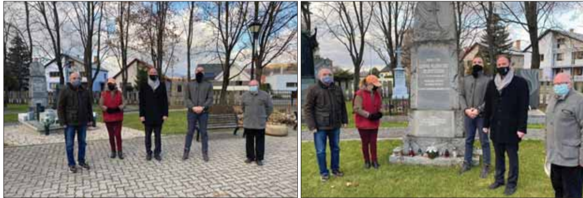
Epidémiou Covidu-19 „zredukovaná“ hĺstka liptovskomikulášskych matičiarov si počas Pamiatky zosnulých uctila významné slovenské osobnosti a národných dejateľov na vrbickom cintoríne.

Mikulášski matičari si každoročne pri príležitosti Pamiatky zosnulých pripomínajú významné osobnosti, ktoré sa narodili alebo pôsobili v Liptovskom Mikuláši a sú pochované na Vrbickom cintoríne. Tento rok pre mimoriadne opatrenia nebolo možné toto pietne miesto navštíviť. Preto až 20. novembra tak urobili niekoľkí matičari.