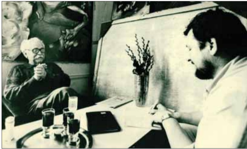
Národný umelec Vincent HLOŽNÍK nepovažoval Maticu slovenskú za prežitok. Aj preto jej s dôverou daroval sto obrazov ako svoj príspevok na Národný poklad.