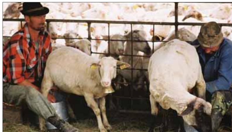
Počas celého marca budúceho roka môžu poľnohospodári a majitelia všetkých druhov fariem a chovov žiadať o podporu do zvýšenia kvality živočíšnej výroby aj do špeciálnej rastlinnej výroby.

Podpora sa týka aj veľmi dlho očakávaných závlah, podmienkou sú investície do nových závlahových systémov (koncových zariadení), všetko s cieľom zvýšiť produkciu a jej kvalitu. Ide však aj o investície spojené so zavádzaním inovatívnych technológií v súvislosti s variabilnou aplikáciou organických a priemyselných hnojív do pôdy a ostatných substrátov s cieľom zlepšiť kvalitatívne vlastnosti a úrodnosť pôdy a ochrany pred jej degradáciou. Projekty bude vyberať PPA na