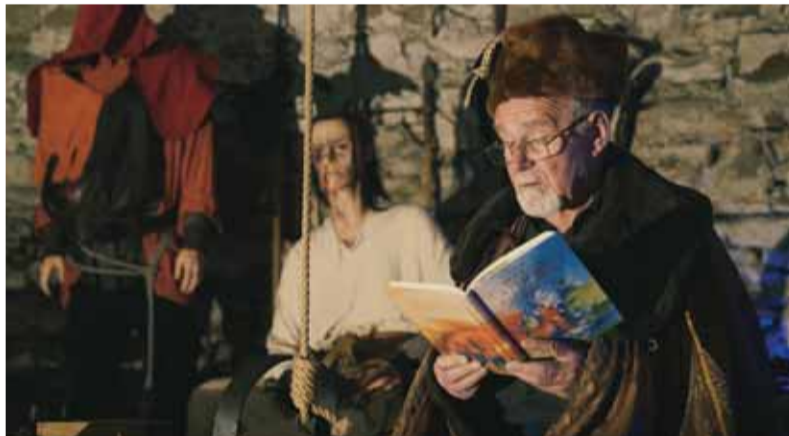
Ustanoviteľ si uvedomuje, že deti nesmú stratiť kontakt so slovenskou literatúrou a dejinami, preto podporuje „čítačky“ literatúry pre deti – ako na snímke aj v Jánošíkovom múzeu v Liptovskom Mikuláši.