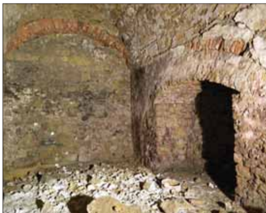
Pohľad do miestnosti suterénu renesančných pivníc z druhej polovice 16. storočia