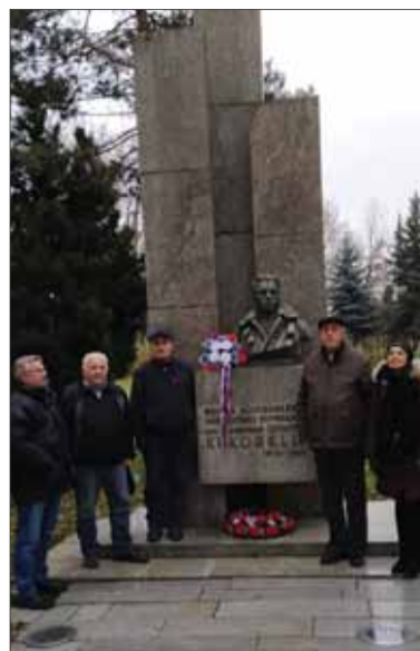
Košickí matičiari si počas Pamiatky zosnulých uctili aj hrdinu SNP generálmajora in memoriam Ľudovíta Kukorelliho.

Pri príležitosti sedemdesiateho štvrtého výročia SNP v roku 2018 prezident Andrej Kiska povýšil Ľudovíta Kukorelliho do hodnosti generálmajora in memoriam. V Košiciach sa matičné podujatie venované tomuto hrdinovi SNP uskutočnilo 24. novembra 2018. Začalo sa tichou spomienkou na Verejnom cintoríne, pokračovalo pri pamätníku Ľ. Kukorelliho v Mestskom