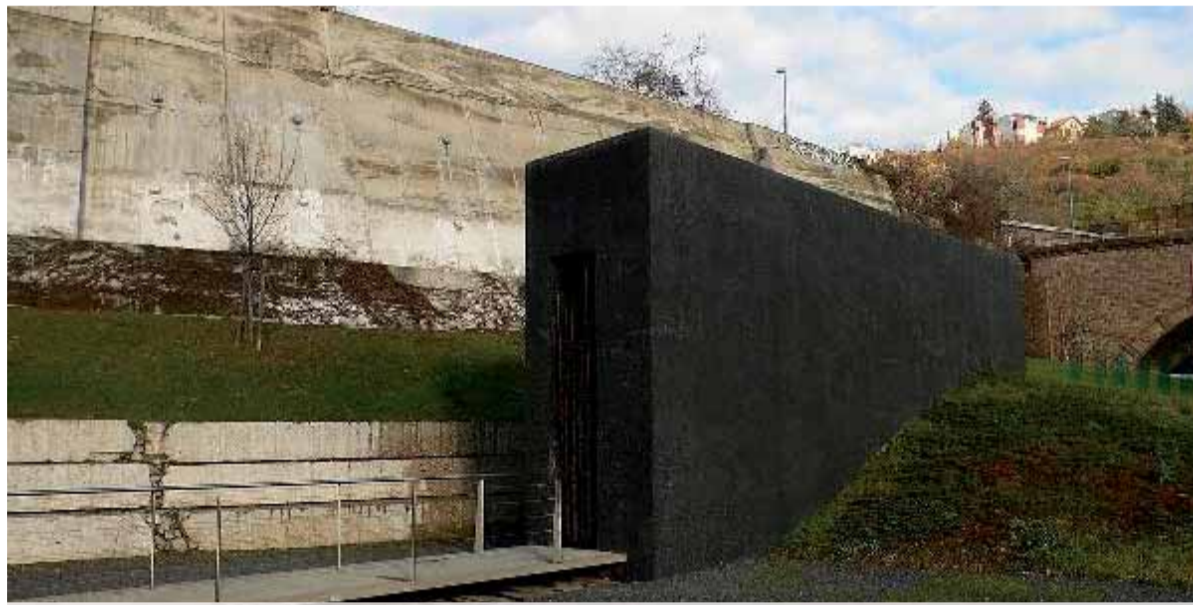
Mauzóleum Chatama Sofera pod Hradným vrchom v Bratislave

Začnime – ako sa hovorí – od Adama. Židia sa na Slovensku objavili okolo roku 70 n. l. ako otroci rímskych légii. O dvesto rokov už légie sprevádzali ako obchodníci. Ďalšia skupina na naše územie prišla so starými Maďarmi – boli to bojovníci z kmeňa Karaitov, ktorí sa zúčastnili na bojových výpravách v Európe. Prví židovskí osadníci sa tu usadili koncom prvého tisícročia a zaoberali sa najmä rozličnými formami obchodu a remesiel. Len čo ich bolo viac, uhorskí panovníci zaviedli na nich segregáciu: nesmeli chodiť do školy s kresťanskými deťmi, nemohli sa voľne usadzovať v mestách, pričom v banských mestách mali pobyť úplne zakázaný, nemohli vykonávať remeslo a zastávať úrady.